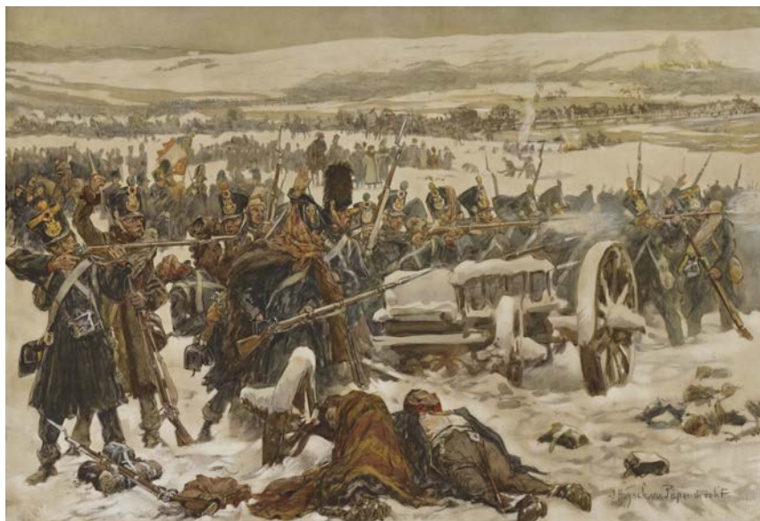
'Hollandse infanterie bij de bruggen over de Berezina, 1812', door Jan Hoyneck van Papendrecht.

de artillerie. Gelukkig heeft de slimme Eblé wagens met gereedschap en steenkool en veldsmidsen achtergehouden. De bouw van de brug begint om acht uur 's ochtends. Kapitein Benthien en zijn pontonniers werken in ijskoud water. Ze staan tot aan de hals tussen de ijsschotsen. Af en toe glijdt iemand uit en wordt door het water meegesleurd. Het ontnemt de anderen niet de moed. Tegen een uur 's middags is de eerste brug af, 100 meter lang en 4 meter breed. Even verderop is een andere eenheid Hollandse pontonniers bezig met de tweede brug. Om vier uur is deze klaar. De geïmproviseerde bruggen zijn niet stevig en moeten verschillende keren gerepareerd worden. Elke keer moeten de pontonniers terug het water in. Ook 's nachts. Napoleon stuurt Oudinots korps als eerste naar de overkant. Dan volgen een voor een de andere korpsen. De overtocht verloopt ordelijk, totdat de grote massa van achterblijvers en burgers arriveert. Dan ontstaat groot gedrang. De hel breekt goed los als de Russen met hun artillerie de