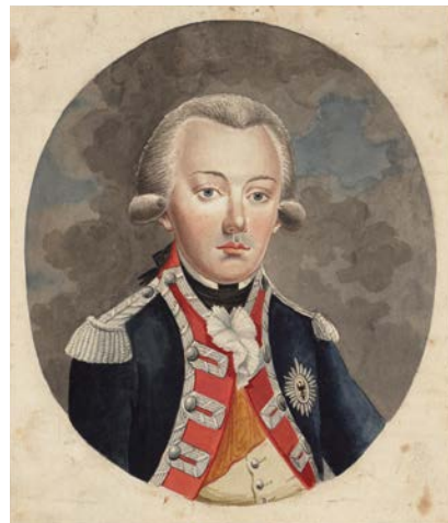
Prins Frederik (1774-1799) in kolonelsuniform. De prins bleek een talentvol officier. Hij herstelde echter nooit van zijn verwonding opgelopen in de slag bij Wervik. Hij overleed als Feldzeugmeister (te vergelijken met luitenant-generaal) in Oostenrijkse dienst.

Hoe het anders kan, laat Willemstad zien. Aan de zuidelijke oever van het Hollandsch Diep houdt enkel nog deze vesting stand. De gouverneur biedt met een klein garnizoen van 500 man hevig weer-