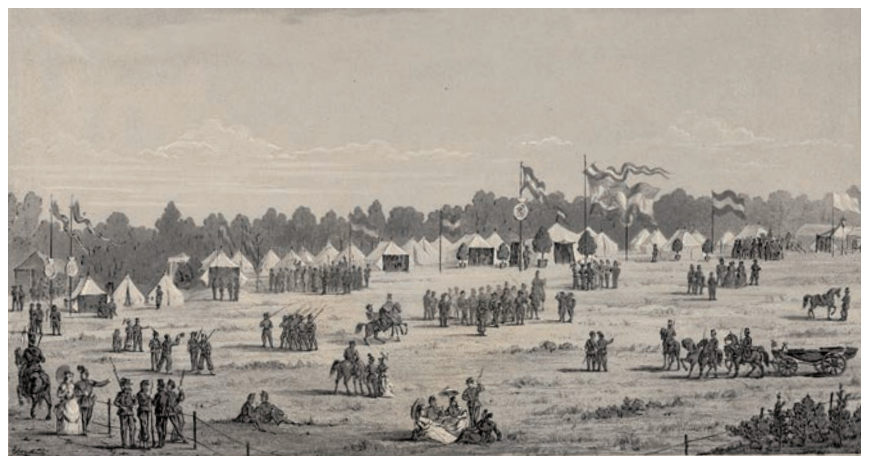
Het tentenkamp op de Waalsdorpervlakte.