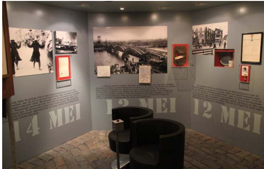
Aan de strijd om de Rotterdamse Maasbruggen in 1940 is een aparte ruimte gewijd.