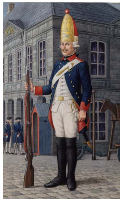
Grenadier van een Brunswijks infanterieregiment in Nederlandse dienst, waarschijnlijk staand voor de Hoofdwacht te Maastricht. Getekend door Cees Boode. (Collectie Legermuseum)