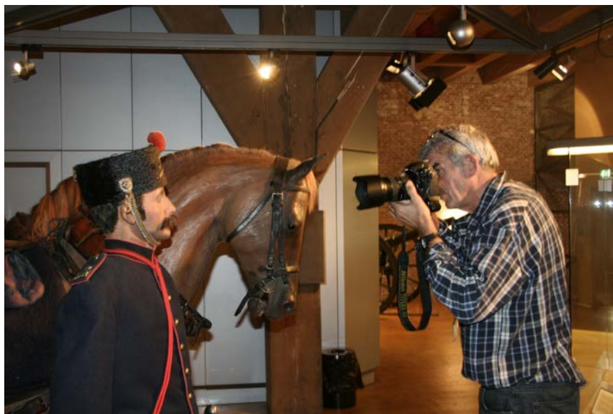
Het fotograferen van een begeleider van de paardenambulance, circa 1914.

leurs. Ze zitten wel ingenieus in elkaar, maar mijn 'voorkeur' gaat uit naar de oude tijd toen er nog eerlijk gevochten werd met knuppels en zo. Niet met