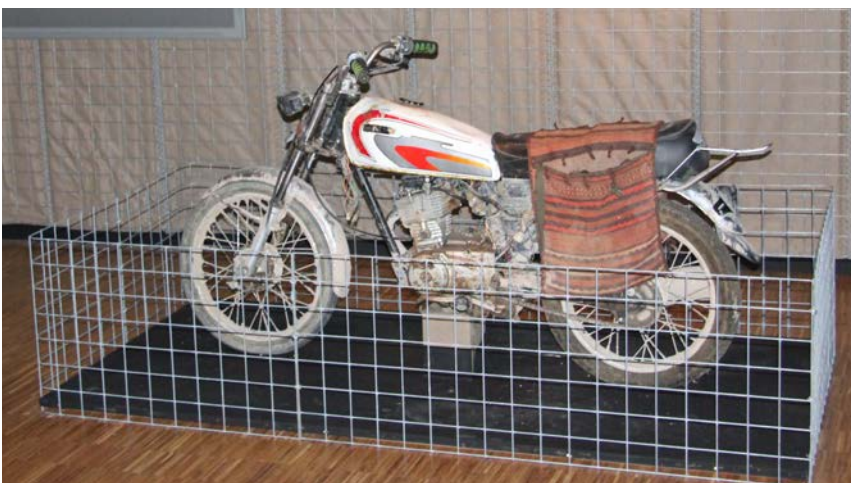
Het brommertje van de wapens smokkelende Afghaan.