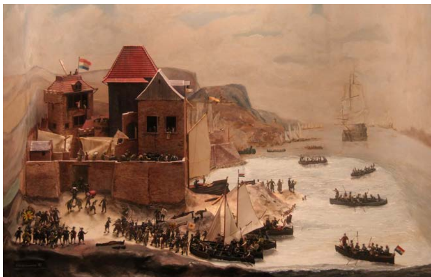
De aanval op fort Sheerness bij Chatham was het eerste wapenfeit van de mariniers.

De bovenste verdieping is nog klassiek ingericht en geeft een beknopt maar goed overzicht over de historie van het Korps Mariniers en de Mariniersbrigade. De buste van Michiel Adriaenszoon de Ruyter en een diorama van de aanval op fort Sheerness markeren het begin. In 1665 vatte raadspensionaris Johan de Witt het plan op soldaten mee te sturen met de vloot voor gevechten op de kust. Het eer-