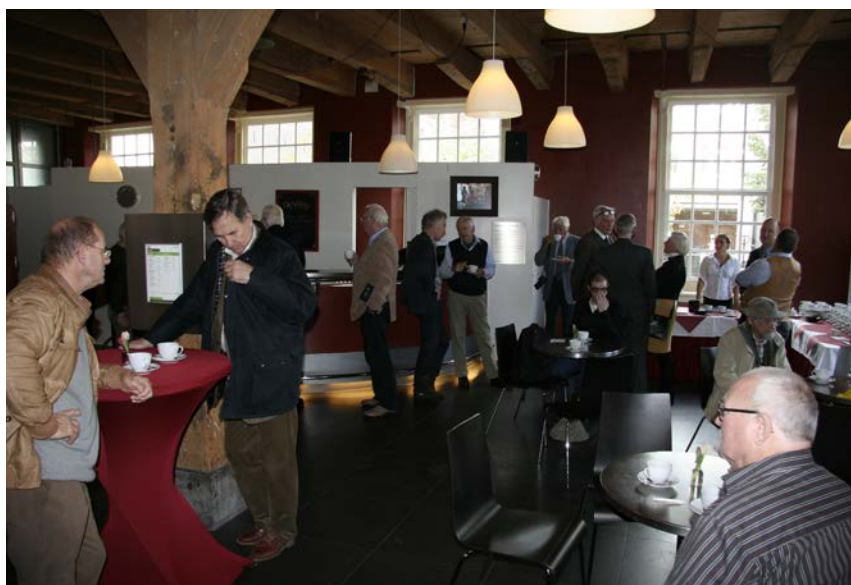
De Vrienden kwamen bijeen in het museumcafé.