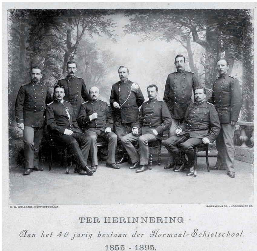
De officieren van de Normaal Schietschool.

Door de intensieve werkzaamheden van de school, kreeg deze langzamerhand een permanente status. En kreeg de school onderkomens ter beschikking in Den Haag en Waalsdorp. Ook werden de cursussen uitgebreid in de jaren 1860 met opleidingen in gymnastiek, zwemmen en schermen. Essentiële lichaams oefeningen die nodig waren voor een goed functioneren op het slagveld. In 1913 werd het gymnastiekonderwijs van de Normaal Schietschool ondergebracht in de nieuw opgerichte militaire gymnastiekschool te Utrecht. De school kon zich weer gaan focussen op het schietonderwijs. Het volgende jaar brak echter de wereldbrand uit, die vier jaar zou duren. Tijdens