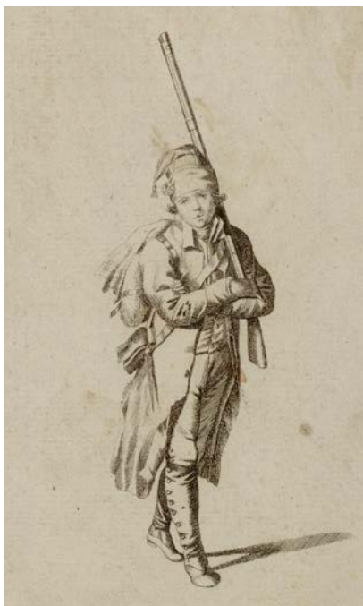
Tekening van omstreeks 1800 van een Frans soldaat.

Bevelhebber van de Franse troepen in het noorden is generaal Charles-François Dumouriez. Deze oud-officier van het