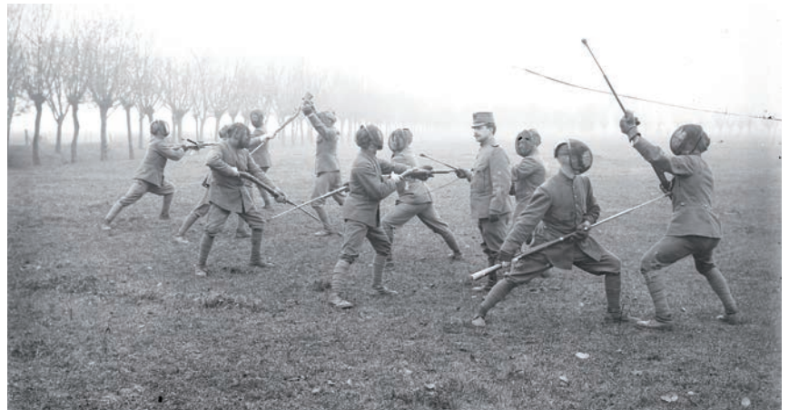
Tot in de twintigste eeuw bleef bajonetschermen een belangrijke rol spelen tijdens de militaire opleiding. Foto omstreeks 1918.

In de eerste jaren van haar bestaan had de school een tijdelijk karakter. De meeste leden van de adviserende commissie van de Normaal Schietschool waren ook lid van de al enige tijd bestaande commissie tot het beproeven van getrokken vuurwapenen. Elk jaar van mei tot en met