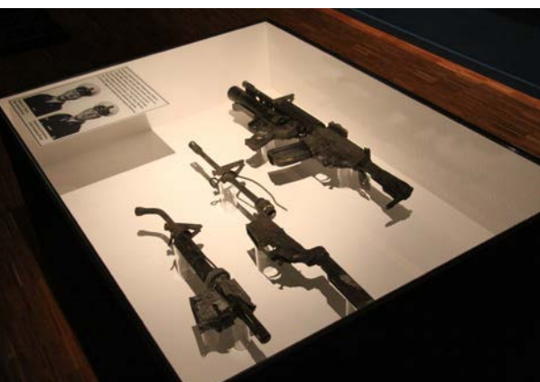
Verbogen wapens zijn de stille getuigen van het effect van de explosie.