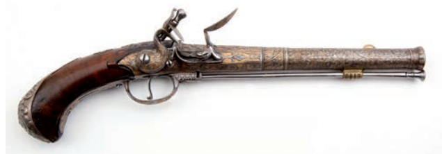
Dit fraaie achttiende-eeuwse Franse pistool behoort ook tot de schenking. De luxe afwerking misstaat niet in een koninklijke setting.

Als we de objecten bekijken die zich in de schenking bevinden, zijn er een aantal categorieën te onderscheiden. Ten eerste zijn er natuurlijk de wapens die van de vorsten zelf afkomstig zijn en die door hen gebruikt of alleen gedragen zijn. Voorbeelden hiervan zijn schermdegens met een koninklijk monogram, een sabel met de initialen van prins Frederik (1797-1881, de broer van koning Willem II) en enkele luxe sabels. Daarnaast zijn er ook de relatiegeschenken. Stukken die ongetwijfeld zijn geschonken aan de koninklijke familie ter ondersteuning van de nauwe banden van de schenker met het Koninklijk Huis. Het betreft veelal exotische stukken, die zeker niet uit regulier Europees bezit komen, maar bijvoorbeeld uit Noord-Afrika, Arabië en Azië. De enkele Russische stukken (een kozakkendolk en een Russisch infanteriegeveer uit 1837) kunnen wellicht zijn meegekomen met prinses Anna Paulowna (echtgenote van Willem II) en haar gevolg. Tot dat archiefonderzoek heeft plaatsgevonden blijven de herkomstgegevens echter nog onduidelijk.