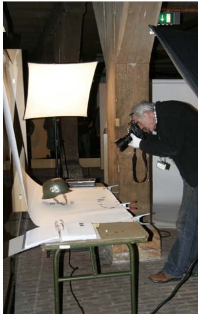
Een Stahlhelm van de Duitse SS krijgt een plekje in de digitale museumcollectie.

Moeilijk werk? "Nee, het is niet moeilijk. Sommige voorwerpen zijn nogal zwaar en dat is lastig voor je rug. Voor mij is het allemaal bijzonder spul. Ik heb overigens niet zoveel met geweren en mitrail-