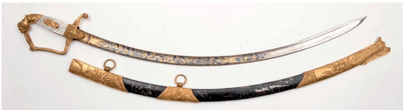
Een van de blanke sabels uit het Koninklijk Huisarchief. Dit wapen uit de eerste helft van de negentiende eeuw is dusdanig luxe uitgevoerd, dat het logisch is om aan te nemen dat deze sabel is gedragen door koning Willem I of Willem II. (Collectie Legermuseum)