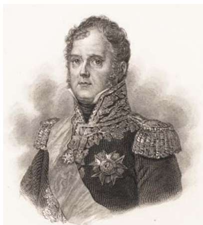
Maarschalk Michel Ney. Door zijn heldhaftige en inspirerende leiding aan de achterhoede van de Grande Armée verdiende hij de bijnaam 'dapperste der dapperen'.

Op 26 november geeft Napoleon de genist Eblé opdracht twee bruggen te slaan. Eblé beschikt over 400 vooral Nederlandse pontonniers. Ze moeten het doen met houten planken van huizen en boomstammen. Napoleon had alle pontons laten vernietigen. De paarden waren nodig voor