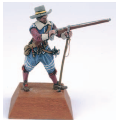
Loden gepolychromeerde figuur voorstellende een zeventiende-eeuwse musketeer.

Hoewel de schalen waarop de tinnen figuurtjes worden gemaakt, niet zijn afgestemd op die van de miniatuurspoorwegen, hebben beide hobbygebieden bepaalde overeenkomsten. Ook bij de treinen zag je het onderscheid groeien tussen eenvoudig speelgoed en de steeds geavanceerder modelbaan. Naarmate het ‘tinnen soldaatje’ meer geperfectioneerd werd in vorm en in beschildering, spreken liefhebbers van dit genre dan ook van ‘modelfiguren’ als onderscheid met het simpeler kinderspeelgoed. Nationaal en internationaal worden modelfiguren niet alleen verzameld, maar ook door geïnteresseerden zelf gemaakt (opnieuw een overeenkomst met de modelspoorweg). Daarnaast zijn ze ook fabrieksmatig ver-