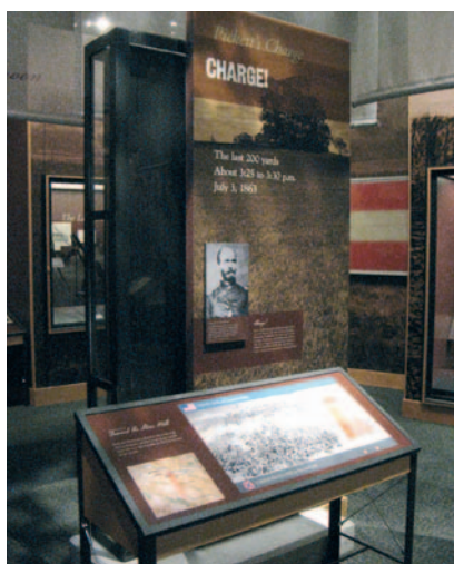
In het museum natuurlijk veel aandacht voor de slag. Hier haakt de tentoonstelling in op het beslissende moment, Pickett's Charge. De desastreuze aanval op de derde dag.

U bent nu met voldoende kennis gewa- pend om het museum te bezoeken. De