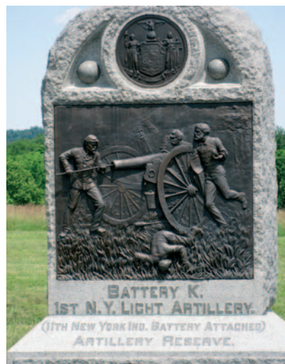
Monument op Cemetery Ridge voor een artilleriebatterij uit de staat New York.