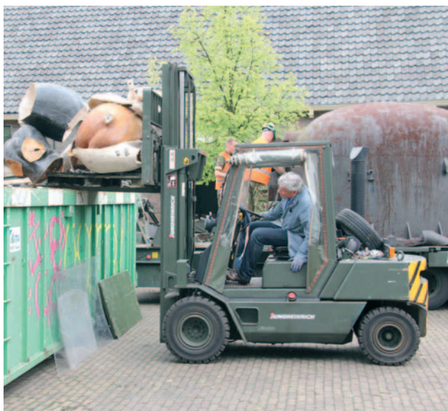
Veel niet meer bruikbare materialen worden gedumpt.

Terwijl de militairen bezig waren met het laden, werden vanuit de depots nog verhuisdozen en kasten per vrachtauto afgevoerd. Midden op het binnenterrein van de Paardenmarkt stonden enkele containers voor overtollig geworden materialen. Zo werden oude kunststofpaarden en kapotte uniformpoppen opgeruimd. Maar ook tentoonstellingspanelen, waar het museum niets meer mee kon, verdwenen in de grote bakken. Met name voor foto's die niet meer bruikbaar waren, bestond wel belangstelling bij de militairen om hun kazerne wat op te sieren. Een