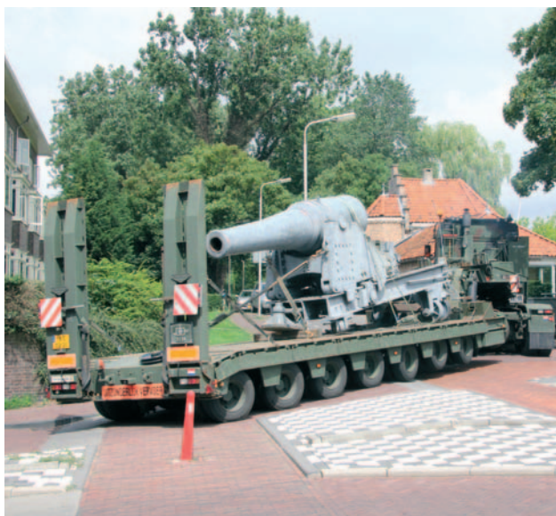
Het vestinggeschut 24 cm ijzer vertrekt uit Delft.