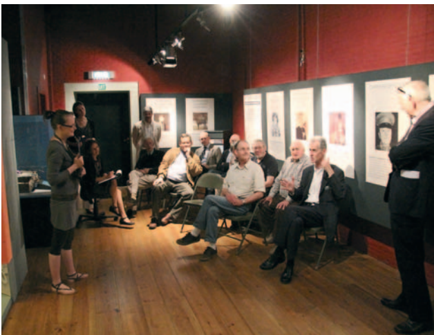
De Vrienden discussiëren over de presentatie van de tentoonstelling.