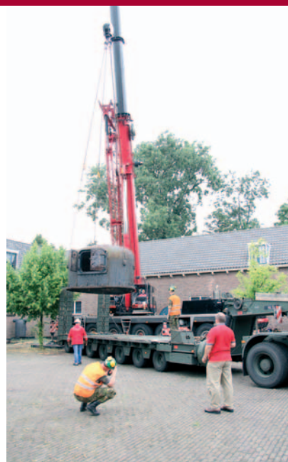
De geschutskoepel wordt voorzichtig op de dieplader geplaatst.

goede vorm van recycling! Alleen enige gevulde kostuumdozen en een partij wapens moesten daarna nog enkele dagen wachten op (beveiligd) transport naar Soesterberg. Maar toen was depot Paardenmarkt na 33 jaar ook definitief verleden tijd.