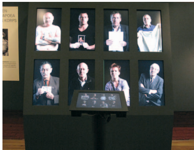
Aangrijpende verhalen waar een voorwerp aan verbonden is.