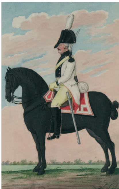
Cavalerist Bataafse Republiek, 1802. Tekening in kleuren J.J. Genaert, in: Bijzondere kledinge der Bataafsche Troupes , z.p. 1802. (Collectie Legermuseum)