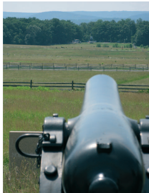
Het schootsveld van de Noordelijke artillerie op Cemetery Ridge. Woensdagmiddag 3 juli 1863 vielen duizenden Zuidelijken hier aan over een front van anderhalve kilometer breed.

Als u de opmars van de Zuidelijken volgt door het stadje en het zuidoosten aanhoudt, komt u op East Cemetery Hill en Culps Hill. Hier vond de linkerflankaanval van de Zuidelijken plaats op dag 2. De aanval op de rechterflank vond in het zuidelijk deel van het slagveld plaats. Op Warfield Ridge stelde generaal Longstreet zijn troepen op. Vanaf hier vielen ze onder andere Little Round Top aan. Deze heuvel gaven de Noordelijken echter niet uit handen. Dag 3 speelde zich vooral af in het centrale deel van het slagveld. Op Seminary