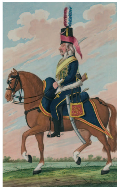
Huzaar Bataafse Republiek, 1802. Tekening in kleuren J.J. Genaert, in: Bijzondere kledinge der Bataafsche Troupes , z.p. 1802. (Collectie Legermuseum)

plaar bezat. Er bestaan – voor zover bekend – niet veel separaat uitgegeven reglementen voor het Bataafse leger. En van de weinige uitgaven zijn niet veel exemplaren bewaard gebleven. Van zowel de cavalerie als de infanterie bestaan uiteraard ook exercitiereglementen uit de Staatse tijd. Het laatste voorbeeld daarvan voor de cavalerie dateert uit 1773, met een gedeeltelijke mutatie uit 1791. Tijdens het Koninkrijk Holland zou het leger weer nieuwe exercitiereglementen krijgen, die in tegenstelling tot die van de Bataafse Republiek paradoxaal genoeg zijn gebaseerd op Franse reglementen van voor 1795. Het reglement voor de Bataafse cavalerie was dus in wezen nog ‘Hollands’.