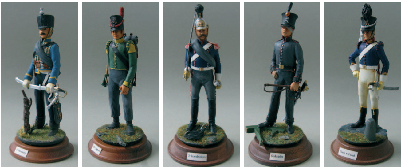
Soldaten van het Nederlandse leger uit 1815.

Nationaal Tinnen Figurenmuseum in Ommen, dat in 1985 werd gesticht door de voorloper van De Tinnen Tafelronde. Militaire modelfiguren en diorama’s zijn echt niet alleen een particuliere hobby. Door de jaren heen hebben bevelhebbers, officieren en onderofficieren van de krijgsmacht ze gebruikt voor instructiedoeleinden. Vonk: “De Nederlandse Defensie Academie in Breda heeft een grote collectie militaire figuren, al was het alleen maar om de uniformen van anderen te herkennen. Militaire commandanten bouwen maquettes met opstellingen van de tegenstander als voorbereiding op operaties. Een sergeant, die je met zijn groep op verkenning stuurt, zal doorgaans zijn mannen informeren met behulp van een maquette. Al maakt hij die maar op een stuk zandgrond bij de kazerne! Maar ook bij grote operaties als Overlord in 1944, de slag aan de Somme (1916) of recent in Afghanistan gebeurt dat. Ik ben er zelfs van overtuigd dat Maurits voor de slag bij Nieuwpoort gebruik heeft gemaakt van diorama’s met soldaatjes!”