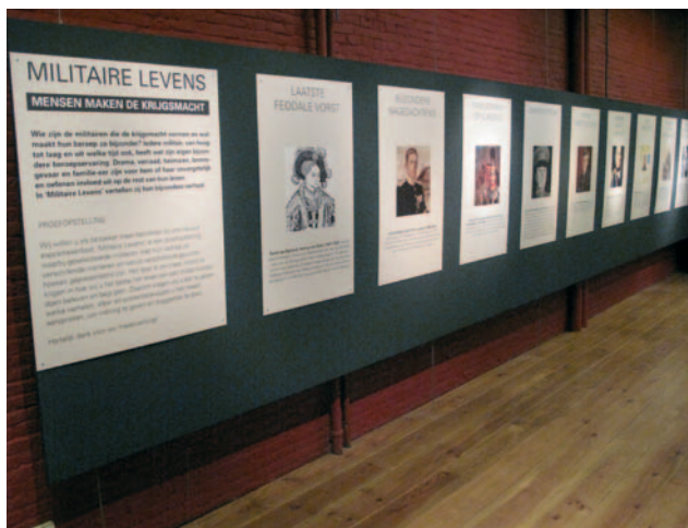
De expositie Militaire Levens in de Rode Zaal van het Legermuseum.

De naar zijn vrienden hunkerende dienstplichtig militair De Pauw (lichting 1965-4) ervoer zijn functie als messbediende als een luizenleventje. Hij had veel vrije tijd waarin hij contact hield met zijn grote vriendenkring in de burgersamenleving en luister-