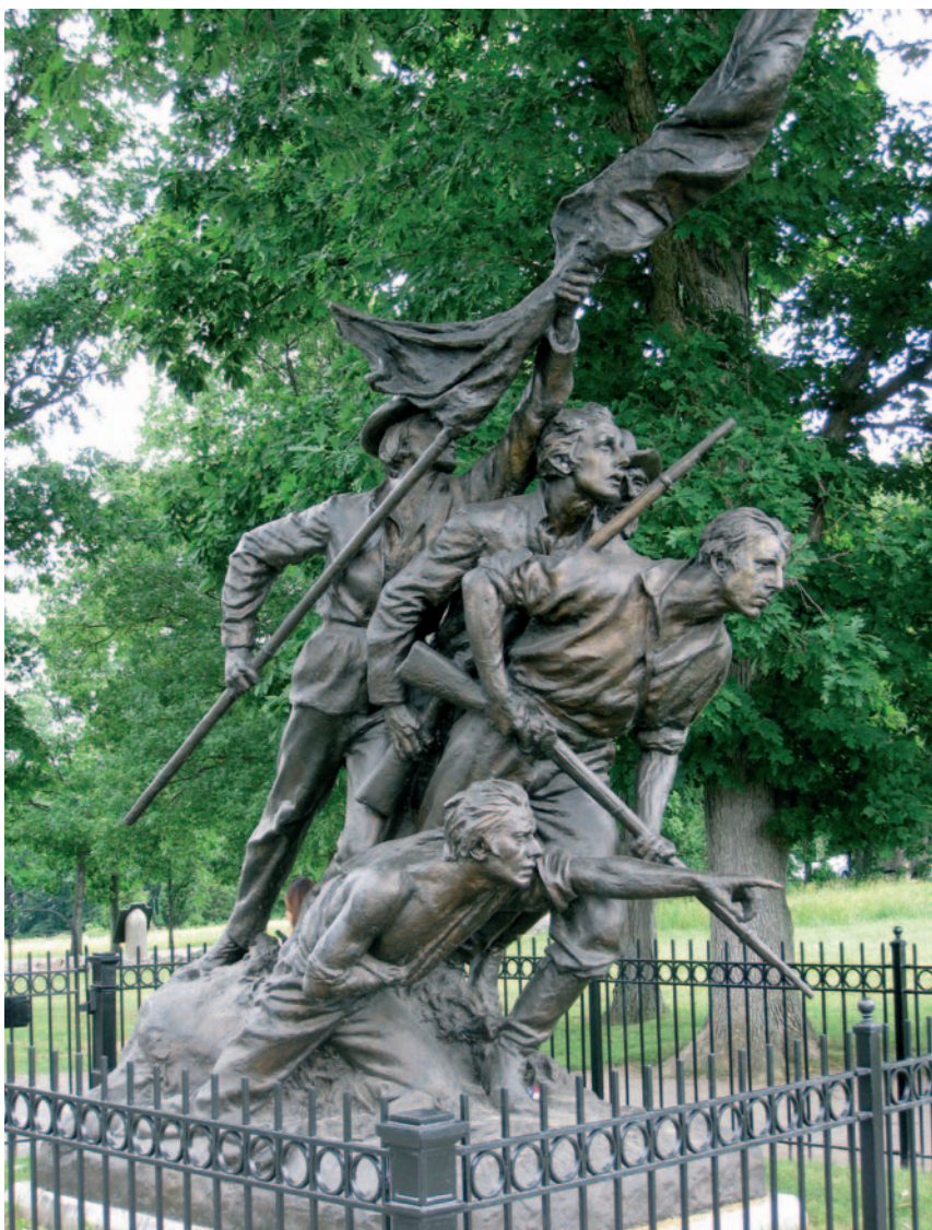
Het North Carolina Monument uit 1929. Een gewonde Zuidelijke officier wijst zijn mannen voorwaarts.

na niet bij het museum in het bezoekerscentrum. Zit u ruim in de tijd, dan is het grappig om het American Civil War Museum te bekijken. Met 35 dioramas en 300 wasen beelden wordt het verhaal van de Burgeroorlog verteld. Het is nogal gedateerd (geopend in 1962) en heeft een hoog Thunderbirds-gehalte.