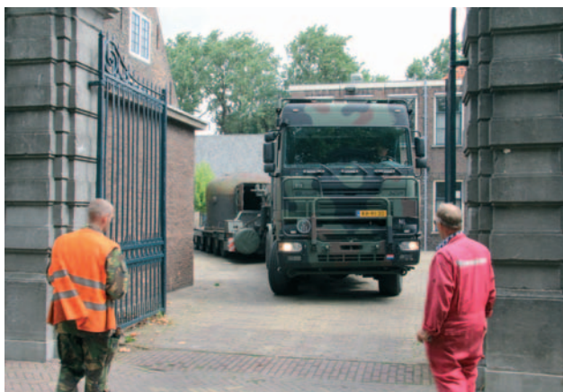
Met maar heel weinig centimeters ruimte manoeuvreert de wagen de poort van de Paardenmarkt uit.

goede vorm van recycling! Alleen enige gevulde kostuumdozen en een partij wapens moesten daarna nog enkele dagen wachten op (beveiligd) transport naar Soesterberg. Maar toen was depot Paardenmarkt na 33 jaar ook definitief verleden tijd.