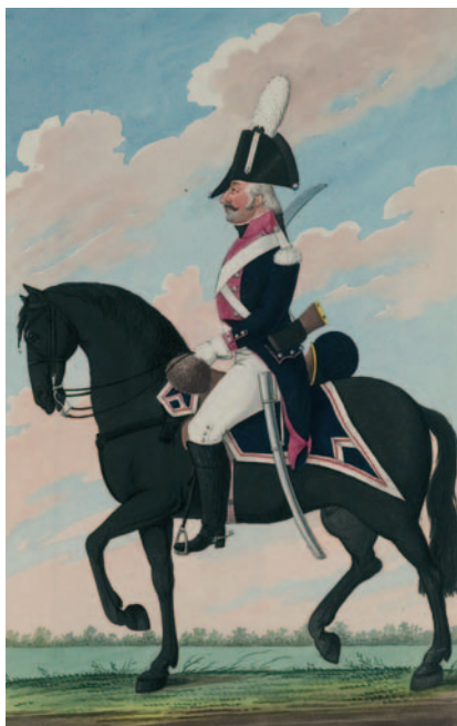
Dragoner Bataafse Republiek, 1802. Tekening in kleuren J.J. Genaert, in: Bijzondere kledinge der Bataafsche Troupes , z.p. 1802. (Collectie Legermuseum)