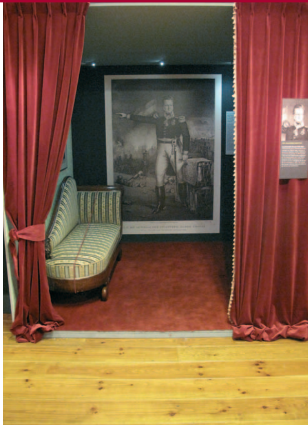
Het ensemble van generaal Chassé.