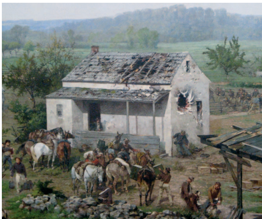
Fragment van het cyclorama. Het enorme schilderij uit 1884 verkeert sinds een paar jaar weer in perfecte staat. De renovatie duurde vijf jaar en kostte miljoenen dollars.

Aan de rand van het oude slagveld ligt het gloednieuwe bezoekerscentrum, geopend in 2008. Hier kunt u het beste uw bezoek beginnen aan Gettysburg, een stadje in het oosten van de Verenigde Staten. Start met de introductiefilm A new birth of freedom . Deze verduidelijkt de oorzaken van de oorlog en het verloop van de slag bij Gettysburg. Op de film volgt het onlangs gerenoveerde cyclorama. Het enorme schilderij van 360 graden toont het dramatische hoogtepunt van de veldslag, Pickett's aanval op derde dag. Door telkens met licht een deel van het schilderij te accentueren, wordt het verloop van deze beroemdste aanval uit de Burgeroorlog verteld. Daarna krijgt u nog kort de tijd om zelf het panorama te bekijken. De Fransman Paul Philippoteaux, een specialist in dit soort schilderwerk, voltooide het cyclorama in 1884.