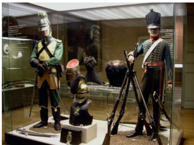
Württembergse jager te paard (links) en Badense huzaar.

Het Wehrgeschichtliches Museum bestond in 2009 75 jaar. Sinds 1956 huist het in een paleis in Rastatt (tussen Karlsruhe en Straatsburg). Het is een mooie barokresidentie uit het einde van de zeventiende eeuw. Enkele stijklkamers zijn via een rondleiding te bezichtigen, een goede combinatie met het legermuseum. De Wiedervereinigung tussen Oost- en West-Duitsland had grote gevolgen voor het museum. De Bundeswehr trok zich terug en opende in Dresden het Militärhistorisches Museum der Bundeswehr (onlangs gerenoveerd). Rastatt werd een GmbH (bv) van de deelstaat Baden-Württemberg, de stad Rastatt en de vrienden van het museum.