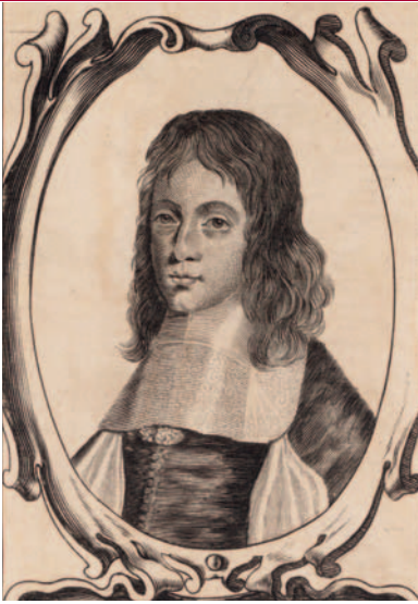
Stadhouder Willem III wist stand te houden achter de Hollandse waterlinie.

Rijn over en dreigden Willem III met zijn Staatse troepen langs de IJssel in de rug aan te vallen. Met slechts 9.000 man trok de prins in westelijke richting terug naar de in aanleg zijnde Hollandse waterlinie. Paniek brak uit, het land leek onverdedigbaar! De Staatse onderhandelaars waren bereid tot grote concessies aan de Fransen. Koning Lodewijk XIV verwachtte een spoedige capitulatie.