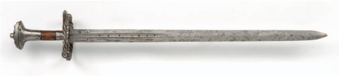
Landsknechtzwaard, zogenaamde katzbalger, 1520-ca. 1550. (Objectnummer 013212)

waaronder enkele middeleeuwse stukken en een grote deelcollectie stokwapens. De tweede belangrijke verzameling is die van de Antwerpse advocaat en wapenverzamelaar Georges de Bruyne. Deze als 'wereldberoemd' aangeduide collectie is met afstand de belangrijkste aankoop uit de geschiedenis van het Legermuseum. De collectie-De Bruyne omvatte vooral een verzameling blanke wapens, waaronder een zeldzaam landsknechtzwaard.