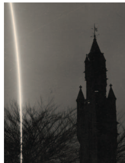
Opstijgende V2 met op de voorgrond de toren van het Haagse Vredespaleis.

Wim Berssenbrugge liet thuis nooit veel los over zijn (spionage)activiteiten tijdens de Tweede Wereldoorlog, vertelde zijn weduwe, die uiteraard 26 april ook aanwezig was. Ze wist eigenlijk alleen dat hij foto's van documenten verkleinde