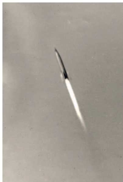
Een V2 wordt gelanceerd.