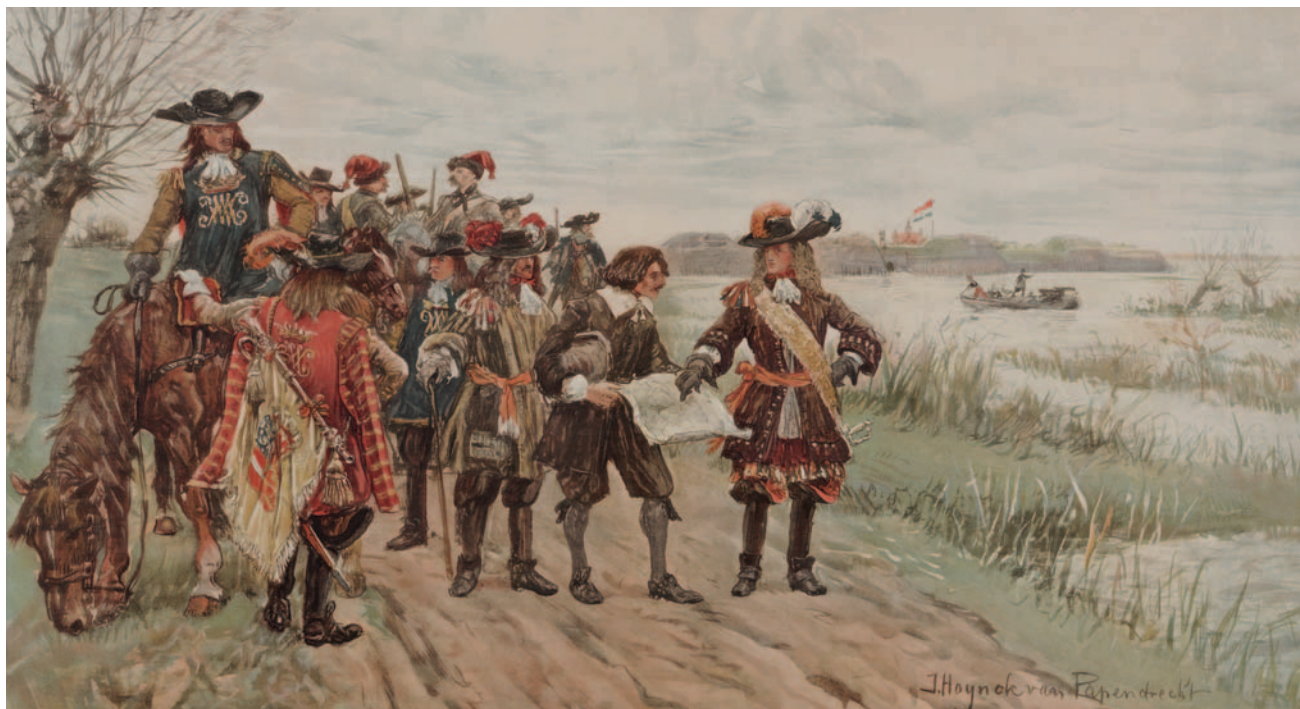
De Hollandse waterlinie, 1672. Schoolplaat naar Jan Hoynek van Papendrecht. (Collectie Legermuseum)

Aangevallen volkeren profiteerden bij hun verdediging vaak van voor hen gunstige natuurlijke omstandigheden. Nederland kon door zijn lage ligging grote gebieden onder water zetten. 'Inundatiegebieden', soms samen met aanwezige meren, rivieren en vaarten, vormden meermalen waterlinies waarmee vijandelijke troepen tegengehouden werden.