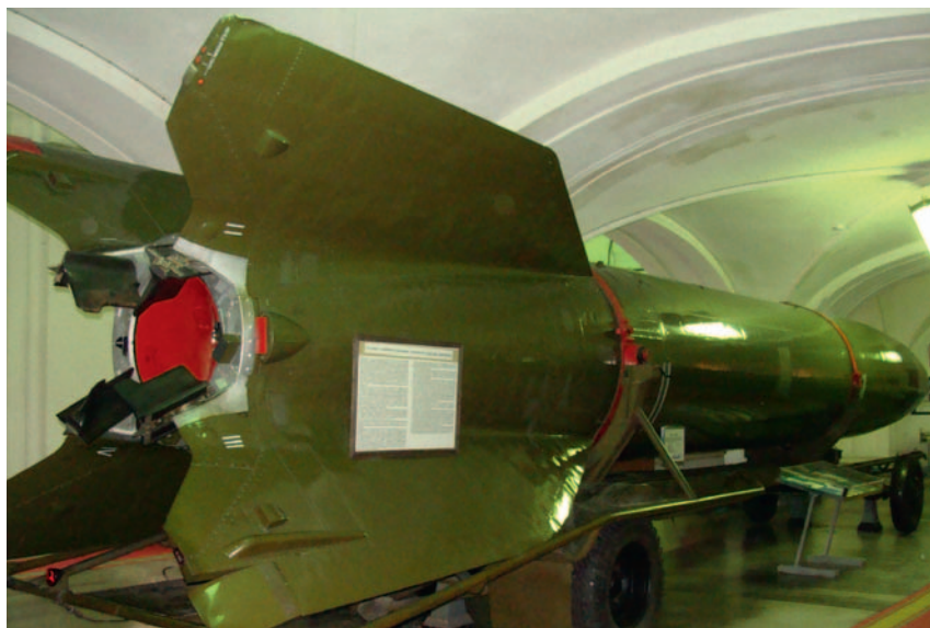
De Russische kopie van de V2 was de R1. Dit exemplaar bevindt zich in het Artilleriemuseum in St. Petersburg.

De V2 werd tijdens de oorlog ontwikkeld onder leiding van Wernher von Braun. Deze wetenschapper werkte na de oorlog in Amerika verder aan het verbeteren van ruimtevaatraketten. Als brandstof voor de hoofdmotor van de V2, die zo'n 4.500 kg woog, fungeerden methylnalcohol en vloeibare zuurstof. De lancering gebeurde in