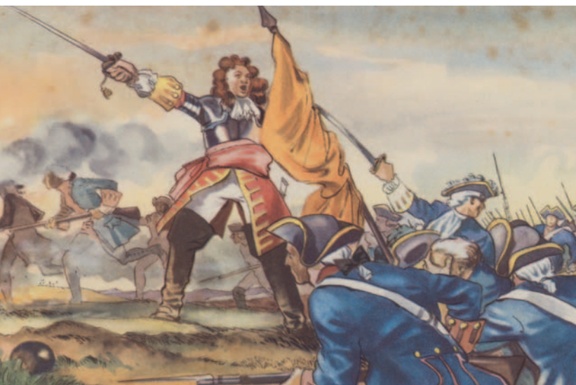
Johan Willem Friso leidt persoonlijk de aanval op de Franse linies bij Malplaquet. Prentbriefkaart 1940-1960.

Het conflict mondt vervolgens uit in een langdurige oorlog met veel belegeringen, gemanoeuvreren en enkele grote veldslagen. Een veldtocht in die tijd start pas tegen de zomer als er genoeg gras is voor de paarden, de wegen in goede staat zijn en ook voldoende tijd is geweest om voorraden in te slaan en de troepen te verzamelen. Terwijl er weinig nieuws is van het front bij Luik, behalen de Fransen en hun bondgenoot Beieren in het tweede jaar van de oorlog grote successen in Zuid-Duitsland. Daarom verenigt Marlborough