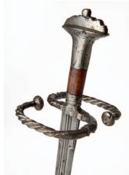
Detail van het landsknechtzwaard.

Tot slot, nog niet zo lang geleden heeft de wapencollectie van het Legermuseum opnieuw een belangrijke uitbreiding ondergaan met de verwerving van de beroemde verzameling van Henk Visser.