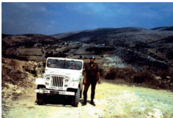
De NEKAF-jeep in Libanon.