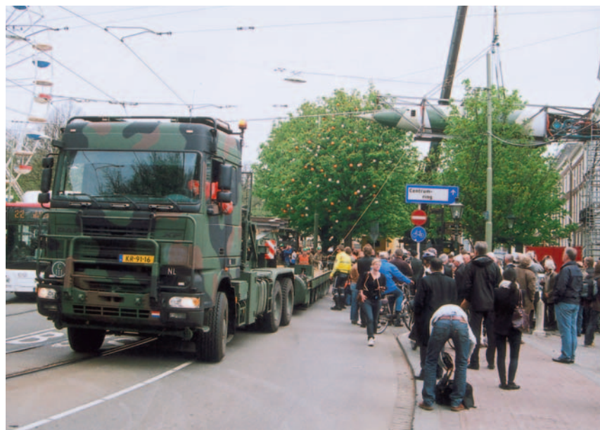
De V2 is opgetakeld tot raamhoogte van het Haags Museum; de dieplader rijdt weg.