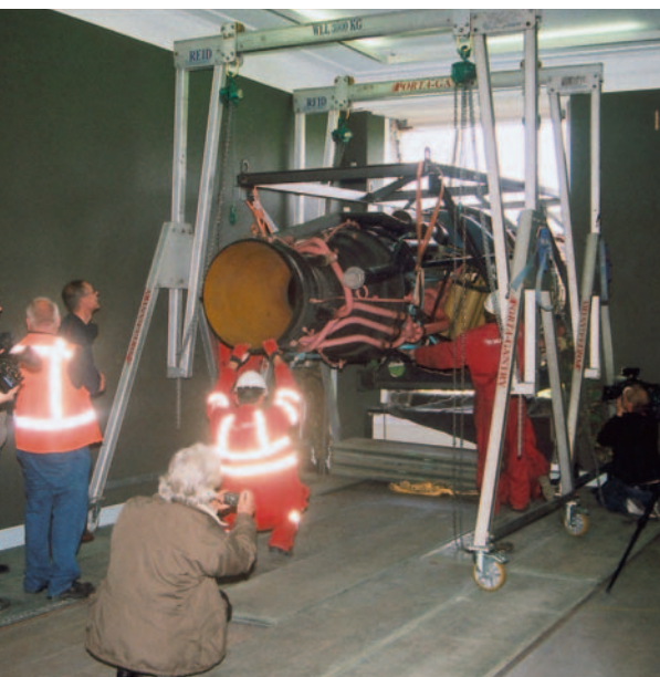
De speling bij het binnenhalen is in totaal zeven centimeter.