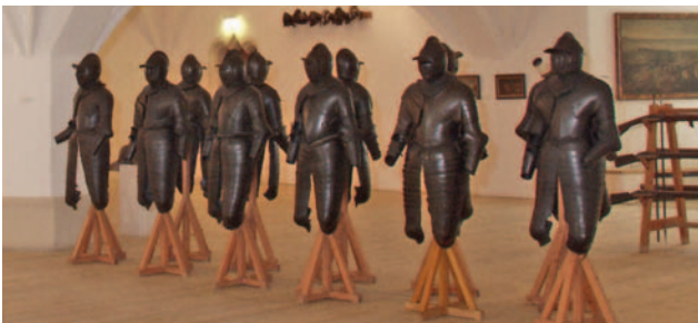
Pappenheimers. Het beroemde regiment van graaf Gottfried Heinrich zu Pappenheim droeg in de Dertigjarige Oorlog zwarte ruitersharnassen om het psychologische effect. Maar het was ook praktisch, de verf bleek een goede bescherming tegen roest.

In het kasteel begint de expositie met het vijftiende-eeuwse Beieren. Getoond wordt onder meer de ontwikkeling van de persoonlijke protectie, van maliënkolder tot plaatstalen harnas. Ook de wapens waartegen bescherming werd gezocht, zijn te zien. Denk vooral aan de kruisboog. Dat bescherming ook niet alles was, toont de prothese van een linkerhand. In de zestiende eeuw verdween het hele lichaam onder plaatstaal. Een voorbeeld is een Neurenbergs Riefelharnisch