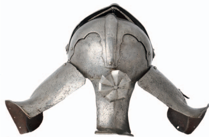
Armet met blaasbalgvizier en nekschild, ca. 1505-ca. 1510. Vermoedelijk is dit de helm die op de briefkaart is waar te nemen, geplaatst op het staande harnas links. (Objectnummer 050758)

Arms and Armour of Knights and Landsknechts / Wapens van ridders en landsknechten , J.P.P. Puype en drs. H. Stevens, uitgeverij Eburon, Delft 2010.