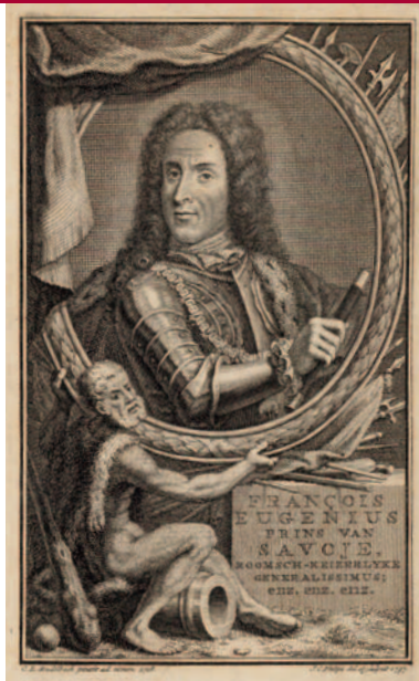
Eugenius van Savoye, aanvoerder van het leger van de Duitse keizer. Gravure uit 1737.

De Nederlandse aanval gaat deels door het bos van Lanière maar grotendeels over open terrein. Al vlug barst er een moorddadig artillerie- en musketvuur los. Bij de eerste Franse salvo's worden rijen infanteristen neergemaaid. In het eerste halfuur strijd vallen zo'n 5.000 Staatse soldaten. Toch wordt een deel van de Franse stellingen ingenomen. Maar, verzwakt door de vele verliezen, gaat de terreinwinst na een tegenaanval verloren. Persoonlijk leidt Johan Willem Friso een nieuwe aanval, maar ook die loopt op niets uit. Marlborough is de hele tijd op de rechtervleugel. Als hij van de zware verliezen hoort, haast hij zich naar de andere kant en laat een derde Staatse aanval af.