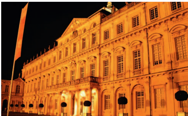
Paleis Rastatt. Markgraaf Ludwig Wilhelm von Baden (1655-1707) gaf opdracht tot de bouw. Hij is beter bekend als 'Türkenlouis' vanwege zijn successen in de oorlogen tegen de Osmanen.