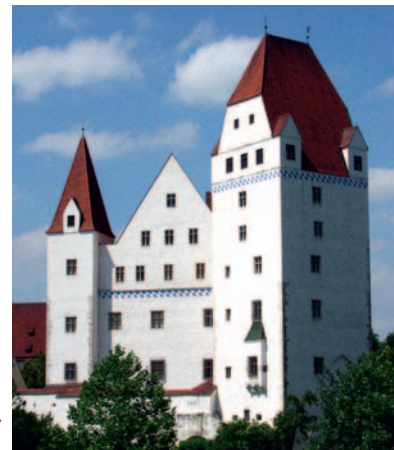
Het Neues Schloss in Ingolstadt stamt uit de vijftiende eeuw.

Voor meer informatie zie www.wgm-rastatt.de en www.bayerisches-armeemuseum.de .