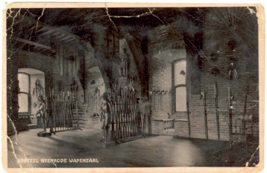
Briefkaart met de wapenzaal in kasteel Nijenrode (omstreeks 1920-1940).

De beschrijvingsteksten in het boek zijn naar analogie van deze werkwijze in beginsel opgebouwd uit twee delen. Eerst een neutrale fysieke beschrijving van het voorwerp. Daarna een deel met commen-