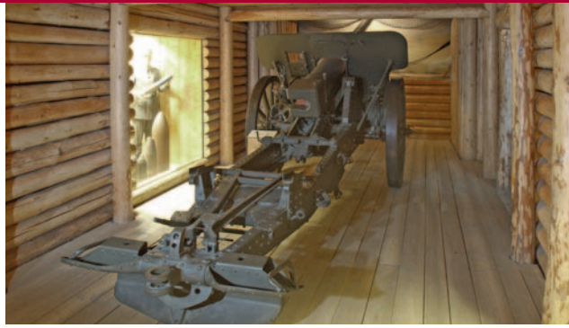
Duitse 10 cm Kanone 17 uit de Eerste Wereldoorlog.

(circa 1520). Het metaal is geplooid, dit spaarde gewicht terwijl de sterkte niet afnam. En dat was erg gevraagd in die tijd.