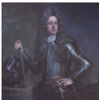
John Churchill, hertog van Marlborough en commandant van het geallieerde leger in de Spaanse Successieoorlog.

Van zijn rechtervleugel kan hij geen eenheden wegnemen, want die staat onder hevige druk. Een halfuur na de start van de geallieerde aanval rukken hier 31 Staatse bataljons op onder Johan Willem Friso, prins van Oranje. Maar zij staan tegen een overmacht van 65 Franse! Een dag eerder zou de geallieerde linkervleugel versterkt worden met 21 Britse bataljons, die nog onderweg waren. Zonder dat de Staatse commandanten daarvan op de hoogte worden gesteld, besluit Marlborough de Britten op zijn rechtervleugel in te zetten.