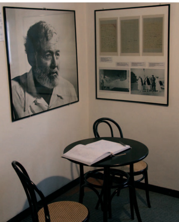
Portret van Ernest Hemingway en fotokopie van het manuscript 'A farewell to arms'.

In één week worden de Italianen teruggedrongen tot de rivier de Tagliamento, ver voorbij de stad Udine. Daar brengen Italiaanse en haastig aangevoerde geallieerde troepen de opmars tot staan. In 1918 komt ook hier een einde aan de strijd. Na de oorlog worden de expansieve dromen