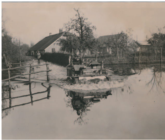
Militair test of een pantserwagen door de inundatie kan rijden.

Behalve deze voordelen brachten de ontwikkelingen ook nadelen met zich mee: de ontsluiting van Nederland door wegen, spoorwegen en kanalen. Vooral na de Eerste Wereldoorlog ging de ontwikkeling snel door de uitvoering van het Rijkswegenplan. Hierdoor ontstond een groot aantal droog blijvende accesen in de vorm van weg- en spoorwegtaluds. Op grond van de Kringenwet konden de nadelen voor de belangen van Defensie worden gecompenseerd. Veelal geschiedde dit in de vorm van de bouw van betonkazematten, die het acces afsloten. Ook hindernissen en waterstaatkundige aanpassingen en werken werden geëist. Voorbeelden hiervan zijn de bomvrijheid van de voor de inundaties belangrijke sluisen in het Noordzeekanaal en