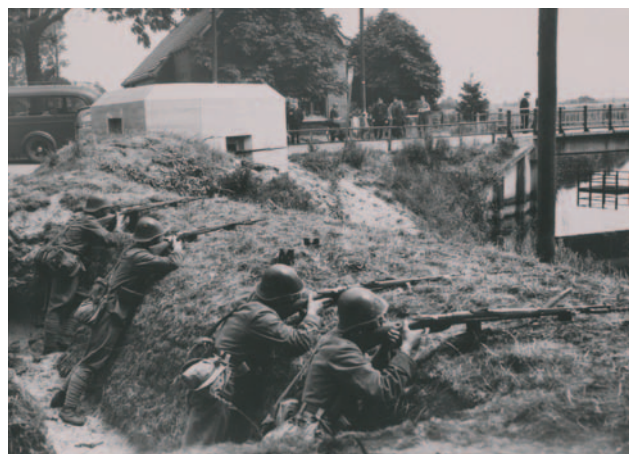
Verdediging van brug met kazemat en geweerchutters.

Voor de vorming van de Nieuwe Hollandse Waterlinie waren duizenden waterstaatkundige werken en aanpassingen nodig. Deze moesten allemaal in vredetijd worden ontworpen, gebouwd en onderhouden. De inundatie werd immers alleen in tijd van oorlog gesteld. Een uitgebreid stelsel van waterstaatkundige voorzieningen was ook noodzakelijk om een snelle