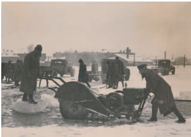
Soldaten zagen in een bevroren inundatie.

Vechten met water: hoe maak je van de vijand water je beste bondgenoot? In de negentiende eeuw kreeg een goede waterstaatkundige voorbereiding meer aandacht. Daardoor won de waterlinie enorm aan defensieve waarde.