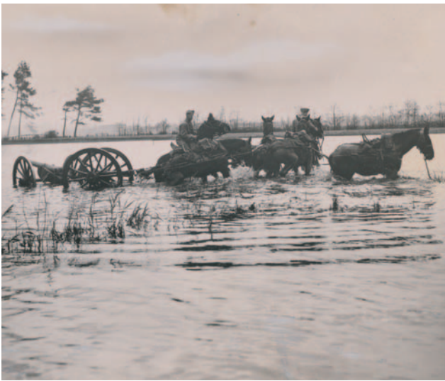
Onderzoek of geschat geïndeerd gebied kan doorwaden.

onderwaterzetting te realiseren, en wel onafhankelijk van wind en waterstand. Nu kon het Nederlandse leger dit duidelijk niet alleen. Daarom werden de waterbeheerders ingeschakeld (Rijkswaterstaat, Provinciale Waterstaat en waterschappen) en werden door Defensie speciale inundatiesluizen gebouwd. Om de forten lagen Verboden Kringen, die dienden om een vrij schootsveld te behouden. De Kringenwet van 1853 gaf hiervoor het wettelijk kader. Op korte afstand van het fort waren alle werkzaamheden (ook grondwerkzaamheden en de aanleg van wegen) verboden en op grotere afstand waren er bouwkundige beperkingen. In geval van de Nieuwe Hollandse Waterlinie overlaptten veel Verboden Kringen elkaar of grensden ze aan elkaar. Daarmee kon het inundatiegebied, dat veelal binnen een of meer Verboden Kringen viel, effectief beheerst worden.