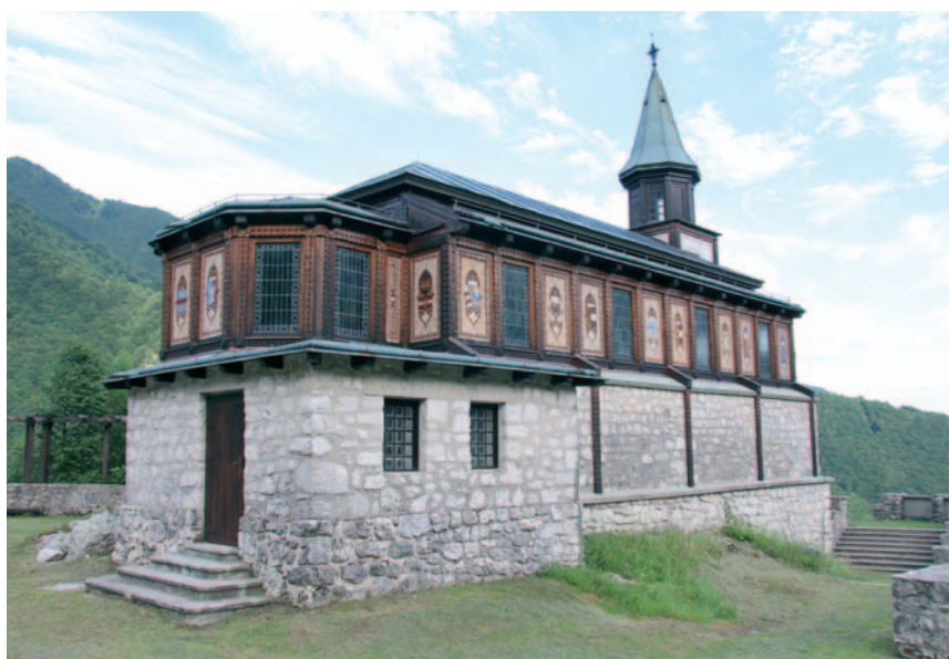
De Oostenrijkse soldatenkerk bij Javorca.

Meer naar het zuiden ligt Kobarid. Ernest Hemingways A farewell to arms speelde zich af aan de Italiaanse kant van het Isonzofront, waar hij leiding gaf aan een aantal ambulances. Zijn foto hangt in het museum van Kobarid, dat twaalf ruimten omvat, gewijd aan de Eerste Wereldoorlog. Maquettes laten het ontoegankelijke >>