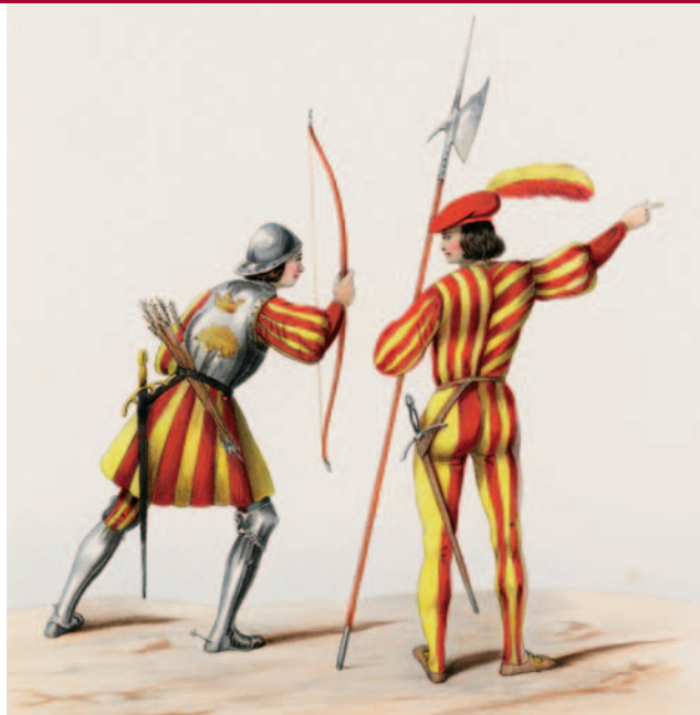
Hellebaardier van de Cent Suisses de la Garde en een Franse boogschutter in 1507.

'maul', een houten met ijzer versterkte voorhamer die inwendig nog eens met lood was verzwaard. De maul werd gebruikt om wapenrustingen kapot te slaan. Door de zo ontstane spleten kon vervolgens de tegenstander uitgeschakeld worden.