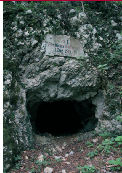
Oostenrijkse geschutspositie van 'Batterie 15' (met inscriptie) in het openluchtmuseum op de berg Mengore bij Tolmin.

van Rome niet bewaarheid. Weliswaar komt Zuid-Tirol (Alto Adige) bij Italië en wordt Triëst een Italiaanse haven, maar tot hun frustratie blijft het daarbij.