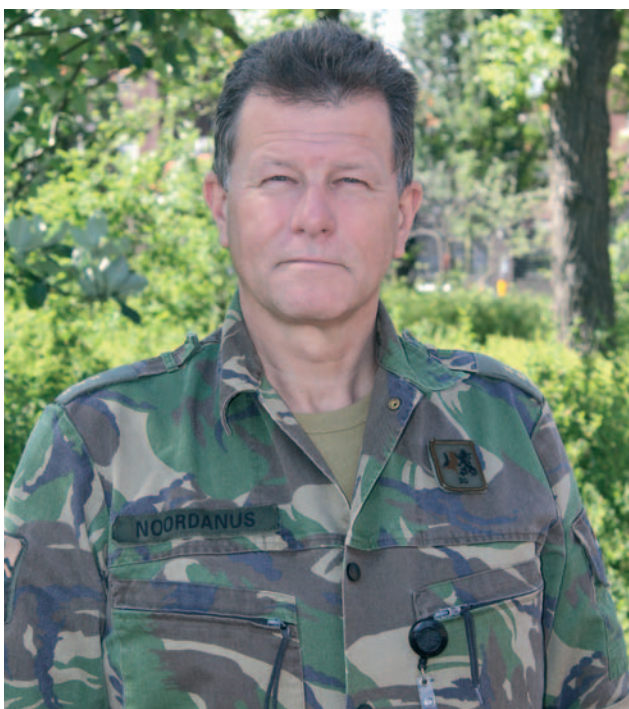
Kapitein Noordanus anno 2010 op het terrein van de Alexanderkazerne in Den Haag.

In 1952 ontwierp Willys Overland – onderdeel van de Nederlandse Kaiser-Frazer Fabrieken NV (NEKAF) – de jeep 'M38A1'. Het was een nazaat van de legendarische jeep uit de Tweede Wereldoorlog. Het bedrijf kreeg de order er 4.000 te bouwen voor onze landmacht, kosten 12.670 gulden per stuk. De jeep werd in het dagelijks gebruik NEKAF genoemd naar de fabrikant. Op 28 mei 1955 liep de eerste van de band. Het zouden er uiteindelijk 5.676 worden. Na drie jaar nam Kemper & Van Twist in Dordrecht het over en bouwde er nog zo'n 2.000. In totaal reden er 7.500! In diverse vormen: voor algemene dienst, als ambulance met brancard, als jeep met een 106 mm terugstootloos kanon, als verkenningswagen met radioapparatuur en als brandweerjeep.