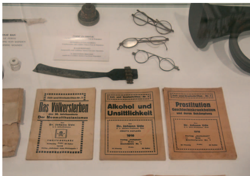
Vitrine met gezondheidsvoorlichting in het Kobaridmuseum.