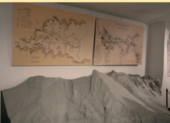
Maquette van het Isonzo-bergland in het Kobaridmuseum.

berggebied zien, er zijn zalen met objecten en foto's die te maken hebben met de strijd in de bergen, met name tijdens de barre winters met sneeuw en ijs. In een andere ruimte staan vitrines met voorwerpen en documentatie over de medische verzorging. Weer een andere toont diverse wapens en munitie. Een volgende is gewijd aan het Oostenrijks-Duitse offensief van oktober 1917 enzovoort. Instructief is ook het nagebouwde soldatenverblijf. Ten slotte heeft het museum een goed gesorteerde winkel.