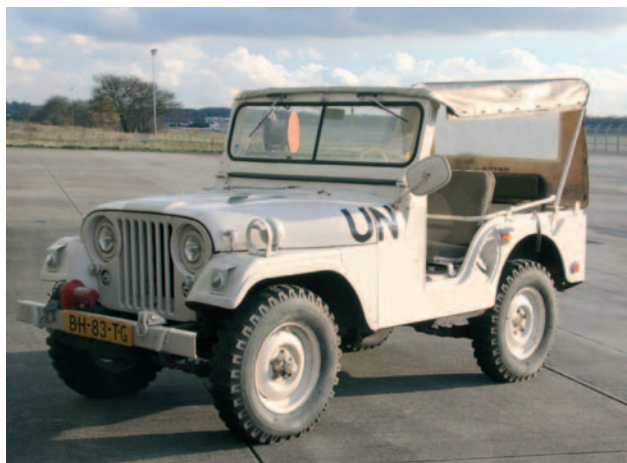
Met steun van de Vrienden nieuw in de collectie van het Legermuseum: een NEKAF van de Unifilmisatie.

De NEKAF heeft vierwielaandrijving. De viercilinder benzine-motor met vloeistofkoeling en een vermogen van 72 pk geeft het voertuig op de weg een maximumsnelheid van 88 km/u. Zijn klimvermogen is 69 procent en zonder een speciale uitrusting kan hij door 75 cm water rijden (met speciale voorzieningen zelfs door 190 cm!). De voorruit kan worden neergeklapt, zodat hij een laag silhouet heeft en naar voren vuren mogelijk is. Het reservewiel zit aan de achterkant en de jeep is voorzien van beugels en ruimten om allerlei uitrusting mee te nemen. De NEKAF is geschikt voor verkenningen, het onderhouden van verbindingen tussen commandoposten en het verrichten van bijzondere opdrachten. Dat hij onder zware omstandigheden blijft functioneren, bewees hij onder meer in Libanon! Medio jaren zestig werd de NEKAF bij de parate Nederlandse onderdelen vervangen door de DKW-Munga. De opvolger bleek geen succes en de NEKAF's werden teruggehaald uit de MOB-complexen, waar ze waren opgeborgen. Toen de Landrover eind 1970 kwam, eindigde voor veel NEKAF's ook hun tweede leven. Maar bij sommige Natres-eenheden overleefden ze en verrichtten ook nog uitstekende diensten tijdens onze missie in Libanon in 1983. Pas in 2000 werden de laatste NEKAF's – na 45 jaar dienst – via domeinen afgestoten om te veranderen in gekoesterde collector's items.