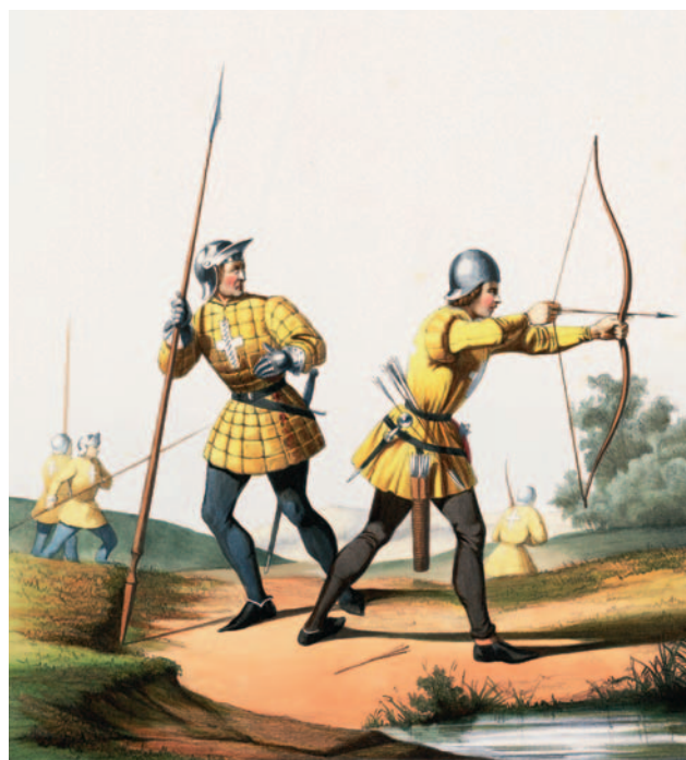
Franse boogschutter en piekenier omstreeks 1470. (Collectie Legermuseum)

Een pijlpunt voor de jacht, met aan beide zijden verlengde snijkanten die ook als weerhaken dienst doen. (Foto: Jacques Bonewit)