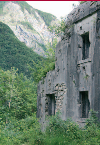
Het tot puin geschoten Fort Hermann.