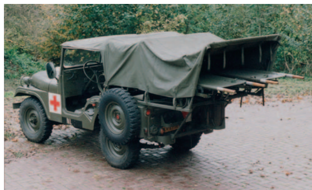
De ambulanceversie van de NEKAF.