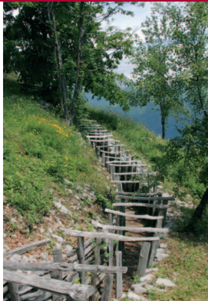
Gerestaureerde Italiaanse loopgraaf in het openluchtmuseum op de bergrug Kolovrat ten zuiden van Kobarid.