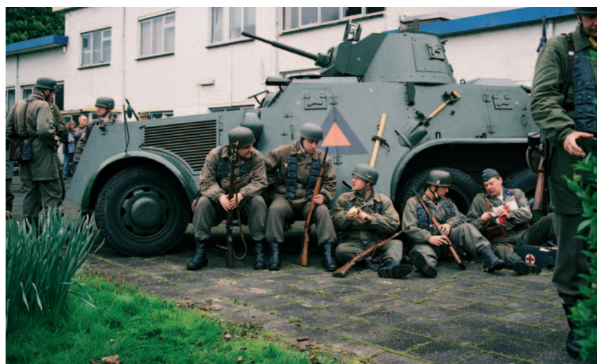
Een Nederlandse pantserwagen geleend van het Cavaleriemuseum, bij het naspelen van de Duitse landing op Ypenburg, 9 mei 2010. De Duitse para's kregen dit jaar een even warm maar veel vriendelijker welkom dan in 1940.

Na zijn vertrek uit het Vriendenbestuur gaat hij niet stilzitten: “Ik blijf het Cavaleriemuseum helpen bij het organiseren van tentoonstellingen en schrijven van publicaties. Dat doe ik tot ik omval.”