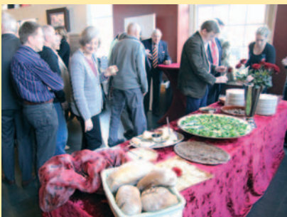
Ongeveer 100 Vrienden gaven acte de présence. Zij konden genieten van een uitstekende middeleeuwse lunch.

Op de Vriendendag van 20 november was er allereerst aandacht voor het afscheid van vicevoorzitter Jo Thomas. Het bestuur huldigde hem met een ets, direc-