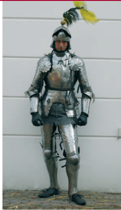
De ridder met zijn peperdure uitrusting. Geen overbodige luxe trouwens.

ken. Een harnas moest de heren beschermen. Dit was de goedkoopste vorm van de toernooisport (maar goedkoop is hier relatief). Kunde met de strijdhamer stond echter wel in hoog aanzien. Er bestaat nog een Frans manuscript uit de vijftiende eeuw dat voorschrijft hoe een ridder dient te vechten tijdens een toernooi in harnas en met de bijl of strijdhamer. Uit andere manuscripten van die periode wordt duidelijk dat de gevechten nauwelijks werden aangepast om ze veiliger te maken.