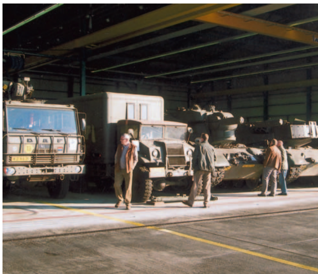
Opstelling in strijklucht.