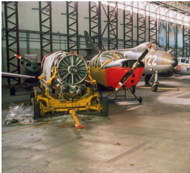
Vliegtuigen en onderdelen in het depot van het MLM.