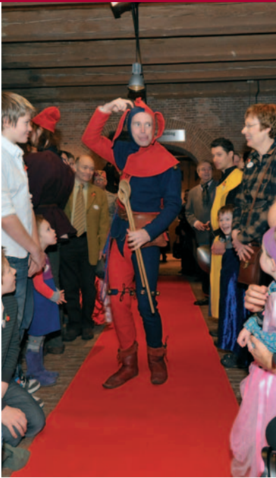
Net als vroeger ver- maakt een nar de bezoekers.