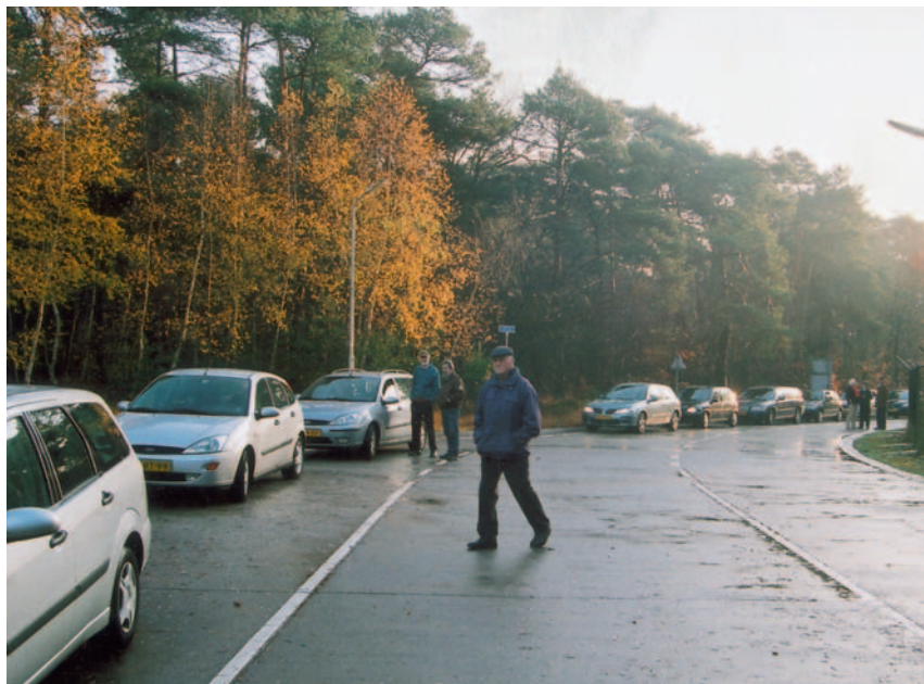
Aankomst van de bezoekers op een zonnig en nat Soesterberg.