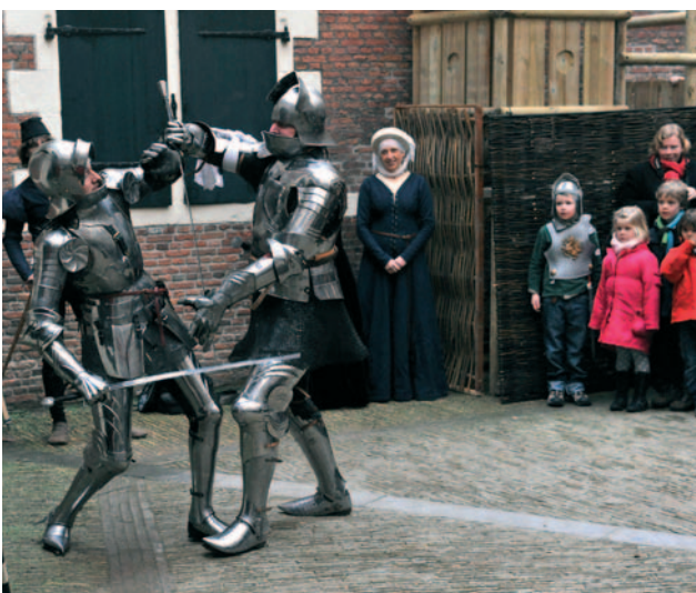
Het voetgevecht, de 'goedkopere' toernooivorm.