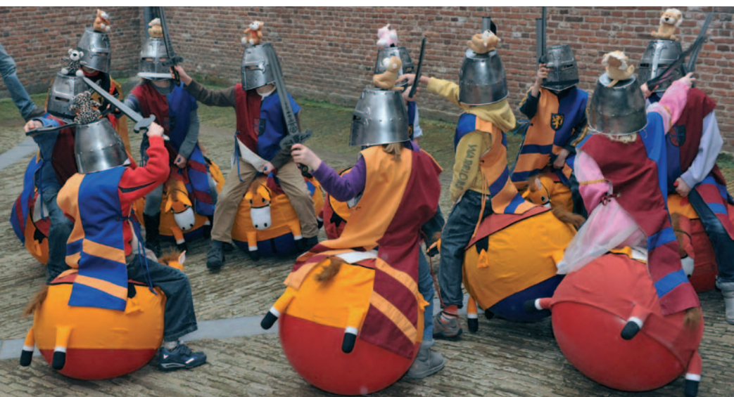
De mêlée anno 2010. Spektakel in het Legermuseum.