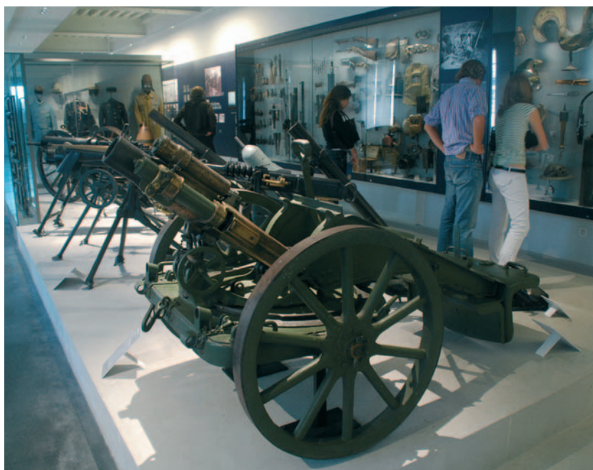
Objecten uit de Eerste Wereldoorlog in het Département des Deux Guerres Mondiales.

Tot slot is er een stukje recente Nederlandse geschiedenis te zien in de westelijke galerij op de tweede etage. Hier bevindt zich een gedenksteen met de tekst: "En souvenir des nombreux volontaires hollandais tombés pour la France au cours de la guerre. La France reconnaissante." 285 Nederlanders zouden in de Eerste Wereldoorlog gediend hebben bij de Franse krijgsmacht, van wie 215 bij het Vreemdelingenlegioen. De steen verkeert in slechte staat en overleg is gaande met de Nederlandse ambassade om hem te laten restaureren.