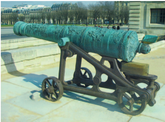
Voor de Invalides staat dit voorlaadkanon op een negentiende-eeuwse ijzeren affuit.

Het Franse Musée de l'Armée huist in het Parijse Hôtel des Invalides. Een enorm en monumentaal gebouw, gedomineerd door een 101 meter hoge gouden koepel. Kortom, een passend onderkomen voor de bijzondere collectie. Het gebouw is te danken aan Lodewijk XIV, de Zonnekoning. Hij liet het bouwen tussen 1670 en 1676 voor de veteranen van zijn vele oorlogen. Ook nu nog functioneert het als militair hospitaal en rusthuis.