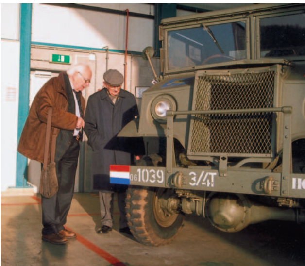
“Herinner je je dat nog?”