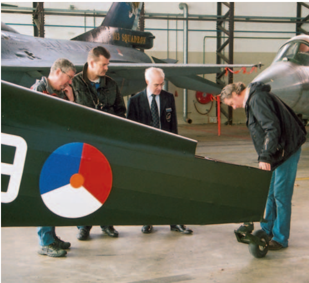
Ook interesse voor het detail.