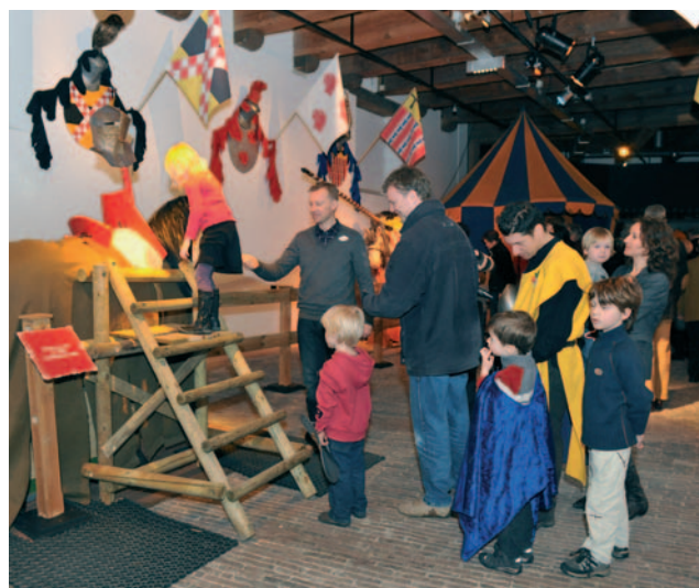
Kleine bezoekertjes kruipen in de huid van een toernooiridder.