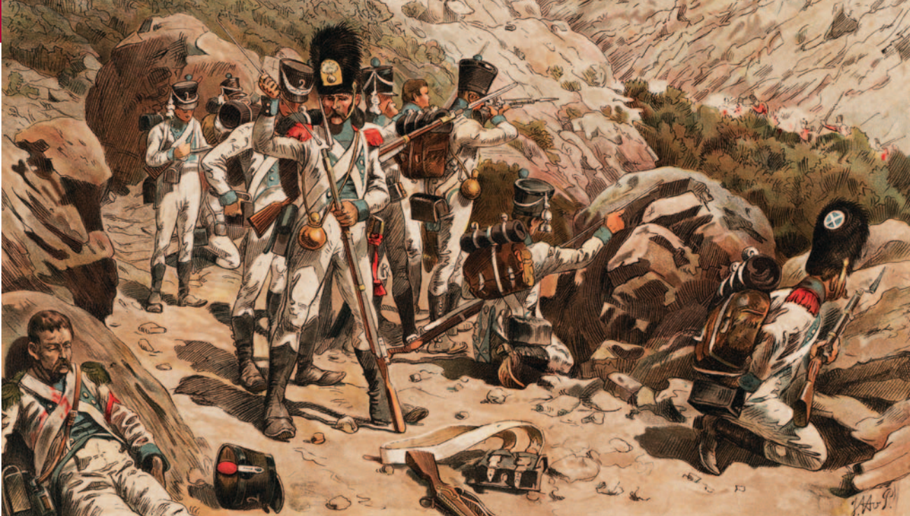
Hollandse infanterie in Spanje, door Jan Hoyneck van Papendrecht.

niet. Al snel trekken de Hollanders, nu onder maarschalk Victor, dieper het binnenland in.