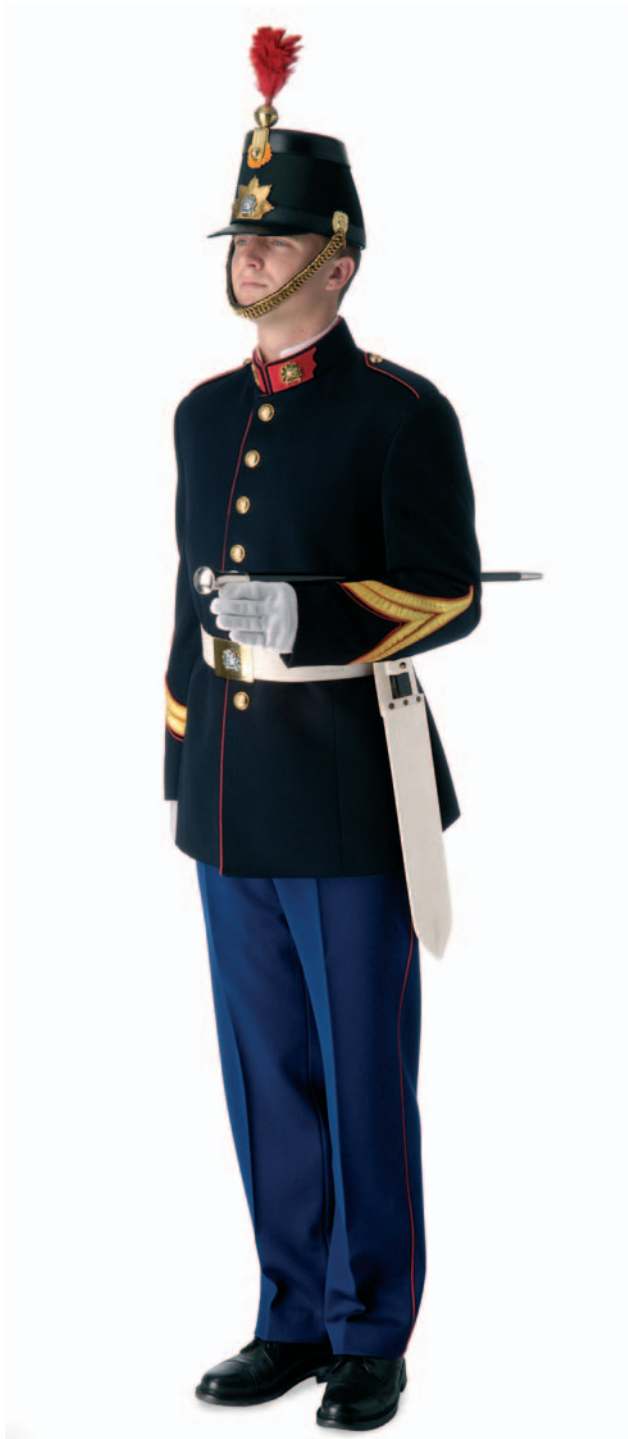
Het nieuwe ceremoniële basistenue van de landmacht.