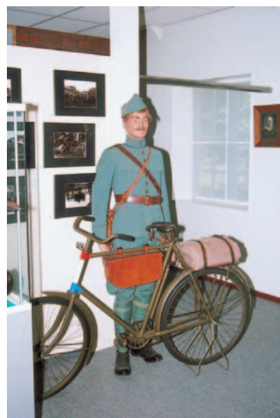
Een soldaat van het Regiment Wielrijders.

Website www.museumparkharskamp.nl of telefoon (0318) 45 44 92.