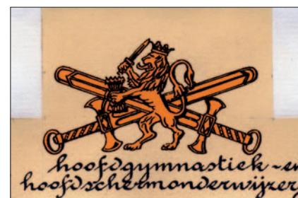
Onderscheidingstekens Landmacht uit 1940, hoofdgymnastiek- en hoofdscherm- onderwijzer (op de borst te dragen).

Generaal Hofer, de oprichter en lange tijd directeur van het Legermuseum, verzamelde dagelijks kennis over militaire geschiedenis en de collectie. Daardoor beschikt het museum over vele notitieboeken van Hofer met handgeschreven aantekeningen over militaire en aanverwante onderwerpen. In de studiezaal stonden de getypte 'Hoeferklappertjes'. Hierin zijn ook verwijzingen naar literatuur en afbeeldingen opgenomen, zoals onderscheidingstekens, technische tekeningen en sluitzegels. Deze omvangrijke kennisbron is sinds kort op de website te raadplegen. Op het collectiedeel van de website worden voortdurend nieuwe onderwerpen uitgediept. Zo is nu de beurt aan de gemotoriseerde voertuigen. De tentoonstelling Boek als wapen is er virtueel te zien. En naar aanleiding van de uitreiking van de Militaire Willemsorde is er een uitgebreid thema geplaatst. Nog dit jaar wordt een selectie van de collectie oorlogsgerelateerde films uit 1933 tot 1950 gedigitaliseerd. Het museum heeft hiervoor subsidie gekregen van het ministerie van VWS in het kader van het project 'Oorlog in blik'.