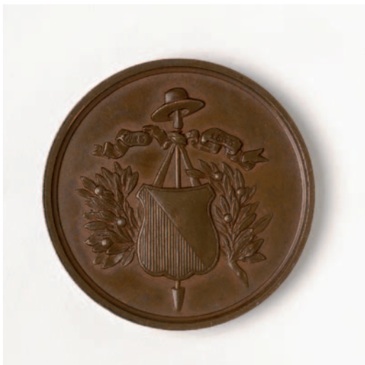
Een penning geslagen in 1863 ter gelegenheid van de herdenking van de aankomst van de kozakken te Utrecht in 1813.

De kozakken kwamen overigens niet als bezetters van Nederland, zoals de titels van voornoemde prenten misschien suggereren. Hun rol blijkt mooi uit de titel van de prent: 'Het verbranden der boeren-woningen door de Franschen, en het aanrukken der kosakken over den IJssel bij Deventer op den 16den van Slachtmaand 1813' (1814-1816). De kozakken achtervolgden de Fransen al sinds hun nederlaag in Rusland. De eveneens uit het Duits vertaalde titel Napoleons kreeftengang, of papieren door eene kosaken patrouille opgevangen (1814) spreekt wat dit betreft boekdelen. Dat de kozakken de Fransen al enkele jaren achterna zaten, blijkt uit het