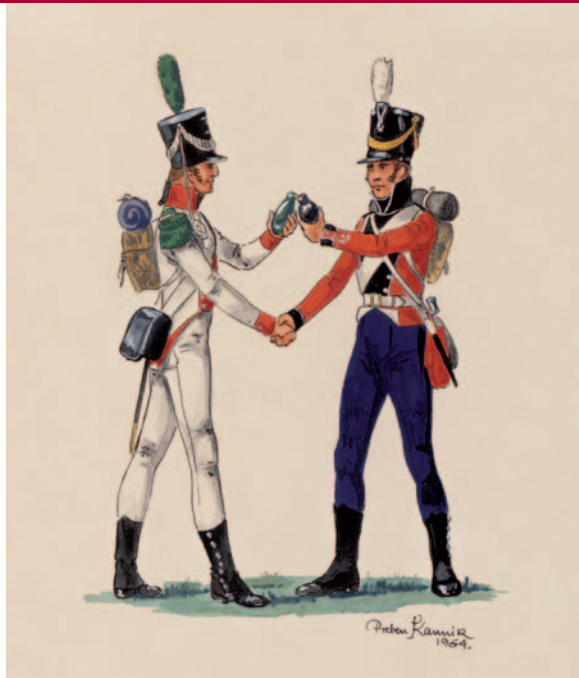
Bondgenoten. Een voltigeur van het 3e Hollandse Regiment infanterie van linie (links) en een muskietier van het Deense Regiment Oldenburg.

Lodewijk heeft een leger van 6.000 man geconcentreerd rond Bergen op Zoom. Hij mobiliseert onder andere douaniers en jachtopzieners. Ook poogt hij vrijwilligers te werven. Het Hollandse volk loopt echter niet warm. Zijn pogingen lopen op niets uit. Inmiddels wordt Vlissingen zwaar gebombardeerd vanaf zee en land. De Franse maarschalk Bernadotte neemt op 14 augustus op last van Napoleon het opperbevel van Lodewijk over. De keizer is duidelijk ontevreden met zijn broer. Een dag later valt Vlissingen. De weg naar Antwerpen ligt open. Chatham blijkt echter een weinig doortastend commandant. Ook kampt het