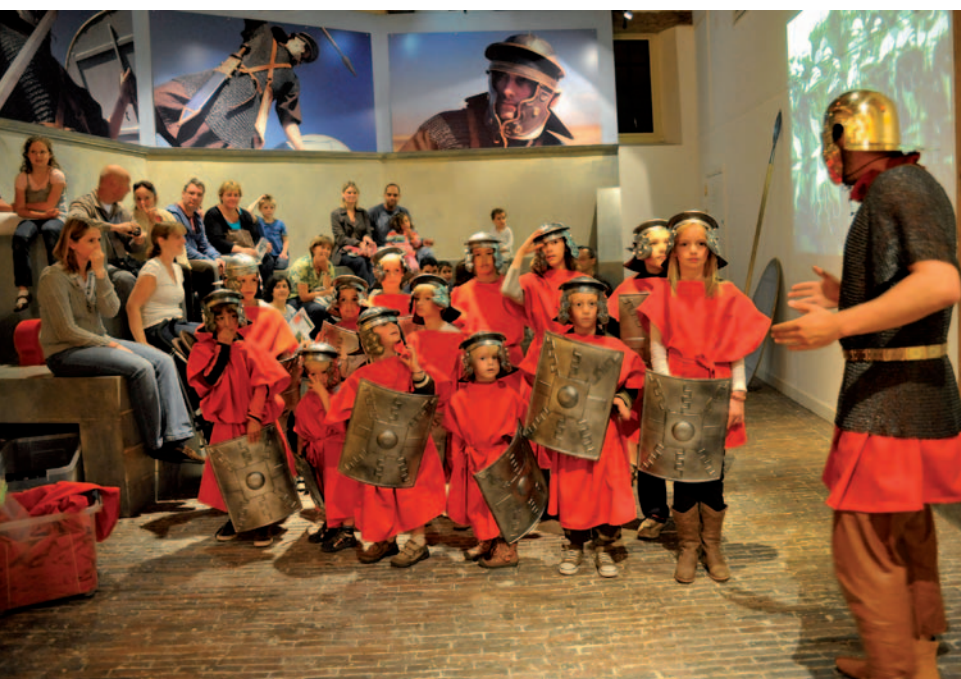
Een Romeinse onderofficier en zijn nieuwe rekruten.