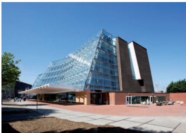
Het nieuwe gebouw van de Rijksdienst voor het Cultureel Erfgoed.