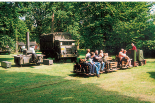
Bezoekers maken een rit met de smalspoortrein van het museum. De voertuigen behoren tot de reguliere buitenopstelling.