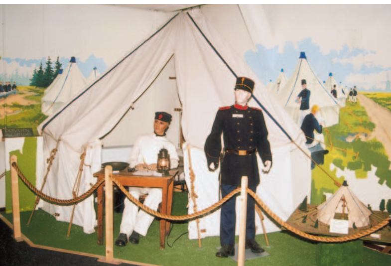
De levensgrote opstelling van het tentenkamp: het onderkomen van de militairen die de Harskamp bezochten rond 1900.