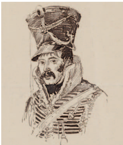
Portret van majoor Von Schill.

Von Schill maakt naam in de strijd tegen de Fransen in 1806 en 1807. Na de zware nederlaag tegen Napoleon in de dubbelslag