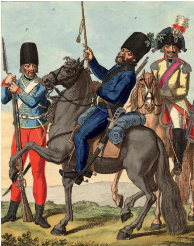
Een Russische Keizerlijke Kozak (midden). Handgekleurde kopergravure van Stöttrup. Plaat XIII in: Fr.L. von Köller, Uniformzeichnung der vorzüglichsten Europäischen Truppen (1802). (Collectie Legermuseum)

feit dat de meeste werken die in de jaren 1814-1815 in Nederland zijn verschenen uit het Duits werden vertaald. In Duitsland hadden ze al kennisgemaakt met de kozakken en dat leidde tot dezelfde verwondering met bijbehorende publicatiestroom.