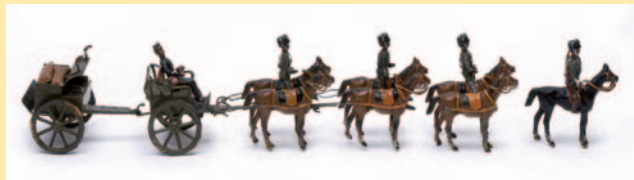
De Lichte Brigade in lood.

omdat de lopen teruggelopen waren. Weer andere werden net geladen. Verder was er een kaartentafel, een waarnemingspost en een postduivenpost. Alles klaar voor inspectie! Koningin Wilhelmina, in amazonezit te paard, droeg een bijna veldgrijze