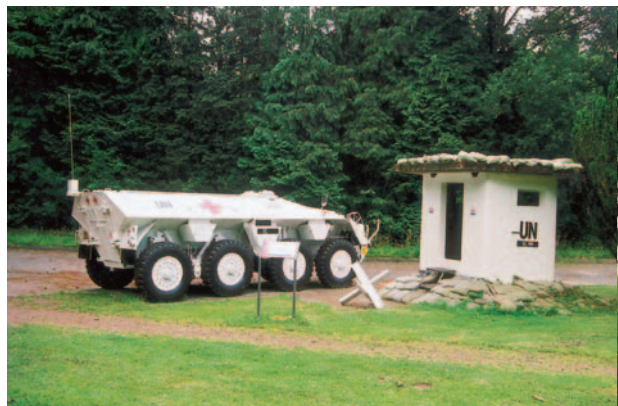
Aandacht voor de recentere missies van de krijgsmacht.

Na de Duitse inval in mei 1940 nam de Wehrmacht Harskamp over. Behalve als oefenkamp werd het gebruikt als doelgebied voor artillerieopstellingen in de omgeving. Het smalspoor verdween richting heimat. Na de bevrijding werd het kamp gebruikt om Nederlandse SS'ers gevangen te zetten.