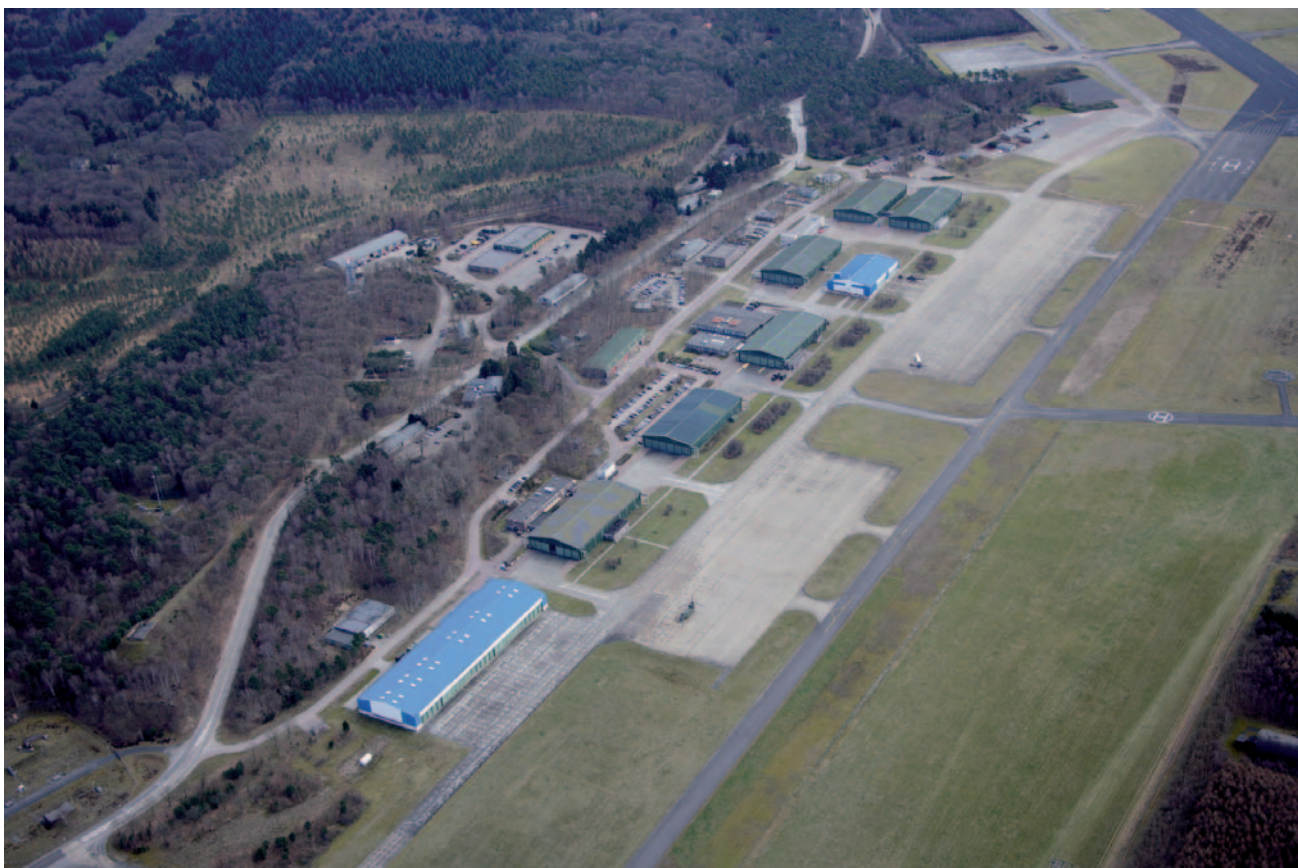
Een overzicht van het museumkwartier op Soesterberg.

Rond de eeuwwisseling heb ik een aantal jaar gewerkt bij de Rijksdienst voor de Monumentenzorg (RDMZ) in Zeist. Een van de onderwerpen waarmee ik me toen mocht bezighouden, was het voorbereiden van nieuwbouw voor deze dienst. Het prachtige monumentale pand aan het Broederplein in Zeist voldeed niet meer aan de eisen die aan een kantoor gesteld worden.