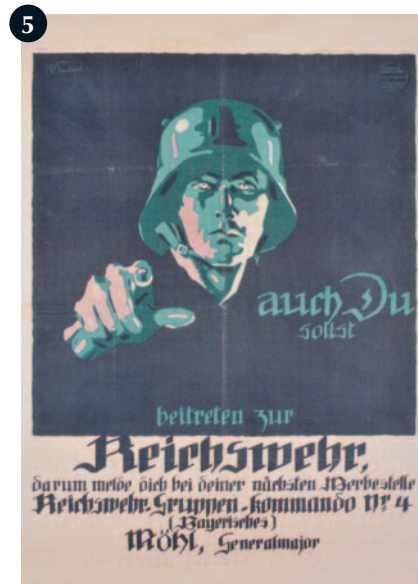
Auch Du sollst beitreten zur Reichswehr, door J.U. Engelhard, 1919.