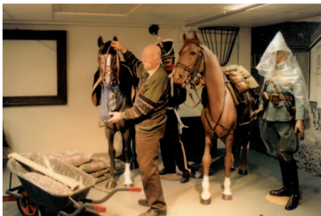
Het Cavaleriemuseum heeft veel vrijwilligers. Tijdens het vernieuwingsproject hebben zij bergen werk verzet.