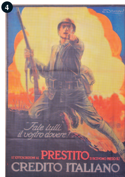
Fate tutti il vostro dovere! (Doe al uw plicht!), door L. Mauzan, 1915-1918.