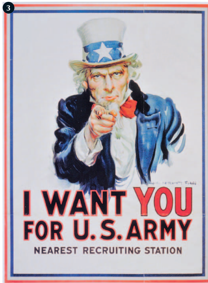
I want you for U.S. Army, door J.M. Flagg, 1917.

Of de gulle hand dat jaar verband hield met een, dankzij het affiche, succesvol verlopen forse ledenaanwas is niet te zeggen. In ieder geval doet het nog altijd trouw dienst en is inmiddels voorzien van het internetadres. Het ontwerp is van illustrator en modelleur A.R. Beerhorst (1918-2004), die van 1969/70 tot 1983 in vaste dienst was van het Legermuseum. Zowel het affiche als de oorspronkelijke olieverfversie zijn opgenomen in de collectie (1). De voorstelling is geënt op het beroemde wervingsaffiche ‘Your country needs you’, waarmee het Britse leger mannen probeerde te rekruteren. Dit dringende verzoek komt uit de mond van veldmaarschalk Lord Kitchener, een oorlogsheld, die voor het Britse volk was uitgegroeid tot symbool van de strijd tegen de Duitsers (zie cover). Het affiche, in