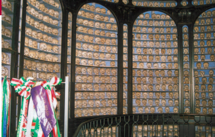
In San Martino, het noordelijke punt van het slagveld, zijn diverse monumenten waaronder een knekelhuis opgericht.

Na de nederlaag wilde Oostenrijk doorvechten. Napoleon III was geen absoluut voorstander van een eenheidsstaat Italië, hij wilde vooral de Oostenrijkse invloed terugdringen. Bovendien vreesde hij Pruisisch ingrijpen in de Rijnstreek. Hij en Franz Joseph kwamen tot een akkoord, dat bij de Vrede van Zürich in november werd bevestigd: Oostenrijk zou Lombardije aan Frankrijk afstaan, maar behield Venetië. De Italianen waren woedend, maar konden weinig anders doen dan zich schikken. Bij het verdrag van Turijn