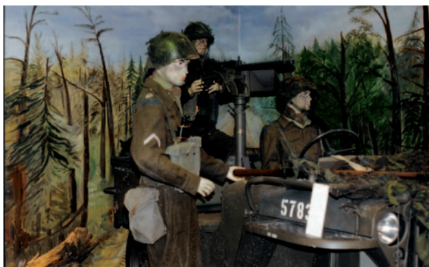
Levenschte diorama's maken deel uit van de expositie.