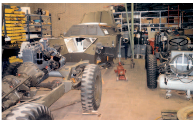
Restaureren en onderhouden van voertuigen is een van de hoofdactiviteiten van het museum.