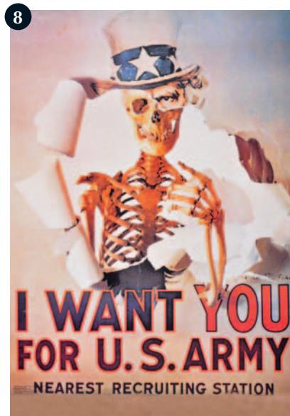
I want you for U.S. Army, onbekend, een satirische variant, na 1960.