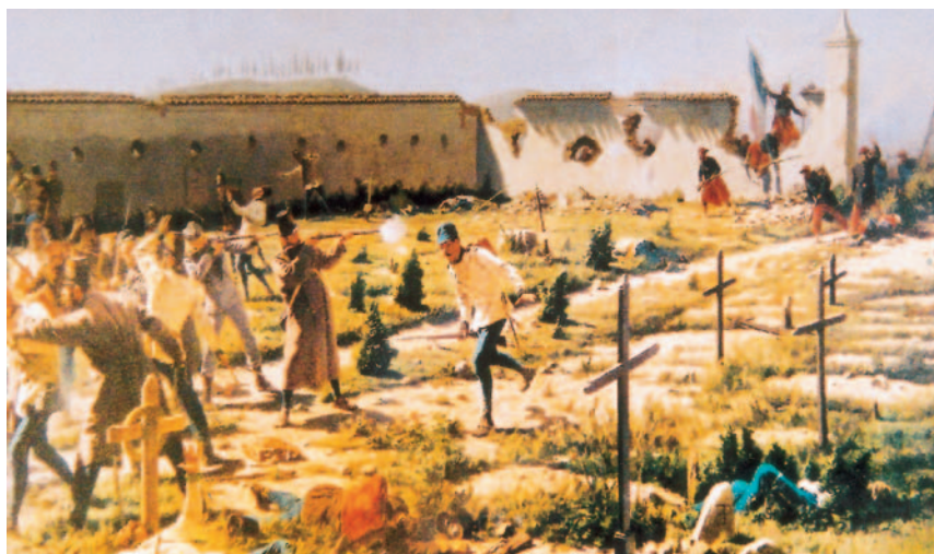
Wandschildering over de slag op een muur in Solferino, de zuidelijke begrenzing van het slagveld.

Italië was halverwege de negentiende eeuw al heel lang een versnipperd land. Sinds de middeleeuwen streden buitenlandse mogendheden als Spanje en Frankrijk er om de macht. In de achttiende eeuw bracht Oostenrijk grote delen van Noord-Italië onder zijn heerschappij. Napoleon