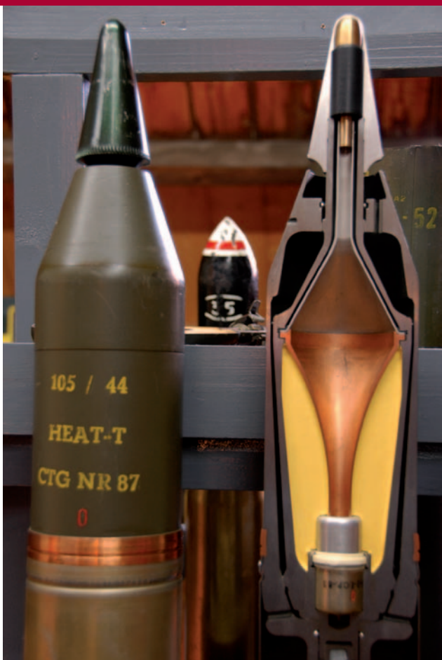
De collectie herbergt ook een aantal opengewerkte granaten waarmee de werking kan worden uitgelegd.

is het een historische verzameling die de ontwikkeling schetst van de verschillende typen munitie. Kanonskogels van steen liggen naast de meest geavanceerde artilleriegranaten. Uit de collectie blijkt dat de technische veranderingen door de tijd enorm zijn, waarbij opvalt dat er steeds meer 'denkkracht' in bepaalde munitie is komen te zitten. Ondanks de technische vooruitgang zijn er ook primitieve zelfgemaakte mijnen te zien die in het voormalige Joegoslavië zijn gevonden. Ook in deze verzameling zijn er verhalen verbonden aan de voorwerpen, zoals de antipersonneelsmijn type AP-23 die berucht werd door het ongeluk waarbij een medewerker van de landmacht in 1984 omkwam (de zaak-Ovaa-Spijkers). Met de collectie gaat een wens van Hans in vervulling. "De verzameling is nog niet af; het 'verhaal' moet nog worden gemaakt en er is nog wat beeldmateriaal nodig." Ook hoopt hij dat er verzamelaars zijn die nog wat bijzondere stukken willen afstaan.