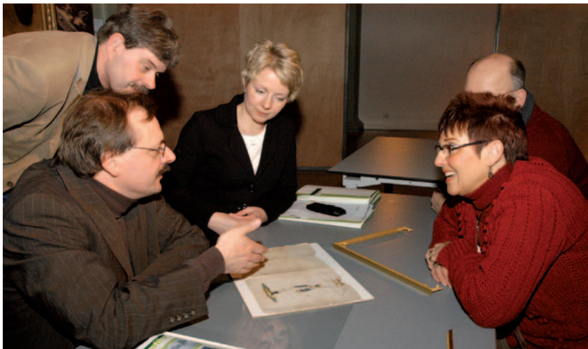
Bespreking van een voorwerp uit een privécollectie.

Napoleon, Normandië, uniformen, vuurwapens, zendontvangers, het zijn maar enkele specialismen, die Vrienden van het Legermuseum noemden bij hun aanmelding. Inmiddels is het een indrukwekkende lijst geworden. Hoe nuttig en prettig zou het niet zijn deze expertise te kunnen delen met elkaar, met andere geïnteresseerde Vrienden en met het Legermuseum zelf? Die mogelijkheid tot uitwisseling van deskundigheid wordt binnenkort geboden!