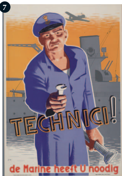
Technici! De Marine heeft U nodig, door JH (James Haworth?), 1945. (Collectie Legermuseum)

Vooral de Amerikaanse 'I want you'-versie werd en wordt nog steeds op grote schaal geplagieerd en voor allerlei doeleinden,