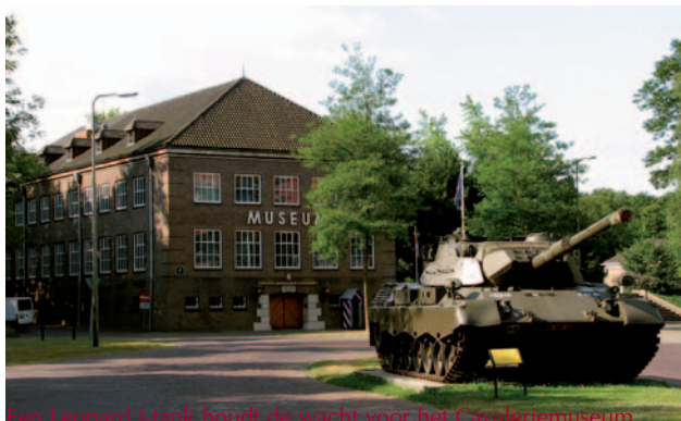
Van Leopard 1 tank bezit de wachter voor het Cavaleriemuseum