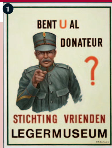
Bent U al donateur?, door A.R. Beerhorst, 1983. (Collectie Legermuseum)

van commerciële tot parodiërende en hekelende, gebruikt. Googlen op internet levert daarvan vindingrijke voorbeelden op (8).