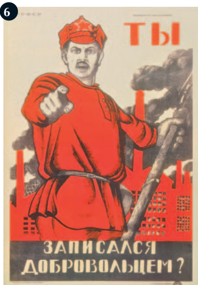
Ty zapisalsia dobrovo'tsem? (Heb jij je al opgegeven als vrijwilliger?), onbekend, 1920.

Het zich op directe en ondubbelzinnige wijze richten tot de kijker is nog steeds een inspiratiebron voor menig grafisch ontwerper. Van meet af aan kreeg het wereldwijd navolging. In 1917 kwam het Amerikaanse leger met het nog bekendere affiche 'I want you for U.S. Army', uitgesproken door Uncle Sam (de verpersoonlijking van de Verenigde Staten) (3), en het Italiaanse leger met 'Fate tutti il vostro dovere!' ('Doe al uw plicht!'), uitgesproken door een soldaat op een slagveld (4). Andere landen volgden, zoals het Duitse leger in 1919 (5) en het Russische Rode Leger in 1920 (6); beide eveneens vertegenwoordigd door een fiere soldaat. Ook de Nederlandse krijgsmacht liet zich tot een dergelijke creatie overhalen. Tot de wervingscampagne die de Koninklijke Marine kort na het einde van de Tweede Wereldoorlog voerde, behoort het affiche