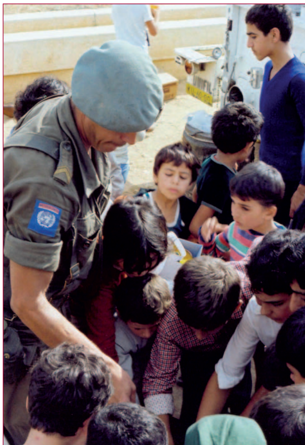
De open dag in Almansuri. De Dutchbat-sergeant heeft iets bij zich dat grote interesse wekt bij de kinderen.

was heel belangrijk, slechts één keer per week mocht er getelefoneerd worden – ondenkbaar in dit digitale tijdperk.