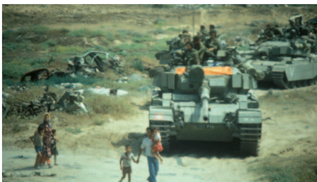
Israëliëse tanks aan het hoofd van een lange colonne legervoertuigen tijdens de inval in Zuid-Libanon.