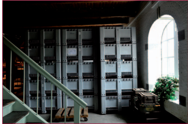
Zoals de Amerikaanse generaal Bradley ooit zei: “Amateurs talk tactics, professionals talk logistics.” Een voorraad nieuwe pallets staat te wachten om gevuld te worden.

radio's, telexen en walkietalkies vervoerd zullen worden, staan echter al gereed.