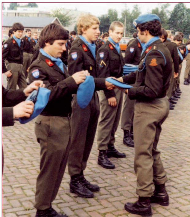
Uitreiking van de blauwe baret en het Libanonkoord na de opleiding. Deze militairen van het 4e Pantserinfanterieregiment Chassé werden in Libanon ingedeeld bij het 44e Pantserinfanterieregiment Johan Willem Friso.