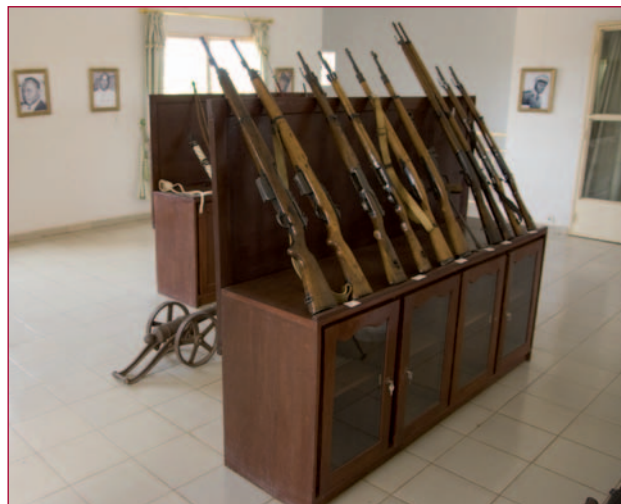
De wapenzaal van het museum.

Mali, tot 1960 een Franse kolonie, is een van de armste landen ter wereld. Het was voor mij dan ook een verrassing dat ondanks de slechte economische situatie en de armoede in het land, het Malinese ministerie van Defensie toch ruimte heeft gevonden om aandacht te besteden aan de geschiedenis van hun (jonge) krijgsmacht en aan het bewaren van hun militair-historisch erfgoed.