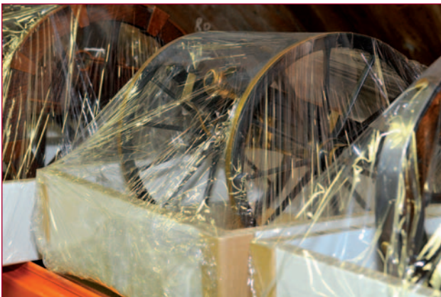
Schaalmodel van een voorlaadkanon in het schap.

Nog niet alles is gereed: zo wacht de deelcollectie Verbindingsmiddelen nog op behandeling. De kunststof pallets waarin de