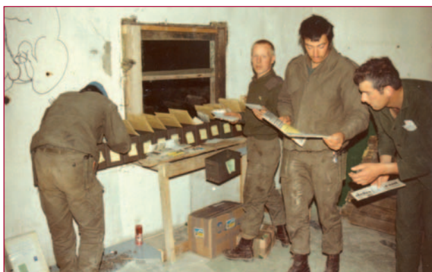
De postkamer in Haris. De post is voor Dutchbat-militairen hét lijntje naar huis. E-mail bestaat nog niet en telefoneren is moeilijk of heel duur.

Dutchbat werkte vanuit een hoofdkwartier en een groot aantal posten. Vanuit deze posten werden de taken uitgevoerd. Te voet en per voertuig voerden de Nederlanders patrouilles uit. Kennis van het gebied vergaren, contact leggen met de bevolking en signaleren van bestandsschendingen was het doel. Herinneringen aan Unifil houden dan ook vaak verband met de ‘posten’ waar de kleine groepjes blauwhelmen woonden en werkten. De posten kregen van de bewoners uniek uitgevoerde nummers 7. Dit alles komt op de tentoonstelling duidelijk uit de verf. Op het bestaan in Libanon, een land met andere (extremere) klimatologische omstandigheden, een andere cultuur en met een plaatselijke bevolking die veel armoede kende, waren de Nederlanders niet goed voorbereid. Ook vergde het leven in een kleine groep een groot aanpassingsvermogen. Veel privacy was er niet! Contact met het thuisfront in de vorm van brieven