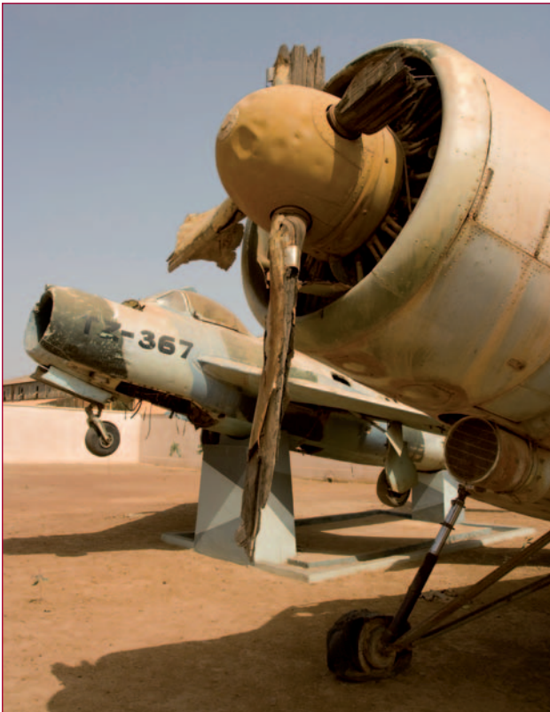
Twee militaire vliegtuigen met achteraan een oude Mig.

ker kan de wapens van dichtbij bekijken en vasthouden. Om diefstal te voorkomen, is om de beugelkrop van de wapens een (dun) kettinkje bevestigd. Ook beschikt het museum over een grote collectie kalasjnikovs, maar om deze te zien hoeft men niet direct naar het legermuseum, op de zwarte markt of in de buurlanden zijn ze nog volop voorhanden!