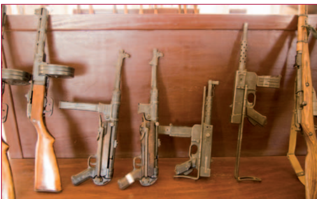
Oude handvuurwapens. V.l.n.r. tweemaal een Russische pistoolmitrailleur PPsH41, twee Duitse MP40-pistoolmitrailleurs, een koppel Franse MAT49-pistoolmitrailleurs en een Russisch geweer Mosin-Nagant. Overigens, kunnen de wapens kopiën zijn, gemaakt in een ander land dan de genoemde.

Recent heeft het museum een Renault FT-17 tank ontvangen, die in Kayes aan de grens met Senegal, als poortwachter voor een kazerne stond. Het tankje dat waarschijnlijk al minstens 60 jaar geleden buiten gebruik is gesteld, bevindt zich in zeer slechte staat en is aan de onderzijde zwaar verroest. Ook het transport