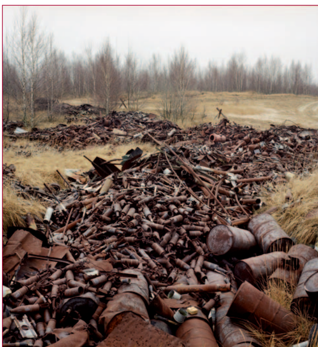
De oude DDR ligt bezaaid met sporen van de Koude Oorlog.

Het was geen schokkende periode, het ging vooral om de dagelijkse routine en het kazerneleven. Later bezocht hij Kosovo – na de burgeroorlog – om ook hier het dagelijkse soldatenleven vast te leggen: "Ik ben geen oorlogs- of frontfotograaf." Maar zonder