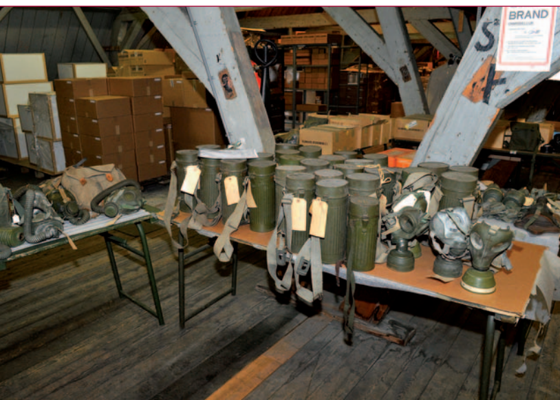
De selectie in beeld: het sorteren van de deelcollectie Gasmaskers.

Het is van groot belang de verhuizing van de collectie goed voor te bereiden. Zo kan er snel gehandeld worden op het moment dat we groen licht krijgen voor het daadwerkelijke transport. Daarom zijn behoudsmedewerkers al tijden bezig de objecten te completeren, schoon te maken, te nummeren, te fotograferen en transportgereed te verpakken. De conservatoren hebben, vaak geholpen door restauratoren en enkele externe adviseurs, aangegeven welke objecten uit de verschillende deelcollecties absoluut mee moeten verhuizen, en welke eventueel voor afstoot in aanmerking komen.