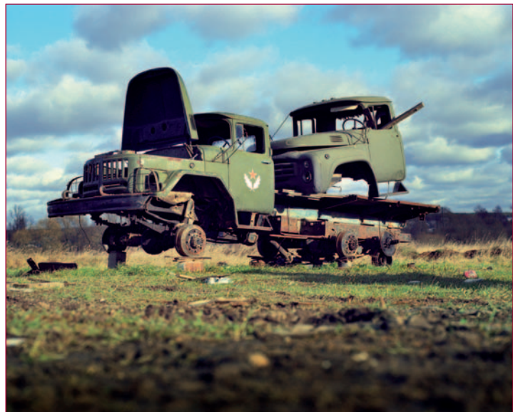
Wat er overbleef van een machtig imperium: schroot van het voormalige Sovjetleger.

gevaar was de nog gespannen situatie niet. In 2002 reisde Roemers naar Afghanistan, waar hij niet alleen militairen fotografeerde, maar ook portretten van Afghanen maakte. "Ik werkte met een heel oude camera van een plaatselijke straatfotograaf. Hij sjouwde altijd een kist met chemicaliën mee om de foto's ter plaatse te ontwikkelen. Die man gebruikte geen rolfilms, maar fotopapier dat hij tien seconden belichtte. Zo lang moesten de mensen stilstaan. Je kreeg daardoor een wat verstard beeld en