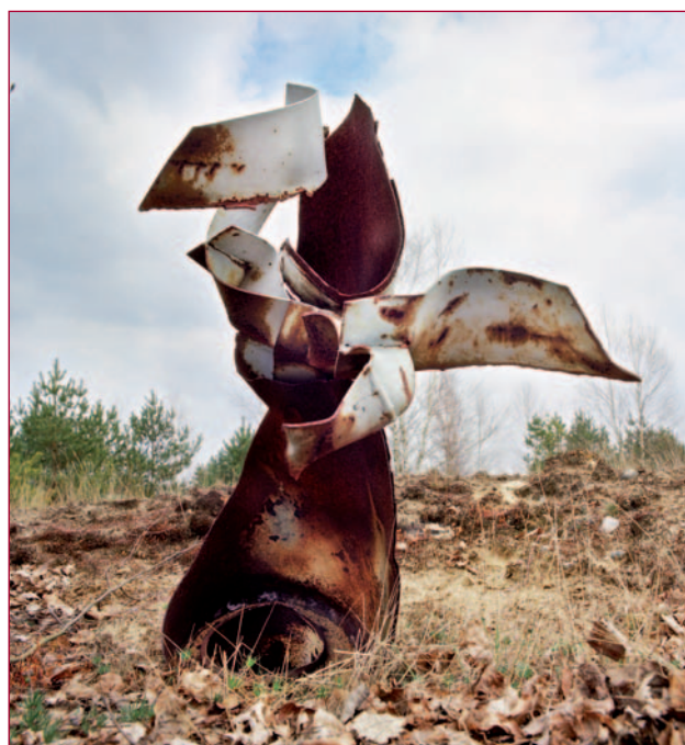
Ontplofte bom: Russisch souvenir in Duitsland.

gevaar was de nog gespannen situatie niet. In 2002 reisde Roemers naar Afghanistan, waar hij niet alleen militairen fotografeerde, maar ook portretten van Afghanen maakte. "Ik werkte met een heel oude camera van een plaatselijke straatfotograaf. Hij sjouwde altijd een kist met chemicaliën mee om de foto's ter plaatse te ontwikkelen. Die man gebruikte geen rolfilms, maar fotopapier dat hij tien seconden belichtte. Zo lang moesten de mensen stilstaan. Je kreeg daardoor een wat verstard beeld en