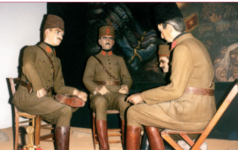
Atatürk, de Turkse 'Vader des vaderlands', in generaalsuniform.