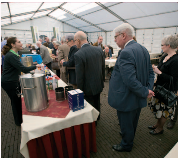
Naar goed militair gebruik: opstellen in rij voor de gamellen. Erwtensoepp, roggebrood en katenspek als lunch.