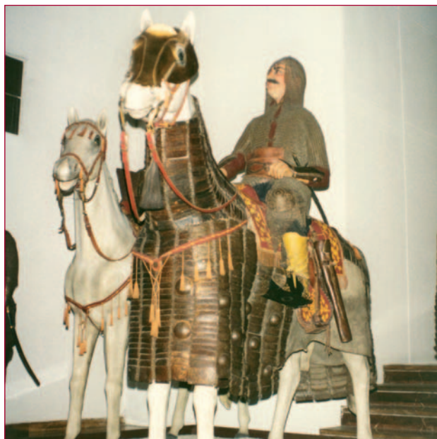
Ottomaanse ruiter uit de vijftiende eeuw.

De start van het bezoek aan het museum is de collectie Ottomaanse wapens, kledingstukken, helmen en harnassen van het eind van de middeleeuwen. Hiermee wordt de verovering van het Byzantijnse Constantinopel in 1453 door de Ottomaanse troepen in herinnering gehouden. Na een belegering van 54 dagen lukte het sultan Mehmet II (1451-1481) om de dikke muren van de stad te doorbreken. Naast de verdedigingsmuren hadden de Byzantijnen ook ter afscherming van de Gouden Hoorn (de riviermonding die het Europese deel van Istanbul in tweeën splitst) een enorme ketting gespannen. Door de aanwezigheid van de ketting moest Mehmet II zijn vloot over land