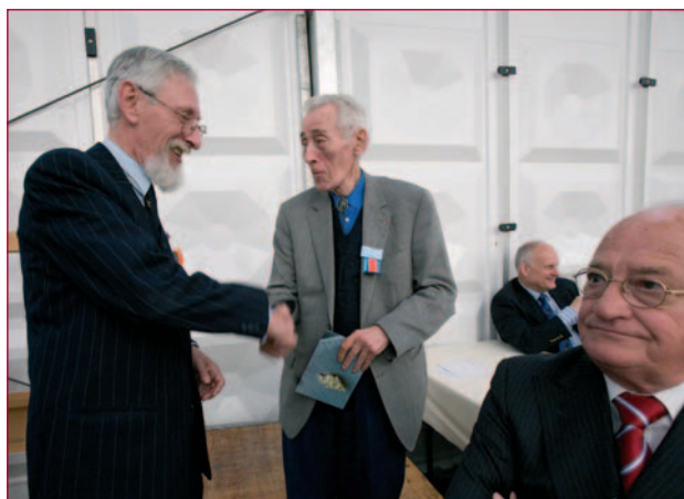
Méér dan 40 jaar Vriend. Het uitdelen van de gouden spelden.