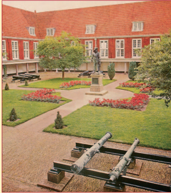
De binnenplaats van het Pesthuis in Leiden.