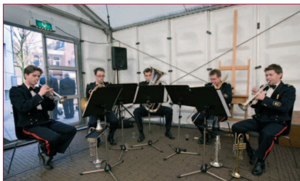
Het koperblazersensemble van de Garde Grenadiers en Jagers verzorgt de achtergrondmuziek tijdens lunch op de jubileumdag.

Hoogtepunt zou de overhandiging zijn van het geschenk 2008 van de Stichting aan het museum: een bijdrage voor de verwerving van het schilderij van Breitner 'De Blauwe Huzaar'. In de maanden voor 26 april werden de plannen steeds concreter: er kwam een tent op het museumterrein voor alle gasten, de snert-met-vla-toe was akkoord en ook het optreden van de Regimentsfanfare Garde Grenadiers en Jagers. Inmiddels groeiden de teksten voor de uitnodiging, het programma en de gekaligrafeerde kaarten bij de gouden spelden. De Grafische Dienst van Defensie in Utrecht verzorgde een smaakvol programma-boekje en aanbiedingskaarten voor de speld. Het was tot op het laatst spannend of alles op tijd klaar zou zijn, maar het lukte!