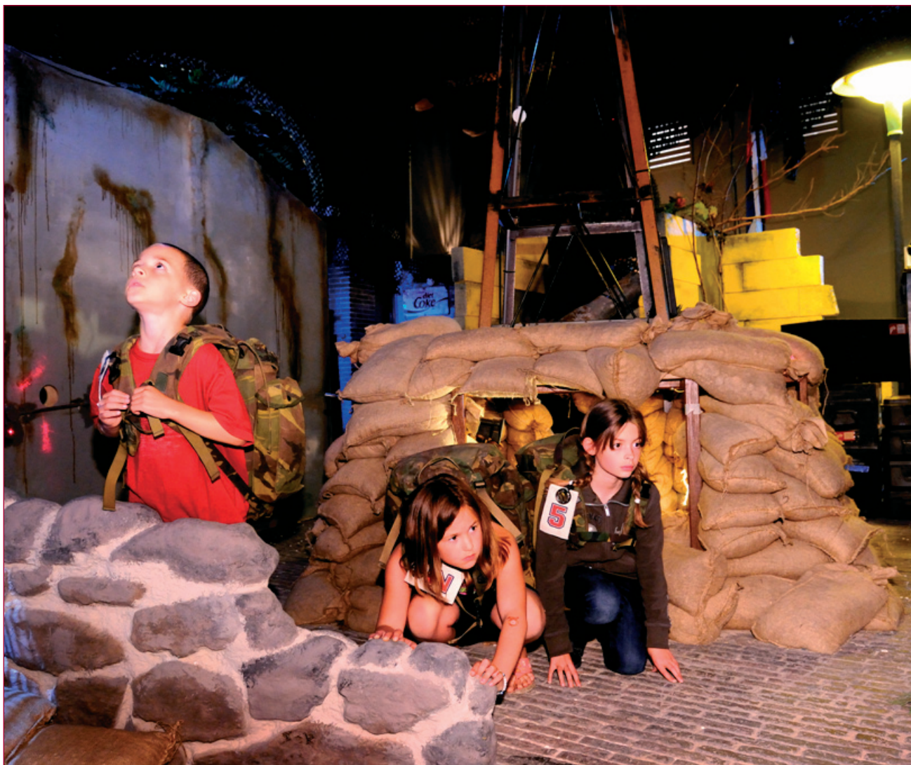
Na een intensieve opleiding krijgen de piepjonge rekruten hun eerste opdracht.