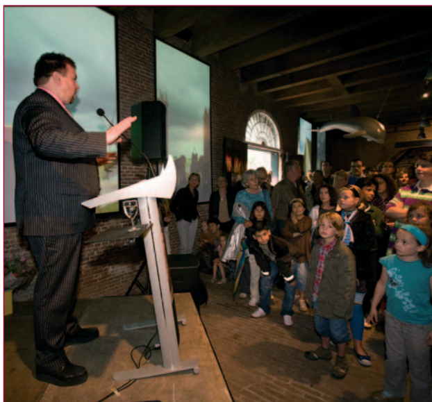
De opening van de tentoonstelling Dappere dieren: een 'iets' jonger publiek dan gebruikelijk.

Dirk Staat is directeur collecties van het Legermuseum. Van 1 mei tot 1 september 2008 nam hij de functie van algemeen directeur waar.