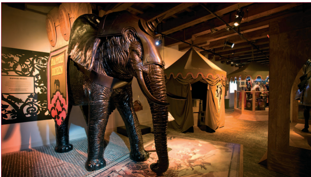
De olifant: ooit de schrik van het slagveld.

Dieren dapper en heldhaftig noemen – begrippen die immers menselijke keuzes veronderstellen – heeft voor Van der Pols geen wrange bijmaak. “Wat is dapper? Dapper zijn mensen die hun angst overwinnen en toch hun plicht doen. Zij stijgen boven zichzelf uit, wagen hun leven voor anderen. Waar we voor moeten oppassen is te zeggen dat mensen in oorlog wel een keuze hebben en dieren niet. Dieren hebben inderdaad geen keus, maar de geschiedenis toont dat mensen die vaak ook niet hadden. Soldaten waren soms banger voor hun officieren dan