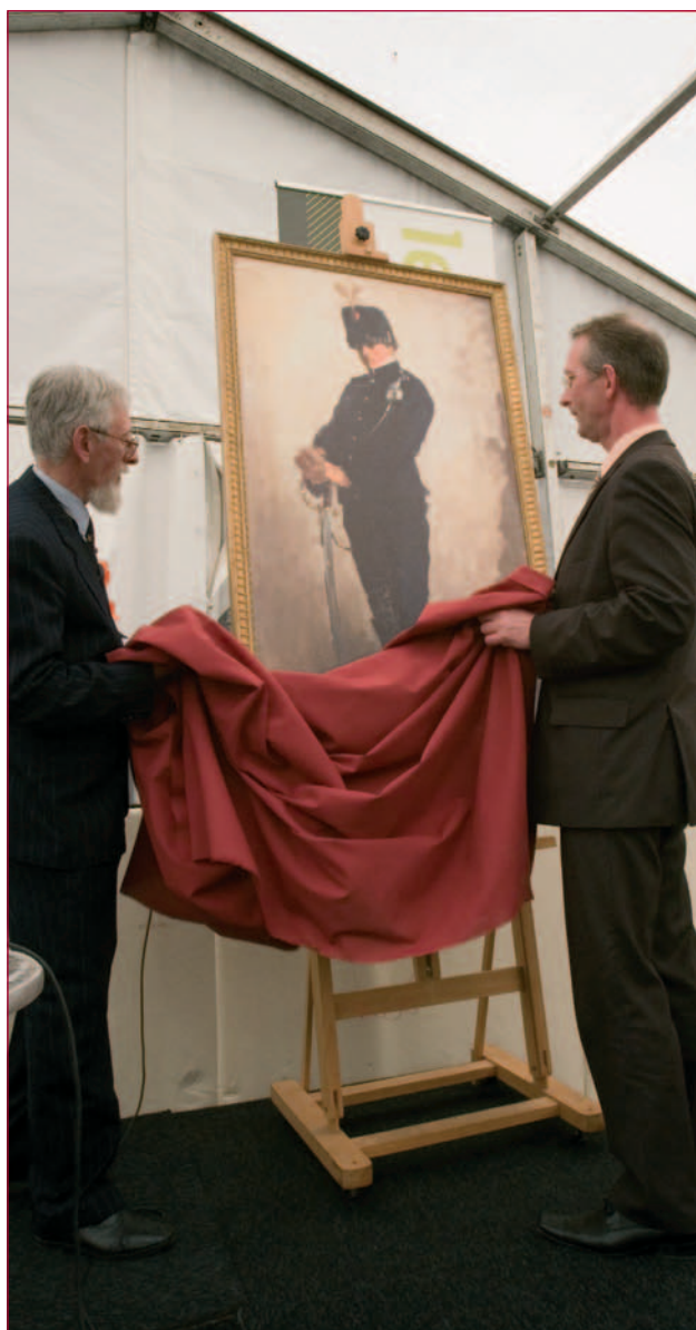
Symbolisch wordt een kopie van De Blauwe Huzaar van Breitner onthuld. De Vrienden leverden een grote bijdrage aan de aanschaf van het schilderij. Het origineel hangt al in het museum.