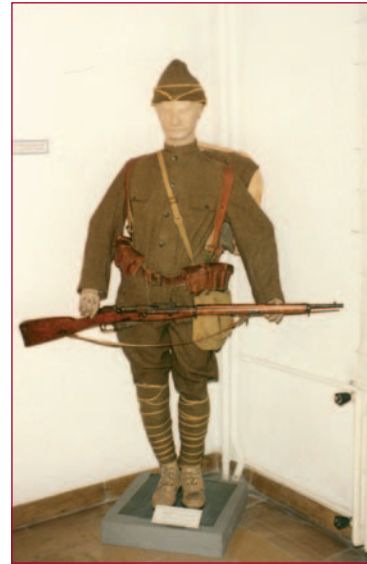
Turkse soldaat uit de Dardanellen-campagne van de Eerste Wereldoorlog.

In veel ogen is de topattractie van het museum het optreden van de Mehter, een van de oudste militaire muziekkorpsen ter wereld. De Mehter treedt elke middag twee keer op. De leden van de Mehter houden de traditie van het muziekkorps van de Janitsaren in stand. De Janitsaren vormden een elitekorps in het Ottomaanse leger. Het muziekkorps begeleidde de sultan tijdens zijn veldtochten en moest de tegenstanders angst aanjagen en indruk maken op de overwonnen bevolkingen. Kenmerkend is het gebruik van de verschillende pauktrommels, cimbalen, schellenboom, Turkse klarinetten, bazuïnen en trompetten. Deze instrumenten geven de muziek haar typische geluid dat componisten zoals Mozart en Beethoven heeft geïnspireerd. Het Askeri Müze is een prachtig museum dat zeker een bezoek waard is, ook als je minder geïnteresseerd bent in militaire geschiedenis. Het biedt een mooi beeld van de geschiedenis van het Ottomaanse Rijk en het hedendaagse Turkije. De tentoonstellingen zijn mooi en duidelijk ingericht met Engelstalige beschrijving. Het museum zelf is koel en rustig. Kortom, een mooi museum om even bij te komen van alle drukte.