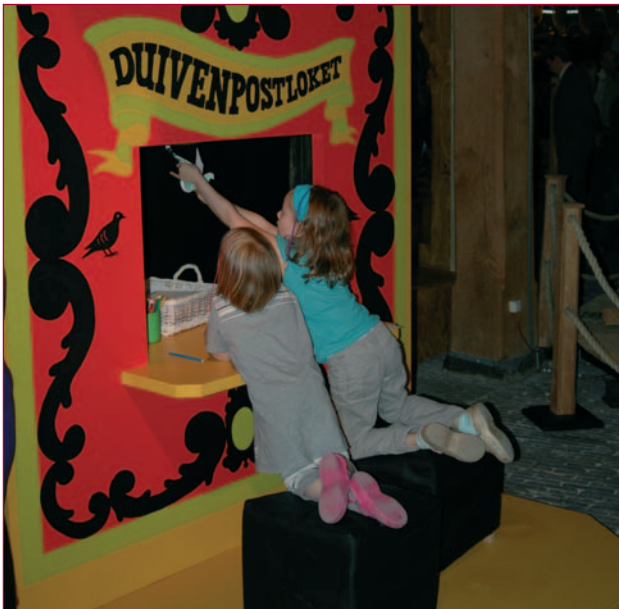
Kinderen versturen hun bericht per duivenpost.

voor de vijand en werden daardoor 'dapper'. Mijn opa voelde zich 100 jaar geleden sociaal nog een soort horige." 'Dapper' geldt volgens hem ook voor dieren: "Als je zelf dieren hebt, zie je ook dat de een dapperder is dan de andere. Het baasje wordt verdedigd, de jongen worden verdedigd met voorbijgaan van de eigen veiligheid. Daarin komt vaak de liefde en speciale band met de mens tot uitdrukking."