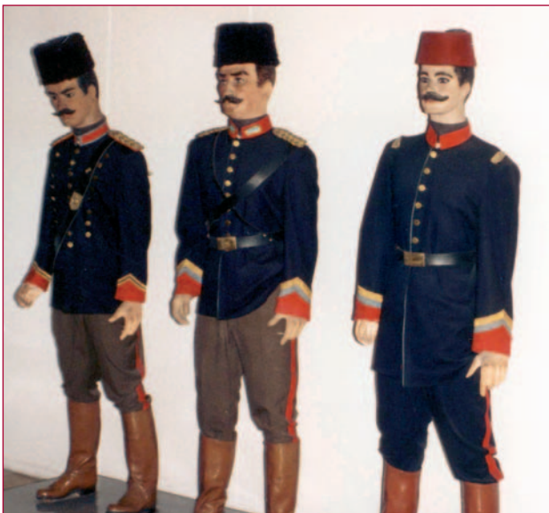
Soldaten in Ottomaanse uniformen van rond 1900.

De Eerste Wereldoorlog en vooral de strijd op de Dardanellen, waar Atatürk bij de slag om Gallipoli een geallieerde troepenmacht wist te verslaan, krijgt veel aandacht in het museum. Geïnteresseerden voor de Eerste Wereldoorlog kunnen hier hun hart ophalen. Uniek is dat dit museum de strijd vanuit het gezichtspunt van de Centralen (de tegenstanders van de geallieerden) weergeeft. Op de bovenste verdieping van het museum is bijvoorbeeld een tentoonstelling ingericht die herinnert aan