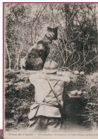
Het dier speelde een belangrijke rol in de Eerste Wereldoorlog. Het Franse leger gebruikte ezels en paarden om munitie naar het front te vervoeren en honden bij het in de gaten houden van de vijand.