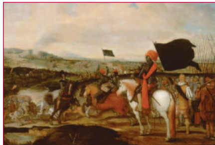
Nieuwpoort met op de voorgrond prins Maurits. (Collectie Legermuseum)

Het victoriegekraai van 'bootsgesellen' en 'canoniers' was misschien voorbarig – uiteindelijk kregen zij gelijk. De overwinning bij Nieuwpoort was onderdeel van een uitzonderlijke expeditie, een veldtocht door Vlaanderen, die in juni 1600 met een landing op de Zeeuws-Vlaamse kust was begonnen: een onovertroffen amfibische operatie waarmee zo'n 1.300 schepen