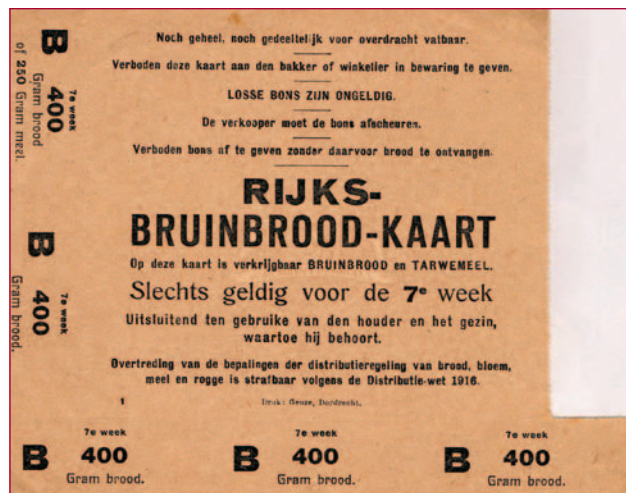
Bruinbrood op de bon. Een rijksbroodkaart uit 1917.

Ondanks de schaarste moest Nederland toch ook voedsel exporteren. Duitsland leverde ons onmisbare steenkool, maar eiste onder andere aardappelen en vlees als tegenprestatie. De ontevredenheid groeide, vooral in de arme wijken van de grote steden. In Amsterdam brak in 1917 het 'Aardappeloproer' uit. Eind juni lag er aan de Prinsengracht een schuit met aardappelen voor het leger. Een grote groep vrouwen ging kijken en in een mum van tijd was het onbewaakte vaarttuig leeg! Ze trokken verder door de stad, braken pakhuizen open en haalden schepen en spoorwagens leeg. Beloftes van de wethouders Josephus Jitta van Armwezen en Wibaut dat er gauw aardappels beschikbaar zouden zijn, hielpen niet. En rijst, die er nog wel was, aten ze niet! Op naar rangeerterrein De Rietlanden waar wagens aardappelen stonden! Ongeveer 1.000 kilo werd officieel verkocht, toen