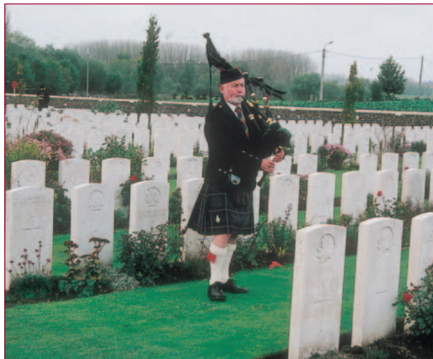
Op de militaire begraafplaats van Tyne Cot bij Passendale liggen 12.000 gesneuvelden van 1917 begraven, terwijl nog eens duizenden staan vermeld in de erewand der vermisten.

Voor de Belgen begon de Eerste Wereldoorlog de facto op 3 augustus 1914 toen de Duitsers in een ultimatum vrije doortocht eisten op weg naar aartsvijand Frankrijk. Dat land zou een aanval op Duitsland voorbereiden. Maar België weigerde en de dag daar-