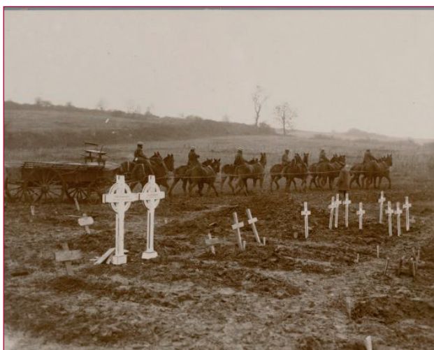
Twaalf paarden trokken een wagen met munitie. Op de voorgrond enkele van de talloze graven in het gebied rond Ieper.

op overschreden de Duitse legers de grens. De doortocht verliep minder vlot dan Keizer Wilhelm II had gehoopt. De zuidwesthoek van het land kreeg hij zelfs nooit in handen. De Belgen hielden stand achter de IJzer en de te hulp gesnelde Britten handhaafden zich rond Ieper.