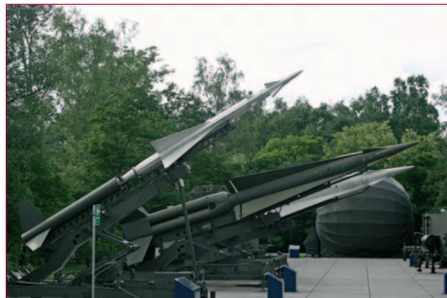
Luchtdoelraketten op het buitenterrein van het MLM: snijvlak tussen land- en luchtmacht.