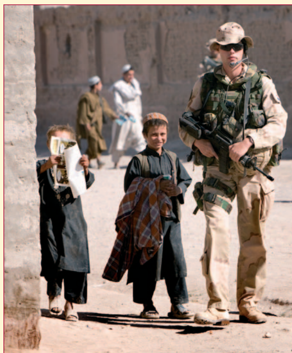
Nederlandse militair legt contact met de plaatselijke bevolking.