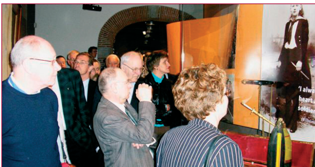
Een van de kerndoelen van het Legermuseum is 'exposities inrichten met mogelijkheden van explosieve uitstraling'.