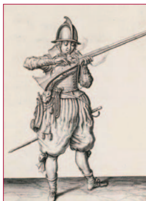
Van het roer wordt het lont afgeblazen en de pan geopend.

Die klank heeft nu ook dankzij de tentoonstelling Maurits en