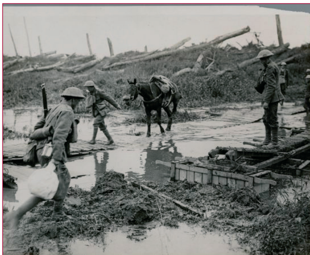
De modderpoel van het front bij Passendale.