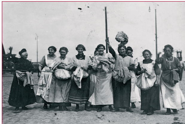
Vrouwen uit de Jordaan tonen de aardappelen die ze op het Amsterdamse rangeerterrein De Rietlanden hebben gekocht. (Foto: Het Leven 28, 10 juli 1917)

In De Rietlanden is met de handelaren overeengekomen dat enkele wagons aardappelen verkocht mogen worden. De politie regelt de verkoop, op voorwaarde dat de vrouwen de orde bewaren. Groepsgewijs worden ze toegelaten. (Foto: Het Leven 28, 10 juli 1917)