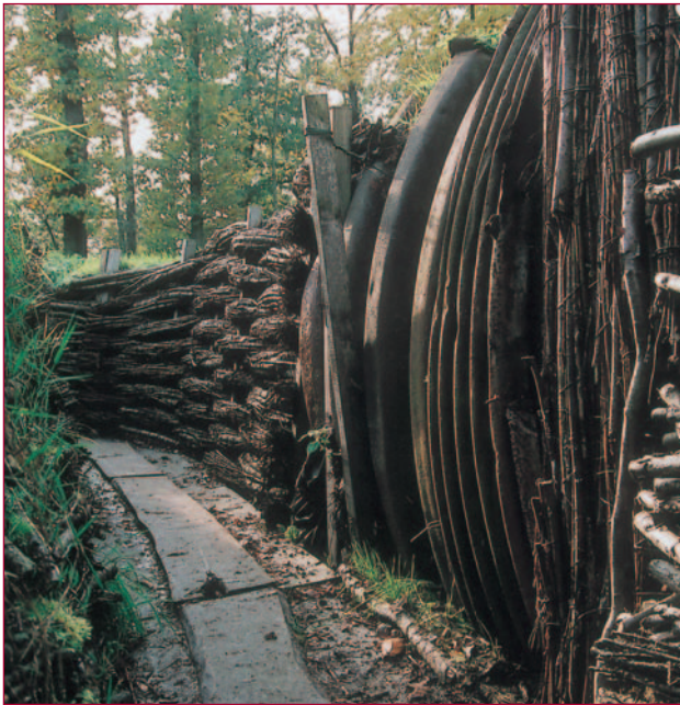
Een deel van de Duitse loopgraven bij Wijtschate is gerestaureerd en nu openluchtmuseum.

al geruime tijd gewerkt aan een tunnelstelsel dat over een breedte van dertien kilometers op negentien plaatsen onder de Duitse linies doorliep. De gangen werden gevuld met in totaal 600 ton springstof.