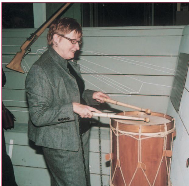
Een van de deelnemers ‘trommelt ten aanval’.

Zeer nieuwsgierig geworden, maakten de Vrienden een rondgang over de expositie. Door de herberg, het tuighuis met zijn helmen en harnassen, het bureau van Maurits ... Ze trommelten ten aanval, volgden via monitoren de geluidsfragmenten en