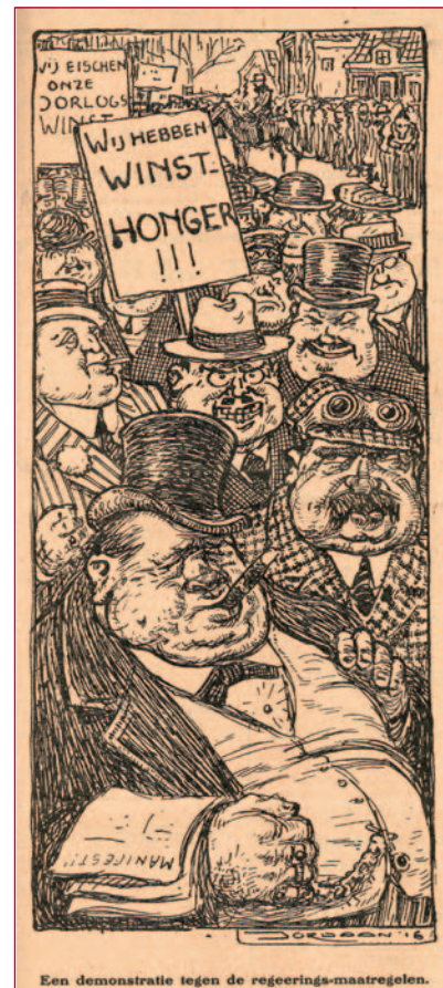
Een demonstratie tegen de overheidsmaatregelen.

De voedselsituatie verslechterde voortdurend. Zelfs de fabricage van eenheidsworst en het scheuren van akkers voor het verbouwen van gewassen hielp niet. De gezondheidstoestand van de Nederlanders liep terug. Toen op 11 november 1918 de klokken van de Big Ben in Londen de wapenstilstand aankondigden, betekende dat niet alleen de bevrijding voor de soldaten in de loopgraven, maar ook voor de Nederlandse bevolking.