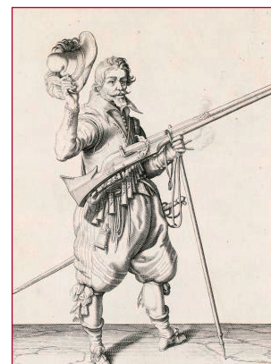
Een musketier, een van de vele instructietekeningen van Jacob de Gheijn.