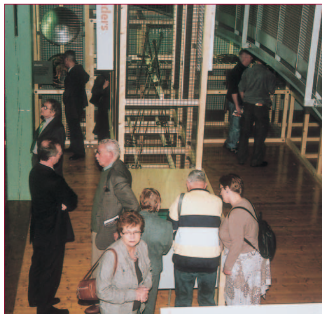
De Vrienden verkennen de nieuwe expositie.