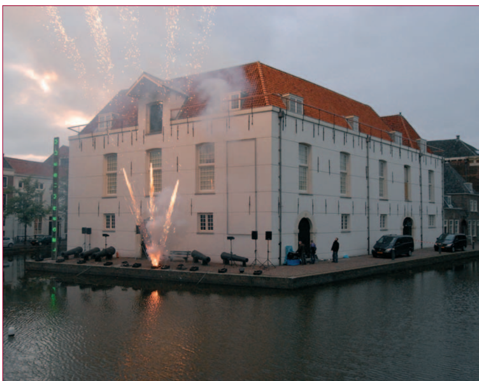
De tentoonstelling Boem!! werd op een toepasselijke manier geopend: met knallend vuurwerk onder belangstelling van de genodigden en de Delfse bevolking.