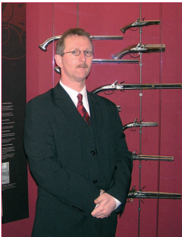
Dit najaar valt er veel te genieten in het Legermuseum, onder andere de expositie Collectie Visser.