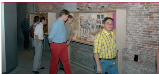
Tijdens de opening was er ook gelegenheid tot het bezoeken van de tentoonstelling Levensecht! Van hondenkop tot paardenkont.