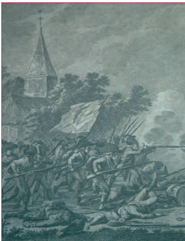
Fel gevochten is er in 1799 om het plaatsje Schoorl. Een aanval van Franse en Bataafse troepen bij de kerk, detail van een ets van D. Langendijk (1800).