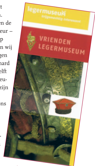
De nieuwe kleurrijke Vriendenfolder.

een daartoe geëigend evenement uitdelen om Vrienden te werven. Nog mooier is het natuurlijk – en de feestdagen staan weer voor de deur – om iemand een jaar Vriendschap cadeau te doen. Daarvoor hebben wij nu de cadeaubon (ook op te vragen telefonisch of per e-mail bij Richard Budël, zie hierboven). De ene helft is bestemd voor de gelukkige nieuwe Vriend, de andere helft met zijn gegevens en uw donatie ten behoeve van hem stuurt u aan ons secretariaat. De nieuwe Vriend krijgt dan – maar dat geldt nu voor iedere nieuwe Vriend – de Vriendenkaart, een boek als welkomstgeschenk en een setje van zes verschillende boekenleggers, die hij op zijn beurt weer kan uitdelen om nieuwe Vrienden te werven.