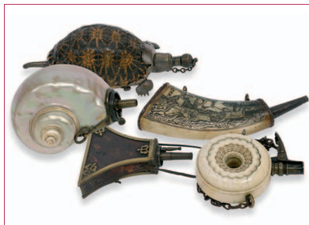
Fraaie kruithoorns uit de collectie-Visser.

Naast Nederlandse producten zijn ook fraaie stukken van buitenlandse makelij in de verzameling opgenomen. Opmerkelijk zijn bijvoorbeeld de vroege magazijn geweren en achterladere: ware technische hoogstandjes uit de Gouden Eeuw. Naast vuurwapens (en toebehoren zoals kruithoorns), zijn ook Nederlandse blanke wapens zoals rapieren, degens en sabels vertegenwoordigd in de collectie. In het najaar zal de gehele Visser-collectie te zien zijn op de tweede verdieping van het Legermuseum.