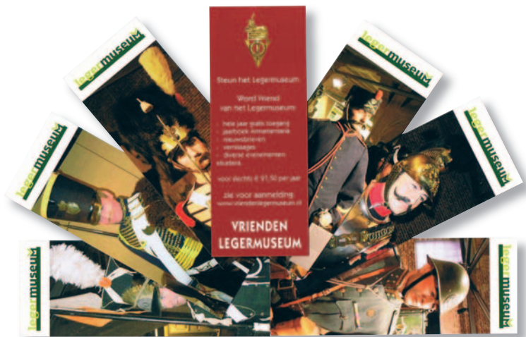
De nieuwe serie van zes fraaie boekenleggers.

Goed idee! Maak met deze cadeaubon een bekende een jaar lang Vriend.