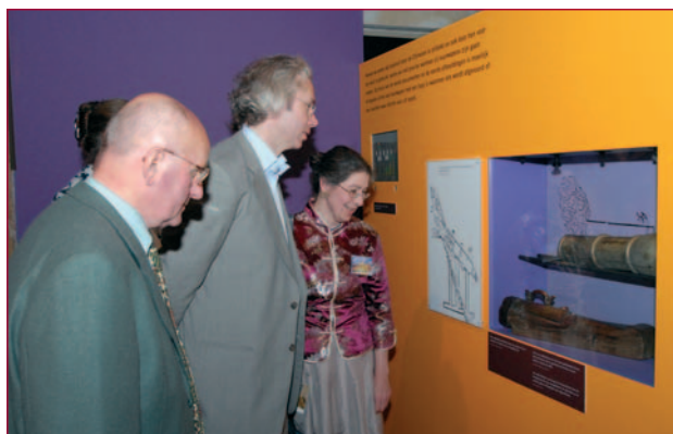
Enkele Vrienden bekijken een van de verschillende unieke objecten die te zien zijn in de tentoonstelling Boem!!

Hieronder een fotoreportage van deze wederom zeer geanimeerde evenementen (zie voor meer foto's www.vriendenlegermuseum.nl onder 'evenementen').