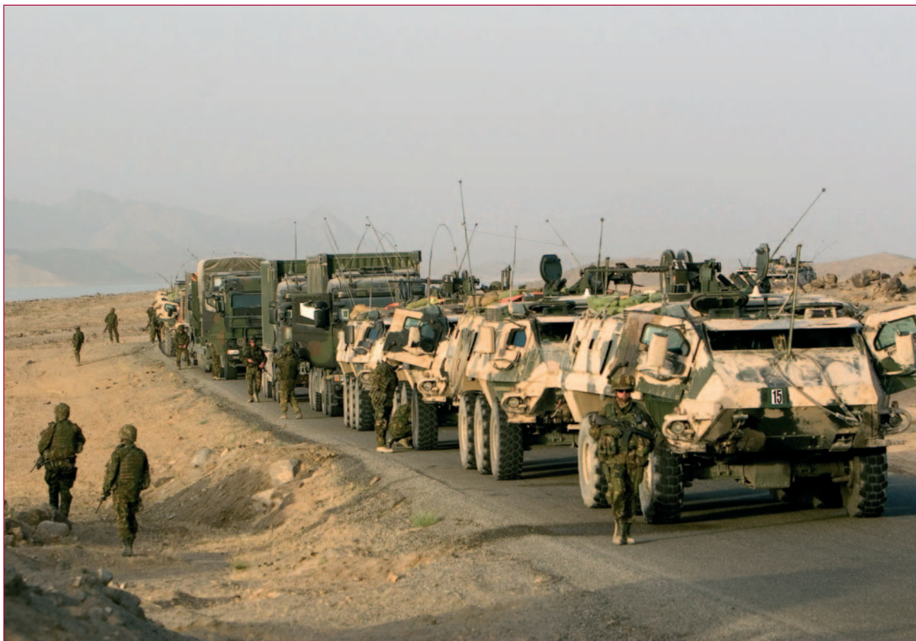
Nederlands konvooi in Uruzgan. Voorop Patria XA 188-pantserwagens gevolgd door Scania 165 KN-vrachtauto's.