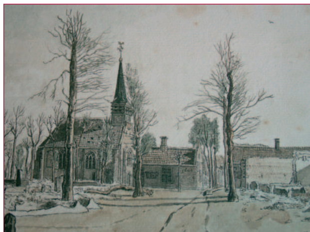
De kerk van Schoorl na de slag, penseeltekening van J.A. Crescent (1800).

nooit in één groep kon worden meegenomen. Daarom kwam er naast de oorspronkelijke excursie op zaterdag een tweede tour op zondag. Uiteindelijk waren zelfs die groepen nog vrij groot, met 58 bezoekers op zaterdag en 56 op zondag.