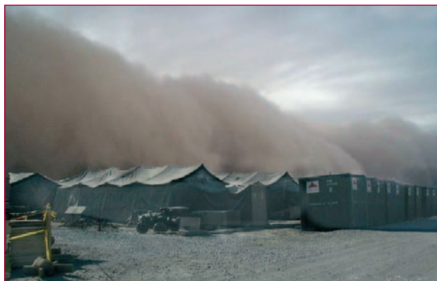
Kandahar Airfield in een zandstorm.

De maand juli is begonnen. Dit lijkt een dooddoener maar voor veel militairen van de DTF betekent dit dat zij ergens deze maand naar huis gaan en voor de militairen van TF-U betekent het een maand van vertrek en het begin van een missie. Daar sta je dan wel even bij stil nu we aan het einde van deze