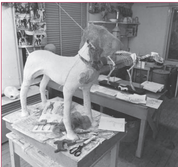
Voor de hondentractie zijn honden nagemaakt van het ras Mâtin Belge, omstreeks 1970.

Het gebruik van scènes en figuren in tentoonstellingen is onderhevig aan veranderende opvattingen. Was het lange tijd in museumland not done , de laatste jaren blijkt het weer een prachtig middel om de bezoeker dicht bij de 'echte' objecten te brengen en de 'echte' mensen die de collectiestukken hebben gedragen of gebruikt, te laten zien. Zo staan in het