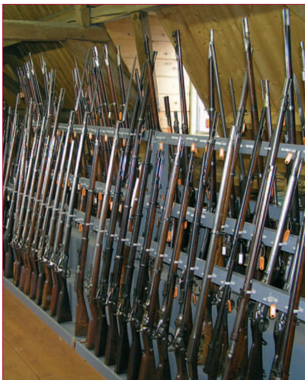
Rekken vol met voor- en achterladers.

Het Legermuseum heeft de grootste verzameling vuurwapens van Nederland. De collectie telt maar liefst 7.500 stuks, waarvan ruim 2.000 op de wapenzolder. Vanaf de historische lontslotmusketten tot en met de modernste automatische handvuurwapens. Zeldzame types zoals het Borchardt-pistool en het Mauser SR-93-scherpschuttersgeweer, behoren tot de eyecatchers. Om veiligheidsredenen is de zolder niet toegankelijk voor het publiek, maar deze Nieuwsbrief biedt u een kijkje achter de schermen.