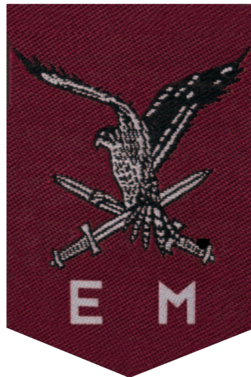
De traditie van de Expeditionaire Macht (7 December Divisie) werd als laatste gevoerd door het Operationeel Commando '7 December'. Deze traditie is overgenomen door 11 Luchtmobiele Brigade.

En zo speelt het Legermuseum een belangrijke rol bij een juiste traditiehandhaving, die in het bijzonder vaak bij emblemen en uniformering tot uiting komt.