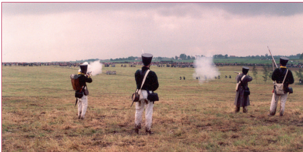
18 juni 1815 was niet de laatste keer dat er kruitdampen boven de velden van Waterloo hingen.

Inmiddels was ik ook al vele malen in Waterloo geweest. Hierdoor ontstond mijn interesse in de Napoleontische oorlogen en Napoleon zelf. In 1990 was ik getuige van de grote heropvoering van de slag bij Waterloo. Ik ontmoette toen vele geestverwanten en raakte er in contact met het fenomeen re-enactment . Heropvoering van dingen en zaken uit onze rijke vaderlandse geschiedenis. In mijn geval de geschiedenis van de krijgsmacht. Mijn nieuwe kennissen en ik richtten in 1994 de NAN op, de Napoleontische Associatie der Nederlanden. Ik mocht hun eerste voorzitter zijn.