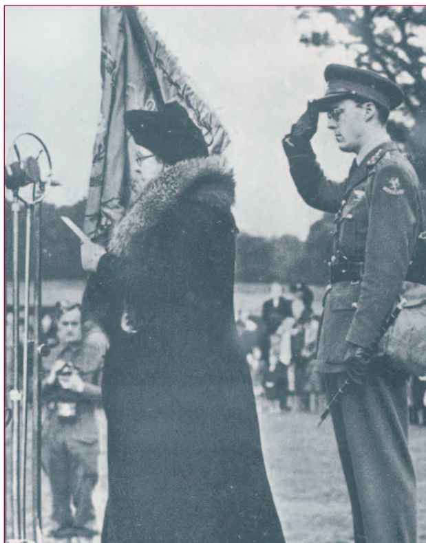
Koningin Wilhelmina reikt op 27 augustus 1941 het vaandel uit aan de Irenebrigade.

Nadat eind 1945 de Irenebrigade was ontbonden – de brigade ontving daarbij de Militaire Willemsorde 4e klasse welke onderscheiding aan het vaandel werd gehecht – werd het regiment Prinses Irene opgericht, dat in totaal vijf bataljons in het voor-