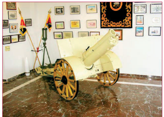
Berggeschut uit de tijd van de Spaanse burgeroorlog.

Het museum besteedt natuurlijk aandacht aan een voor Spanje niet zo prettige periode, de burgeroorlog (1936-1939). De legionairs stredden aan de kant van de nationalisten, onder leiding van generaal Franco. In die tijd verdubbelde ook de sterkte van negen tot achttien bataljons. Verder werd in 1937 de benaming El Tercio de Extranjeros veranderd in La Legión.