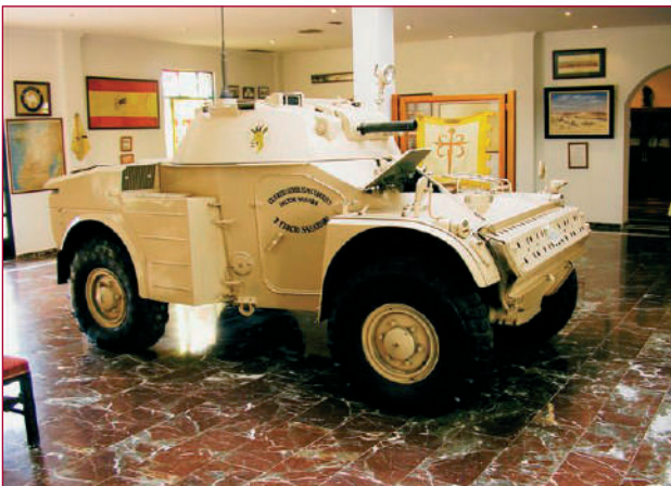
In de Sahara werd deze Panhard AML-pantserwagen gebruikt.