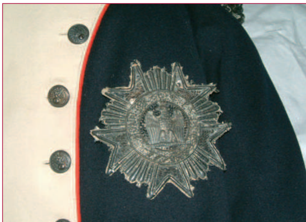
Detail van Napoleons uniform van kolonel van de Nationale Garde. (Bruikleen Musée national du Château de Fontainebleau)

met 'levensechte' figuren wordt een persoonlijke gebeurtenis meer uitgediept. De verhalen zijn gebaseerd op internationaal onderzoek naar de individuele ervaringen van militairen in de Franse tijd.