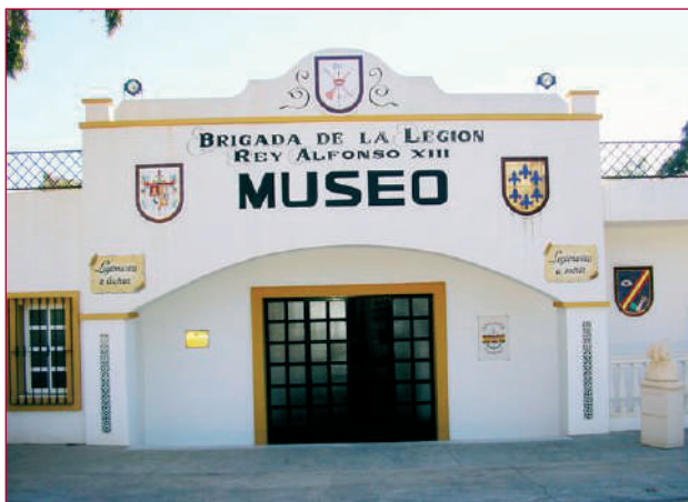
Het museumgebouw van La Legión te Viator. De benaming van het gebouw herinnert aan de oprichting van het Vreemdelingenregiment door Koning Alfonso XIII. De brigade van het huidige legioen voert ook deze benaming.