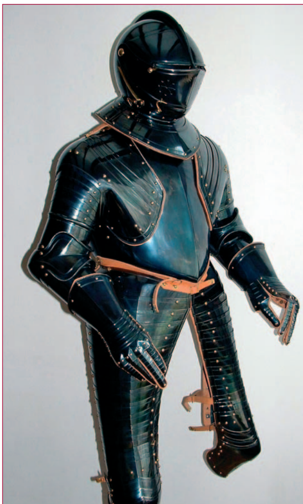
Het Mauritsharnas, de eerste opdracht van het Legermuseum.

Het vervaardigen van topharnassen kost veel tijd. Bij het Mauritsharnas is alleen al in de voorbereiding meer dan 400 uur gaan zitten. Het origineel van dit harnas bevindt zich in de collectie van de Hofjagd- und Rüstkammer des Kunsthistorischen Museums in Wenen. Behalve dit ene exemplaar is er op de hele wereld geen enkel ander harnas van een van onze Oranjes bekend. Bij hoge uitzondering kreeg Gotscha toestemming om dit unieke stuk uit elkaar te halen. Op die manier kon hij onderdeel voor onderdeel bestuderen, opmeten en fotograferen. Aan de hand van de aldus verkregen gegevens maakte hij ongeveer 150 werktekeningen. Hierna zijn alle 177 plaatdelen stuk voor stuk volledig met de hand vervaardigd. Dat begint met het op maat knippen en soms zagen van het plaatstaal. Wat dan volgt is een moeizaam en tijdrovend proces van in vorm brengen. Onder vele duizenden hamerslagen worden langzaam de contouren van elk onderdeel zichtbaar. Dit gebeurt grotendeels koud met behulp van houtblok, aambeeld, tassen, staken en speciaal gevormde hamers. Soms is het nodig het materiaal te verhitten, waarbij een acetyleenbrander het ouderwetse smidsvuur vervangt. Na het bereiken van de definitieve vorm begint het afwerkingsproces van slijpen, schuren en polijsten. In veel