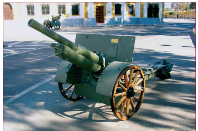
Rondom het museum en het stafgebouw staat volop berggeschut. Hier een 75 mm kanon. Merkwaardig is de vermelding op het identificatieplaatje: Año 1945. Je zou dit berggeschut, met houten raden, toch ouder dateren.