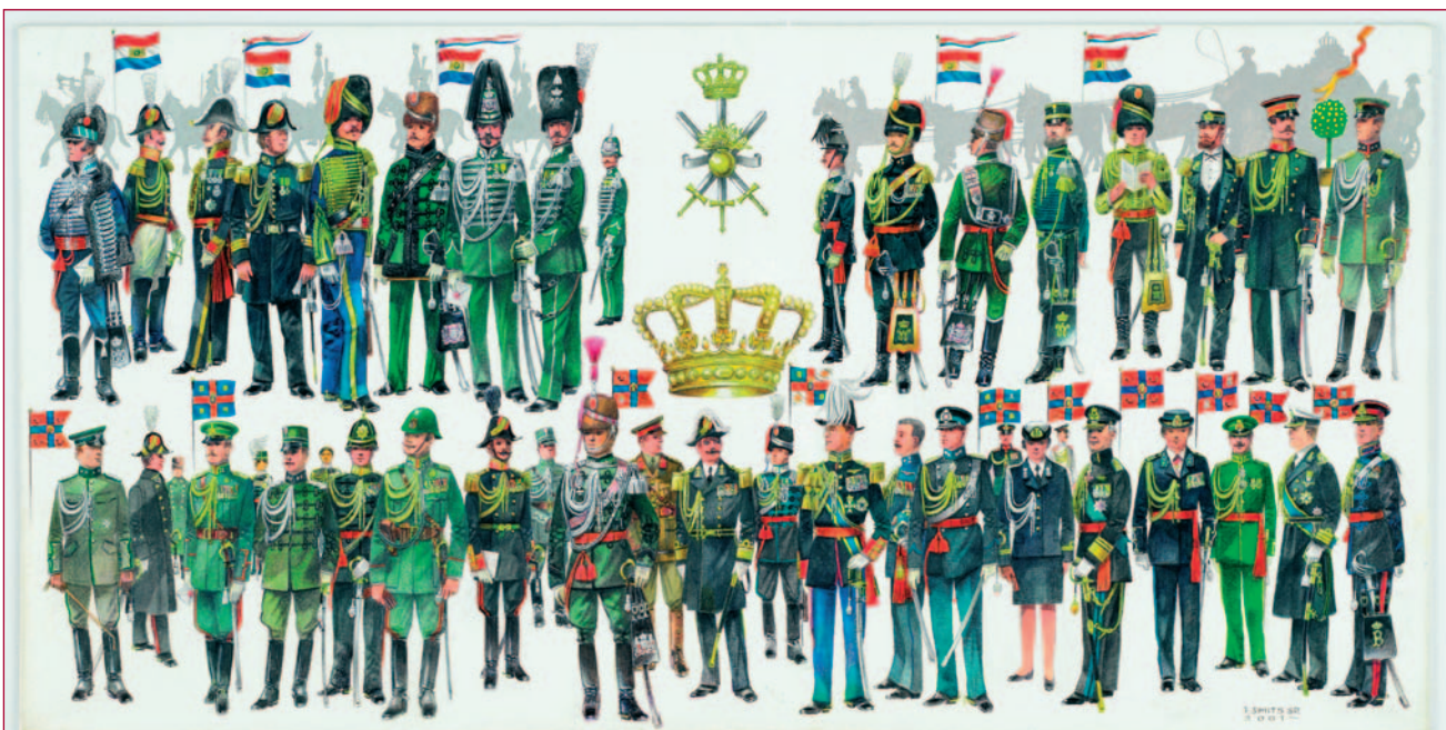
Het Militaire Huis (1814-heden). Illustratie: Frans Smits. (in Armamentaria 37, 2002)

'Was getekend: Frans Smits', van de hand van Klaas Kornaat, wordt uitgegeven onder auspiciën van het Legermuseum. Het boek, met de reproducties in een luxe cassette, is verschenen in een zeer gelimiteerde uitgave. Het is te koop in het Legermuseum of de boekhandel voor 75 euro.