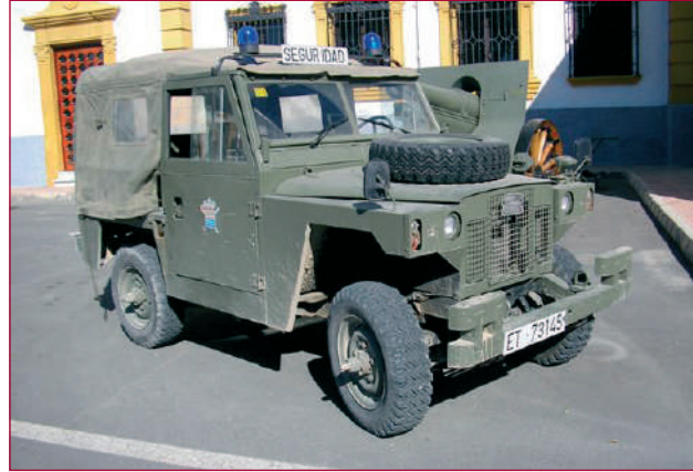
La Legión beschikt nog steeds over Land Rovers. Maar deze worden langzaam maar zeker vervangen door Nissan Patrols.