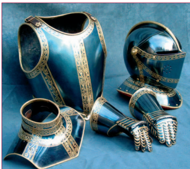
Het schitterende gereconstrueerde kinderharnas van Maurits.

Wie meer van het werk van Gotscha Lagidse wil zien, kan terecht op zijn website: www.gotscha.nl