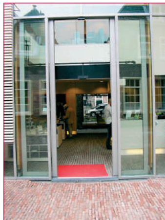
Hier gaat u voortaan het Legermuseum binnen: de nieuwe hoofdentree.

Op de eerste etage hebben de medewerkers van publiekservices hun domicilie, terwijl de begane grond ruimte biedt aan een