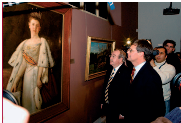
Premier Balkenende en oud-minister van Defensie Ter Beek kijken naar een portret van de nog jonge Wilhelmina.

De tentoonstelling die ik straks mag openen, geeft u een goed beeld van die oorlogsjaren. Van de aanloop er naar toe. Van de periode in Londen. En van de terugkeer van de vorstin uit ballingschap. Er zijn voorwerpen te zien. En bewegende beelden die nieuw licht werpen op koningin Wilhelmina. Het is een erg leerzame expositie.