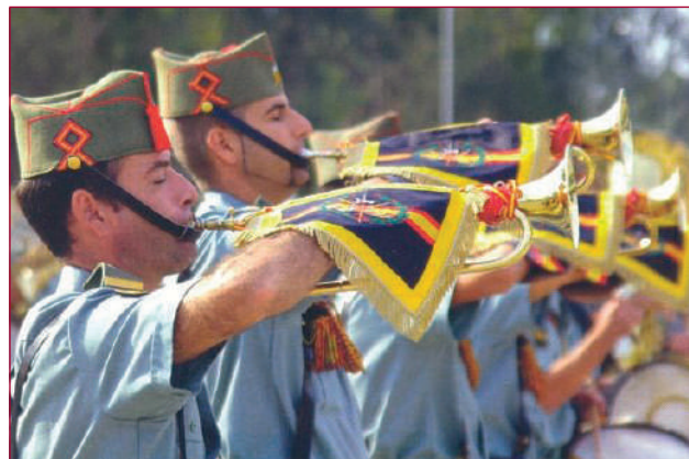
Hoornblazers tijdens een parade.

gerd te Ronda nabij Málaga en zoals gezegd in de Spaanse exclaves in Marokko. Een special forces-eenheid ter sterkte van een bataljon is het paradepaardje. Nog altijd kunnen niet-Spanjaarden toetreden, als ze Spaanstalig zijn. Maar in de praktijk komen de legionairs toch voornamelijk uit Spanje en Latijns-Amerika.