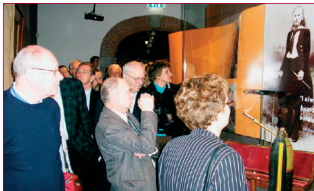
Er kwamen veel Vrienden naar de vernissage van de expositie 'Wilhelmina – Vorstin in oorlogstijd'.

De liefde voor het vaderland had reeds doorgeklonken in de toast die zij op de avond van haar inhuldiging aan het diner in