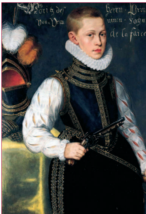
Schilderij uit het Koninklijk Huisarchief dat als voorbeeld diende voor het kinderharnas.

gevallen, zoals bij het Mauritsharnas, volgt nog het 'vuurblauwen'. Gotscha Lagidse is een ware meester in dit delicate werk. Met de brander verhit hij het glimmend gepolijste metaal zodanig, dat het een prachtige diepdonkerblauwe kleur krijgt. Dat moet zeer precies en gelijkmatig gebeuren. Eén moment van onoplettendheid kan het resultaat verloren laten gaan. In het harnas zijn verder zo'n 800 verguld ijzeren klinknagels, gespen, scharnieren, haken en ogen verwerkt. Eveneens stuk voor stuk met de hand vervaardigd! Als alle onderdelen klaar zijn, kan het assembleren beginnen. Ook hiermee is geruime tijd gemoeid. De honderden klinknagels moeten met grote voorzichtigheid worden aangebracht om beschadigingen aan het omringende metaal te voorkomen. Een waar monnikenwerk, dat een vaste hand en veel vakmanschap vereist!