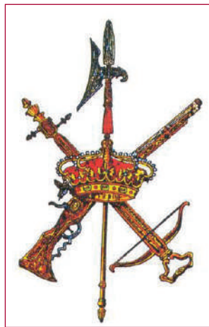
Het embleem van La Legión.

Mijn eerste fout is snel gemaakt als ik tegen de soldaat die mijn identificatie en afspraak aan de poort grondig controleert, zeg: "Muchas gracias soldado." Zijn reactie is onverbidlijk: "No soldado, pero legionario." Zijn kin gaat hierbij strak en trots omhoog. Het is duidelijk, ik ben op bezoek bij een elite-eenheid van het Spaanse leger: La Legión, het Spaanse Vreemdelingenlegioen.