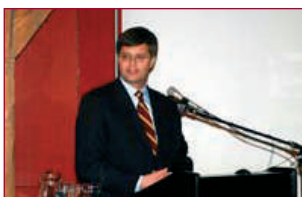
Een primeur voor het Legermuseum: minister-president Balkenende geeft een speech tijdens de opening van de Wilhelmina-tentoonstelling.