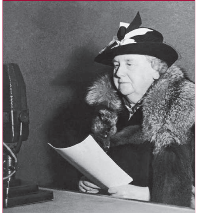
Koningin Wilhelmina voor de microfoon van Radio Oranje in 1941

Als er één voorwerp is waar de tentoonstelling Wilhelmina – Vorstin in oorlogstijd 1940-1945 om draait dan is het wel de stalen helm 'Nieuw Model (NM)' of 'M.27', die de vorstin tijdens de dramatische meidagen van 1940 bij zich heeft gedragen. De aanduiding M.27 verwijst naar 1927, het jaar van invoering van de helm in het Nederlandse leger. Voorop is een ovale embleem aangebracht met een klimmende leeuw waarin de zakelijke stijl van de Nieuwe Kunst is te herkennen. Het vorstelijke van Wilhelmina's helm zit hem in het binnenwerk. In 1939 was door het Militaire Huis van de koningin aan de firma Blomjous, uniformkleermakerij en militair coupeur op de Denneweg te Den Haag, opdracht gegeven het standaard leren binnenwerk van de helm te verwijderen. Om de helm beter op het kapsel van de koningin te laten passen, werd de helm vervolgens voorzien van een voering van bont.