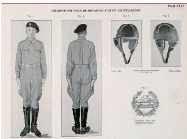
Een uitklapplaat uit het KNIL-kleedvoorschrift, eerste deel, uitgave 1941 (Legermuseum, inv.nr. 00002046/26). (Met (benaming) wordt bedoeld "bemanning")