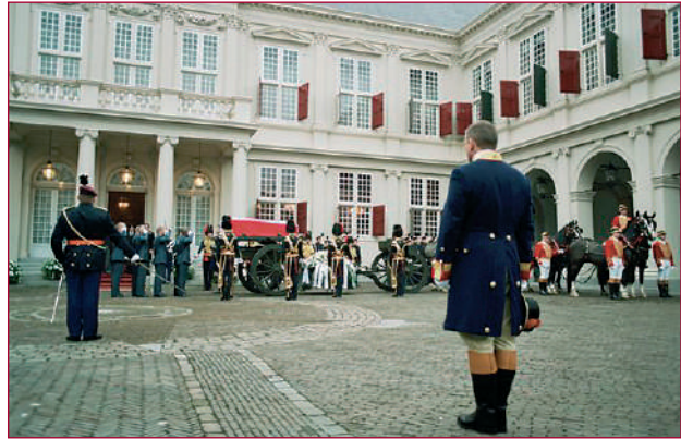
Op het voorplein van Paleis Noordeinde brengt het militair- en hofpersoneel de eregroet. De draagploeg, gevormd door personeel van de Koninklijke Luchtmacht, heeft zojuist de kist, gedekt door de Nederlandse vlag op de katafalk van de affuit geplaatst.

Bij de bijzetting van Prins Claus werd de rouw aangepast aan de moderne tijd. De witte lijkkoets werd vervangen door een moderne nieuwe paarskleurige koets, die veel gelijkenis vertoonde met koetsen uit het begin van de 18 e eeuw. De Koninklijke standaarden op de paleizen werden voorzien van een rouw-