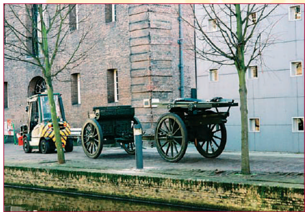
De affuit arriveert op de Korte Geer bij het Legermuseum op 20 december 2004. De munitievoerwagen is van het Legermuseum.

De affuit zal bij het uitkomen van deze nieuwsbrief al zijn verhuisd naar het Nationaal Museum het Loo te Apeldoorn. Deze gaat daar deel uitmaken van de tentoonstelling “Het Vaderland Ghetrouwe: Oranje in de jaren 1940-1945”. Op deze tentoonstelling, ter gelegenheid van de 60ste herdenking van onze bevrijding, zal uitvoerig worden ingegaan op de oorlogsjaren van ons Koningshuis. Met natuurlijk veel aandacht voor Prins Bernhard als Bevelhebber Nederlandse Strijdkrachten in 1944-1945. Een bijzondere afsluiting van een bijzonder leven. Een leven als een prins.