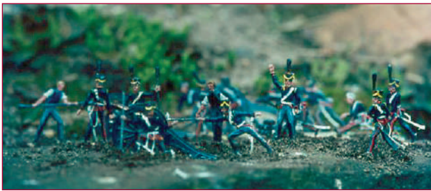
Nederlandse artillerie bij Waterloo, 1815. Platte tinnenfiguren (30 mm) NSM.

soldaatje tot hoogwaardige schaalmodellen zoals 20-even genoemd, vanaf de Oudheid tot heden, was te zien op de tentoonstelling Tinnen soldaatjes en andere miniaturen . Deze reizende jubileumtentoonstelling van de NSM was in 1995 ook te gast in het Legermuseum.