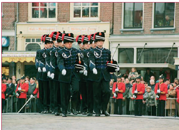
De reserve draagploeg, gevormd door huzaren van het Regiment Huzaren van Boreel, draagt de kolbakken van de draagploeg onder de arm weg van de Markt.

Als lid van de Uniformcommissie van de Koninklijke landmacht was er voor ondergetekende binnen een kort tijdsbestek veel advieswerk aan de winkel. De wens van de prins was dat het affuit werd begeleid door officieren van het Korps Rijdende Artillerie. Zo moest er bijvoorbeeld een inventarisatie gehou-