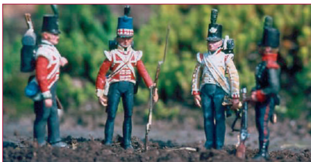
Stadden figuren (3D 54 mm) Napoleontische tijd, Brits.