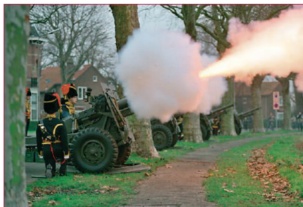
Een van de 25 ponder veldkanonnen van de Eresaluutbatterij van het Korps Rijdende Artillerie lost een minuutschot. De batterij is opgesteld op de Singel te Delft in de bocht van het Rijn-Schiekanaal; “de Vliet”.