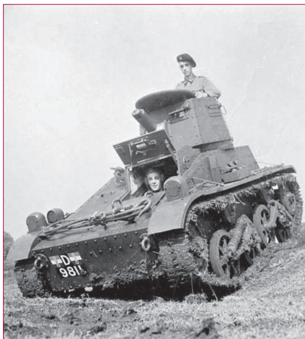
Een Vickers Carden Loyd tweemanstank met vechtswagenbemanning op manoeuvre.