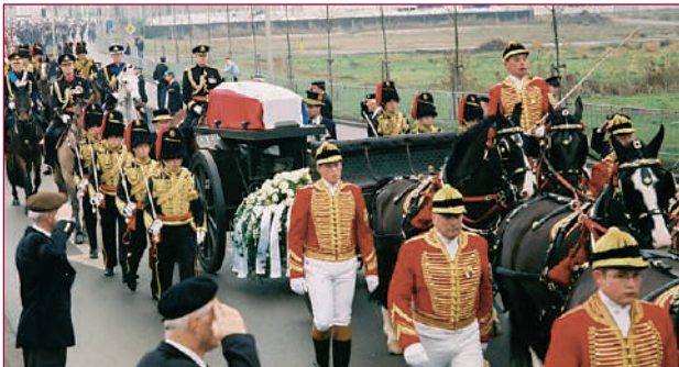
De affuit met het stoffelijk overschot van Z.K.H. Prins Bernhard, tijdens de uitvaart op 11 december 2004, heeft zojuist het Instituut Defensie Leergangen verlaten. Veteranen, nauw verbonden met de Prins, brengen de eregroet.

En zo werden de plannen werkelijkheid tijdens de uitvaart op 11 december 2004. Met groot militair ceremonieel vertrok de uitvaartstoet naar de Nieuwe Kerk in Delft, geëscorteerd door 800 militairen. Nog eens 6000 militairen en 400 veteranen zorgden voor de afzetting langs de route. De affuit werd getrokken door zes Gelderse en Groningse paarden in postiljonaanspanning. De postiljons, koetsiers van de het Koninklijke Stallen, bereden twee paarden. Daarnaast liepen 6 koetsiers mee. De kist met het stoffelijk overschot van Prins Bernhard was op de katafalk geplaatst en afgedekt met de Nederlandse driekleur. Daarnaast officieren van het Korps Rijdende Artillerie in ceremonieel tenue.