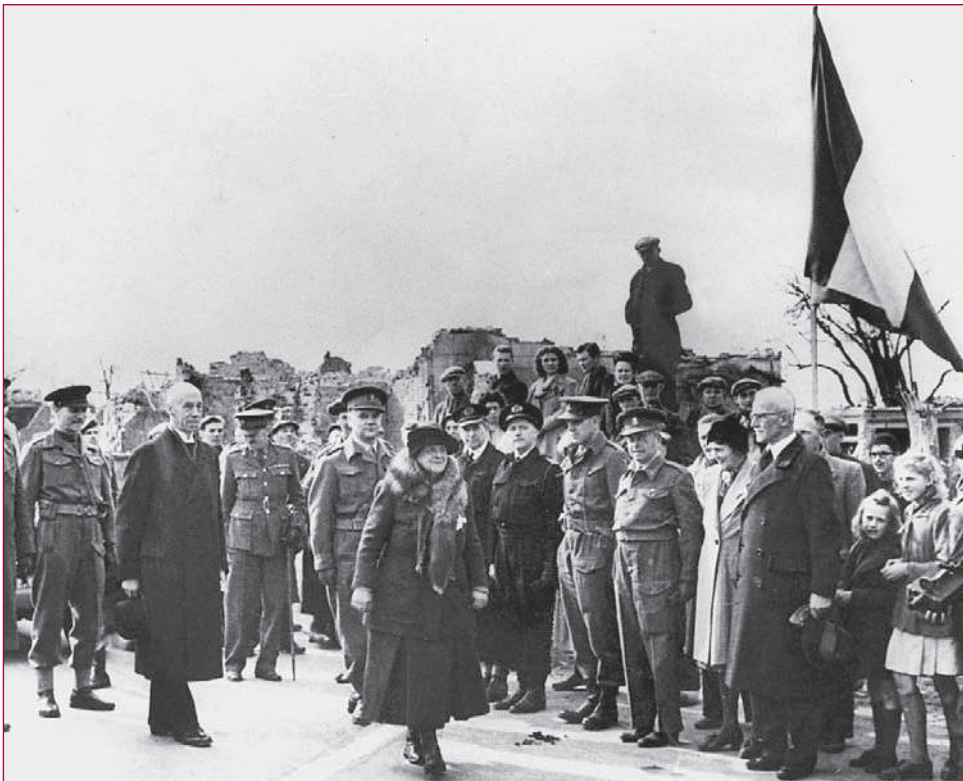
Koningin Wilhelmina betreedt in het Zeeuwse grensplaatsje Eede-Aardenburg Nederlands grondgebied na bijna vijf jaar ballingschap, 13 maart 1945.