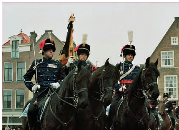
Standaardwacht van het Ere-escorte Cavalerie. De standaard van het regiment Huzaren van Boreel is voorzien van de rouwcravatte. De commandant van de standaardwacht, de regimentsadjudant standaarddrager en een wachtmeester verlaten de Grote Markt.

Het bericht dat de prins was overleden was voor het museum het teken dat het museale draaiboek voor de in memoriamtentoonstelling in werking werd gezet. Een wezenlijk onderdeel van