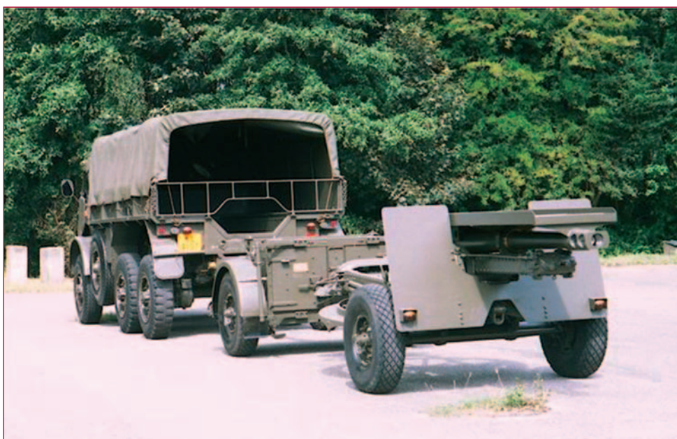
De DAF YA-328, met munitievoorwagen en 25-ponder kanon hier op 17 augustus 2004 op het mobilisatiecomplex Maaldrift. Voertuig en stuk zijn overgedragen aan de Rekwisieten Commissie KL op Maaldrift.