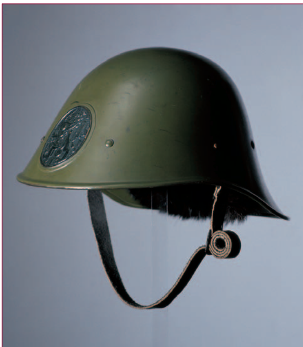
Stalen helm 'Nieuw Model (NM)', gevoerd met bont. (bruikleen Koninklijk Huisarchief, Den Haag)

dringend advies van onder meer de opperbevelhebber van Land- en Zeemacht Generaal Winkelman. Militair was de situatie drie dagen na de Duitse invasie vanuit Nederlands oogpunt vrijwel uitzichtloos. De vijand was veruit de meerdere van de veel minder goed bewapende en uitgeruste Nederlandse troepen. Op maandag 13 mei, even voor tien uur 's ochtends, verliet Wilhelmina met wat handbagage per gepantserde geldauto paleis Noordeinde. Onder militaire escorte werd Hoek van Holland bereikt. Daar ging zij omstreeks 12 uur aan boord van het Engelse marineschip H.M.S. Hereward . Aan het einde van de middag meerde de torpedojager af in de Engelse havenplaats Harwich. De reis werd per trein voortgezet. 's Avonds werd het Londense Liverpool Street Station bereikt, waar het vermoede Nederlandse staatshoofd werd opgewacht door de Engelse koning George VI.