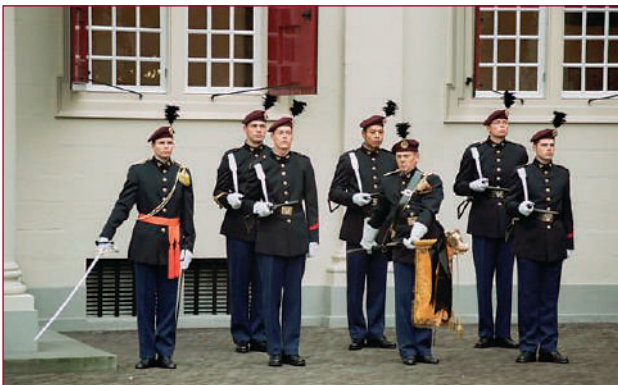
De vaandelwacht van het Regiment Stoottroepen Prins Bernhard voor het Paleis Noordeinde. De regiment-adjutant vaandeldrager brengt de laatste eregroet aan de naamgever van het regiment. Het vaandel is voorzien van een zwarte rouwcravatte.

De afgelopen jaren werden voor de Koninklijke Familie mede gekenmerkt door feestelijke trouwerijen, doopplechtigheden maar ook het overlijden van Prins Claus, Prinses Juliana en Prins Bernhard. Zijn trouwerijen en doopplechtigheden een semi-publiekelijke privé aangelegenheid; de bijzetting met de eeuwenoude ceremoniën is voor een groot deel een staatsaangelegenheid.