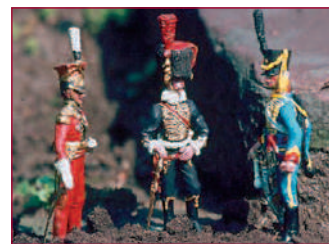
Modelfiguren Staatse Leger Nederland (3D 54 mm) 18e eeuw.