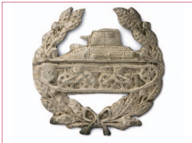
Het KNIL-vechtwagenembleem (Legermuseum, inv.nr. 094954).

De Mobiele Eenheid bestond uit een staf (in een Scoutcar van het type White), verbindingsafdeling (lange afstandsradio en motorordonnansen) en een compagnie van 24 vechtwagens, waaronder een commandogroep van 3 Britse lichte Vickers Carden Loyd tanks (tankettes) en drie pelotons van 7 vechtwagens. Het 1e peloton bestond uit Amerikaanse lichte Marmon Herrington tanks, deze waren pas aangekomen en nog niet ingereden. De andere twee pelotons bestonden eveneens uit