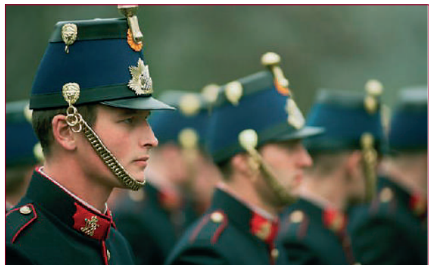
Een soldaat van de erecompagnie, gekleed in het nieuwe ceremoniële tenue van het Regiment Johan Willem Friso, staat na inspectie gereed bij het Instituut Defensie Leergangen voor het laatste gedeelte van de Koninklijke stoet.

cravatte. De trommen van de muziekkorpsen werden niet meer omfloerst met dungazige zwarte voiles, zo ook niet de modelopgemaakte onderscheidingen op de borst van de militairen en de vaandels en standaarden van de krijgsmachtdelen. De vaandels en standaarden werden voorzien van rouwcravattes.