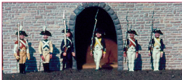
Stadden figuren (3D 54 mm) Napoleontische tijd, Frans. (reg.nr. 00189997)

gemaakt en waren exclusief in de museumwinkel te koop. In verzamelaarkringen staan ze bekend als de 'Stadden figuren'. De serie verkrijgbare modelfiguren van Nederlandse militairen in de museumwinkel werd in de jaren zeventig vervolgens sterk uitgebreid in samenwerking met nog drie verschillende producenten. Bijzonder aardig waren de figuren van Brokomar, die in opdracht van de Vrienden een aantal figuren heeft geproduceerd. Dit waren modellen van figuren die zich in de vaste expositie van het museum bevonden. Het aardige idee hierachter was dat bezoekers na afloop van hun bezoek een modelfiguur van een levensgrote geüniformeerde pop uit de expositie konden kopen.