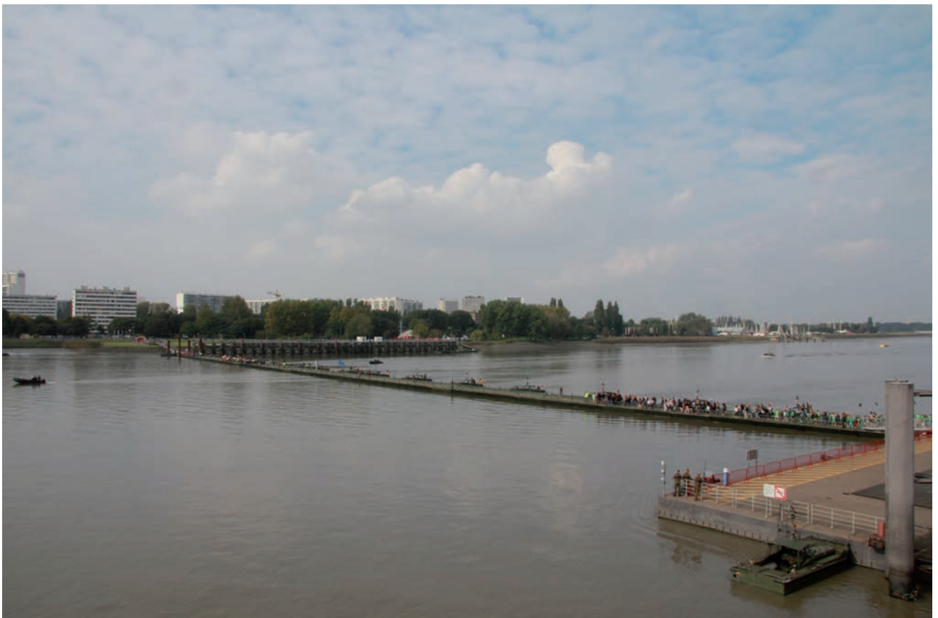
De complete brug op de dag van de officiële opening door het koningspaar in de middag van 3 oktober 2014.

* Het Vredescentrum werd opgericht in 1986 en probeert via dialoog, bijeenkomsten en manifestaties de vredesgedachte te bevorderen. Meer informatie onder andere over de herdenking van de Eerste Wereldoorlog: info@vredescentrum.be , telefoon 0032-3-338 83 03 (woensdag tot en met vrijdag 10-17 uur).