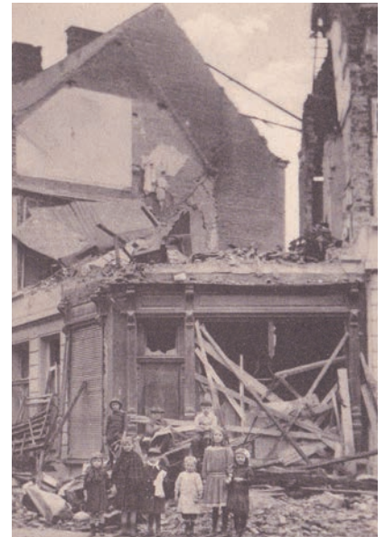
Het resultaat van de Duitse beschieting van 8 oktober.

Frankrijk verslaan. Dan konden ze zonder dreiging in de rug, Rusland aanpakken. Volgens het Duitse 'Schlieffenplan' zouden ze door België naar Frankrijk oprukken en het Franse leger vervolgens in een cirkelbeweging om Parijs insluiten en tot opgeven dwingen. Maar het