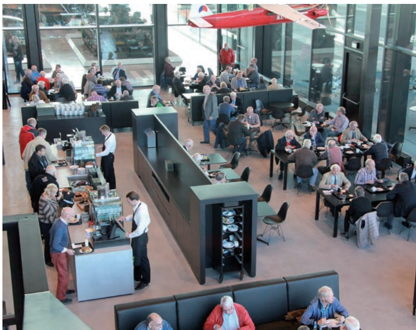
In het restaurant konden de Vrienden even op adem komen.

Het Nationaal Militair Museum (NMM) is op 11 december officieel door de koning geopend. Voor het zover was, werd er natuurlijk hard gewerkt aan het vervolmaken van de inrichting en facilitaire voorzieningen. Daarbij werd de hulp ingeroepen van diverse doelgroepen. Op dinsdag 28 oktober was het de beurt aan de Vrienden van de vier Defensiemusea.