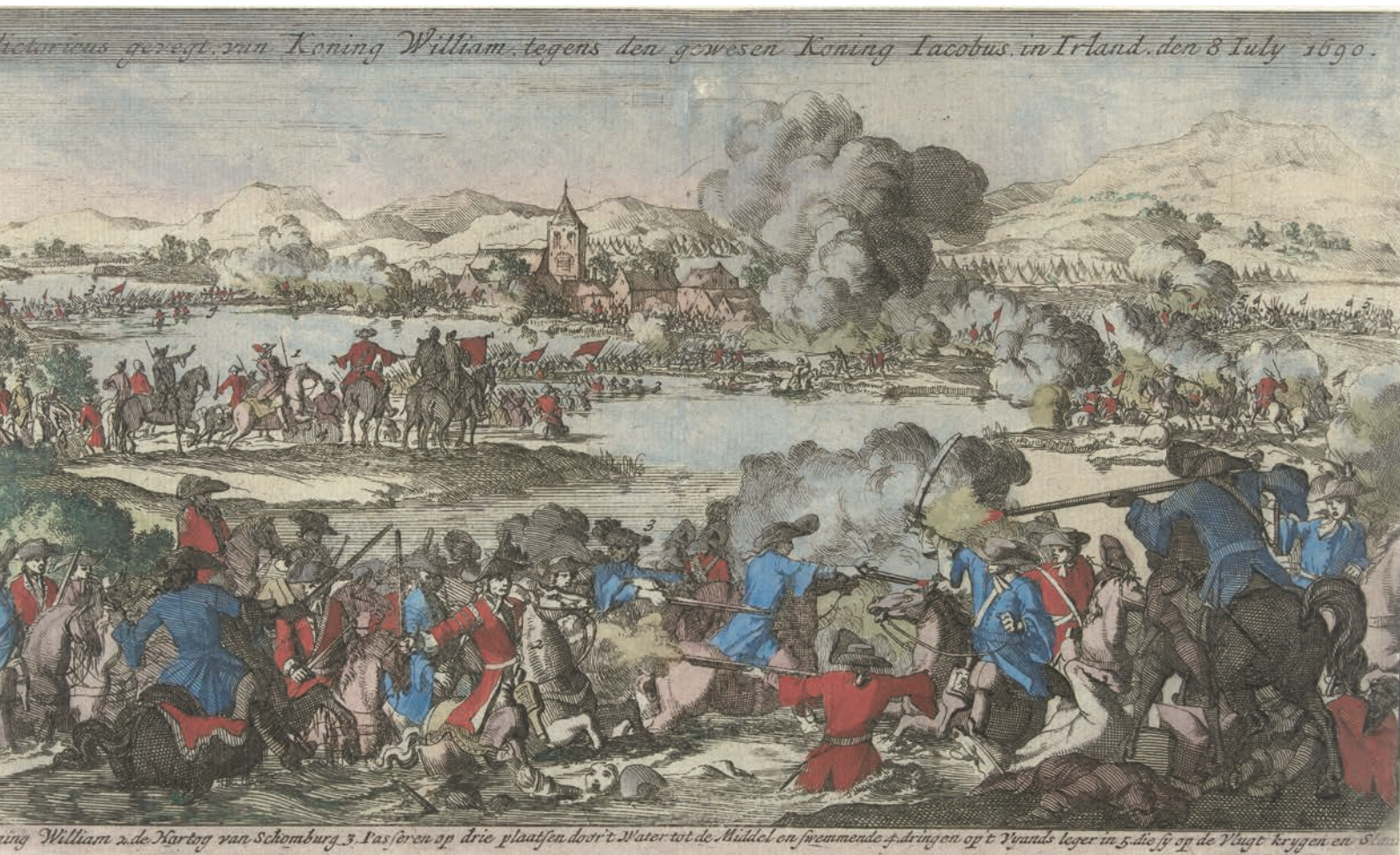
Een ets van de slag aan de Boyne, omstreeks 1700. De datum boven de tekening is overigens fout. (Collectie Rijksmuseum)