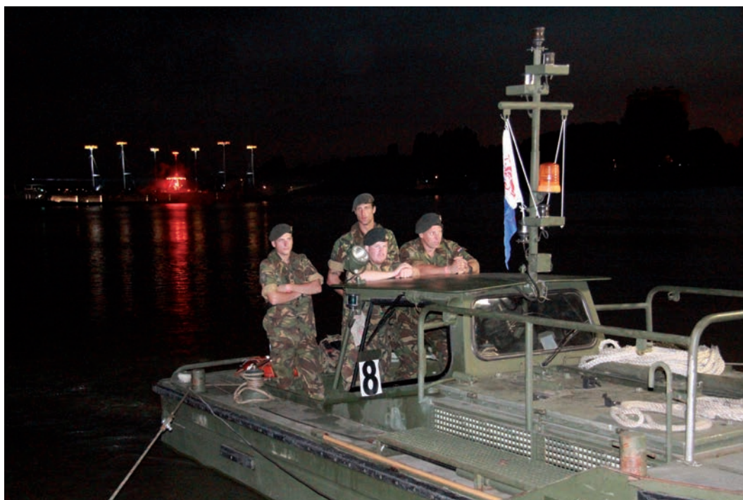
Motorbootjes van 105 Brugcompagnie uit Hedel houden de brug op zijn plaats.

De Belgische militairen hielden inmiddels stand achter de IJzer. Niemand won de race naar de zee. Van die Noordzee tot de