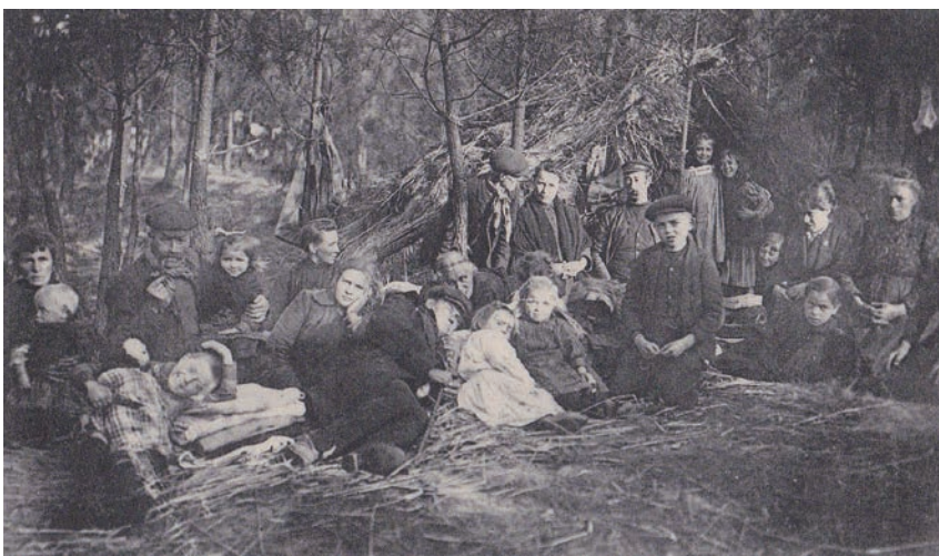
Vluchtelingen in de bossen bij de Nederlandse grens.

De invallers rukten op richting Namen en Brussel. Bij Haelen leden ze een flinke nederlaag, tijdens de 'Slag van de zilveren helmen' (naar de helmen van de Duitse cavaleristen). Maar ze waren onstuitbaar. Leuven werd ingenomen. Omdat de Duitsers geloofden dat ze door franc-tireurs waren bestookt, staken ze de stad in brand. Hierbij ging de beroemde bibliotheek grotendeels