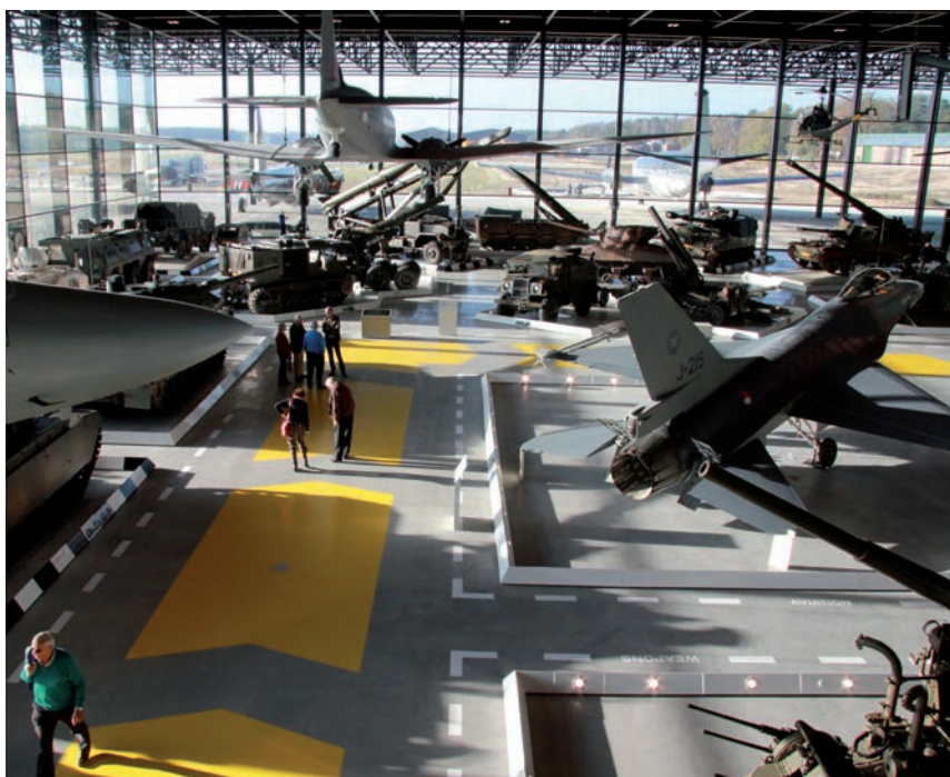
De hal is zo groot dat het aanzienlijke aantal bezoekers niet opviel.

Ruim 800 Vrienden gaven gehoor aan de oproep het NMM aan een kritische inspectie te onderwerpen. Veel van hen hebben hun mening gegeven via enquêtes, opmerkingenkaartjes en e-mail. Algemene indruk: de Vrienden zijn onder de indruk, velen waren aangenaam verrast door de uitgebreidheid van het getoonde en de contrasten tussen het 'staal' in het Arsenaal en het 'verhaal' in de tentoonstellingsruimtes. Ook de ligging in het bijzondere landschap en het uitzicht vanaf de toren oogsten bewondering. De Vrienden gaven het museum in zijn totaliteit een 8. Verbeterpunten zijn er ook: de zalen zijn hier en daar te donker, door de laagstaande zon zijn sommige vitrines moeilijk te bewonderen, er missen nog informatiebordjes bij diverse onderwerpen, de bewegwijzering is nog niet overal in orde. Aan al die punten wordt hard gewerkt. Een veel gehoorde vraag is of er nog gelegenheid gaat komen in de cockpits te kijken. Of dit gerealiseerd kan en gaat worden, is nog onderwerp van studie.