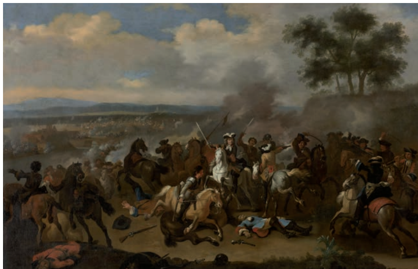
De slag aan de Boyne door Jan van Huchtenburg. (Collectie Rijksmuseum)

Het is 10.00 uur als Willem zijn hoofdaanval opent. Via een doorwaardbare plaats in de Boyne bijt de 2.000 man sterke Blauwe Garde het spits af. Ze vormen drie aanvalskolonnes van