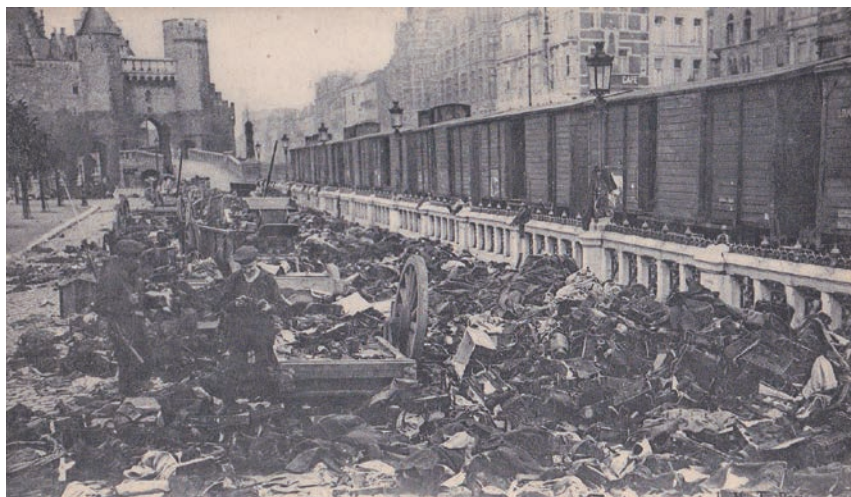
Achtergebleven bezittingen op de Scheldekaai bij de brug.

Maar de situatie verslechterde opnieuw toen de Duitse troepen op 6 oktober de buitenste fortenring doorbraken. Zij kondigden aan de stad te beschieten als deze zich niet overgaf. De koning vertrok uit Antwerpen en ook het Belgische leger