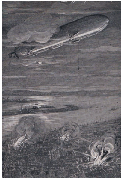
Zeppelinaanval op Antwerpen.

De spanningen in Europa liepen aan het begin van de twintigste eeuw sterk op en de algemene verwachting was dat er oorlog zou uitbreken. De moord op de Oostenrijks-Hongaarse troonopvolger Franz Ferdinand en zijn vrouw in Serajevo deed het conflict losbarsten. Veel Europese landen waren door verdragen verbonden, die bepaalden dat ze elkaar in geval van nood zouden helpen. Zo raakten de Centralen, het bondgenootschap van Duitsland en Oostenrijk-Hongarije in oorlog met de Entente, het verbond van Frankrijk, Groot-Brittannië en Rusland. Duitsland zou dus in het oosten én in het westen met een strijd op twee fronten worden geconfronteerd. Dat was een schrikbeeld voor de Duitsers. Ze verwachtten dat de Russen echter de nodige tijd nodig zouden hebben om te mobiliseren en wilden daarom eerst