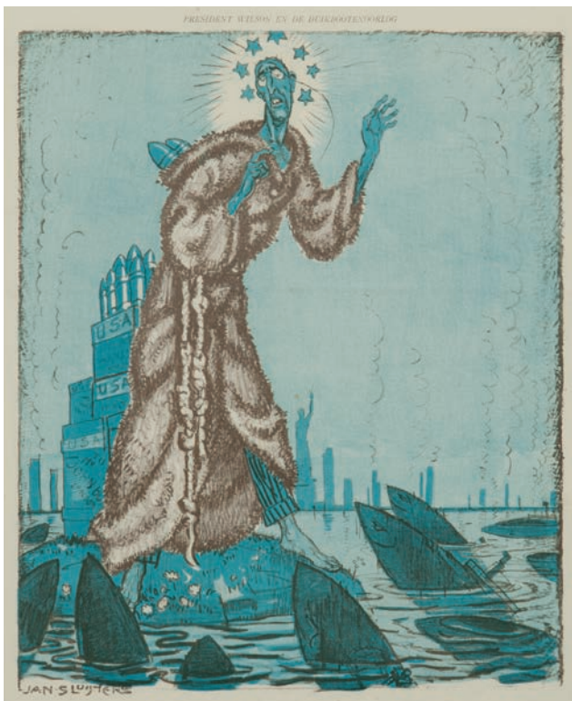
De heilige Antonius (Wilson) predikt de vrede voor de vissen (Duitse onderzeeboten), terwijl Amerikaanse munitie op verscheping naar Engeland wacht. (Collectie Museum de Fundatie, Zwolle-Heino/Wijhe)

In oktober 1915 tekende hij de 'moord' op Servië. Keizer Wilhelm II (met Pickelhaube) en keizer Franz Josef van Oostenrijk-Hongarije hadden het bijna naakte 'onschuldige' Servië te pakken, dat moord en brand schreeuwde. Tsaar Ferdinand van Bulgarije had net de kant van de Centralen (Duitsland en Oostenrijk-Hongarije) gekozen en trok grijnzend zijn zwaard om al vast een graantje mee te pikken, of misschien zelfs Servië een kopje kleiner te maken. Nu was Servië minder onschuldig dan het leek, want het land intrigeerde op de Balkan om tot één groot Zuid-Slavië te komen, uiteraard onder Servische leiding. Dat was niet naar de zin van Oostenrijk, dat ook zijn macht wilde uitbreiden in deze regio. Uit deze tekening bleek overigens dat Sluijters heel sterk was in het tekenen van naakt.