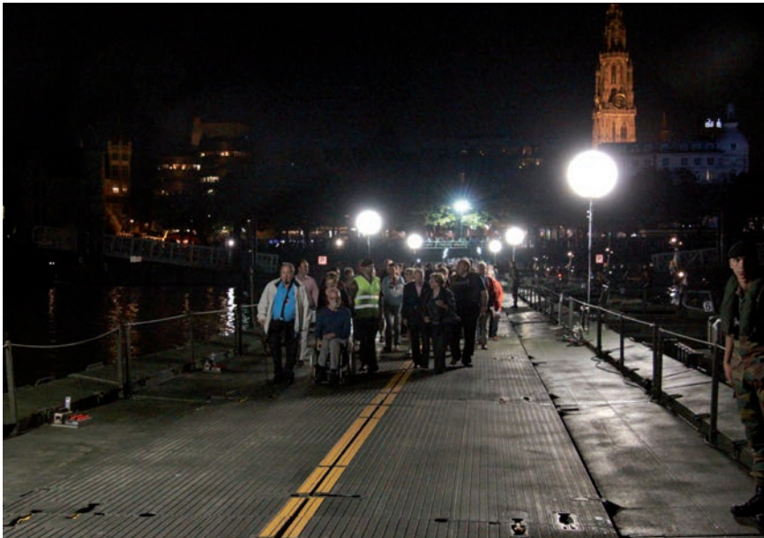
De eerste burgers wandelen over de brug, na de publieksopening op 3 oktober.

Zwitserse grens ontstond een stellingenoorlog. De soldaten verbleven jarenlang in de loopgraven, berucht door kou, modder, luizen en beschietingen.