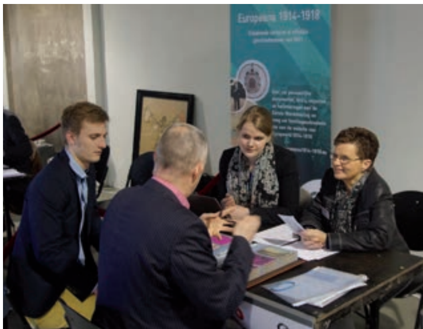
Tijdens de collectiedag in Doorn wordt een document besproken.

De Nederlandse campagne ging van start op 12 maart in Den Haag. Deze vond zijn vervolg in enkele 'meeneemdagen', die werden georganiseerd in kasteel Huis Doorn en in het Maritiem Museum in Rotterdam. In oktober, de 'Maand van de Geschiedenis' staan er nog enkele op het programma: vrijdag de 10e in de Tresoar in Leeuwarden, vrijdag de 24e in het Archief Eemland te Amersfoort en nog