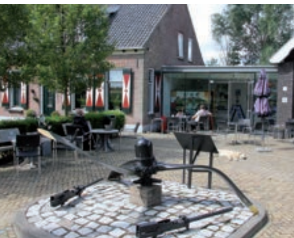
Exterieur van het museum, op de voorgrond de propeller.