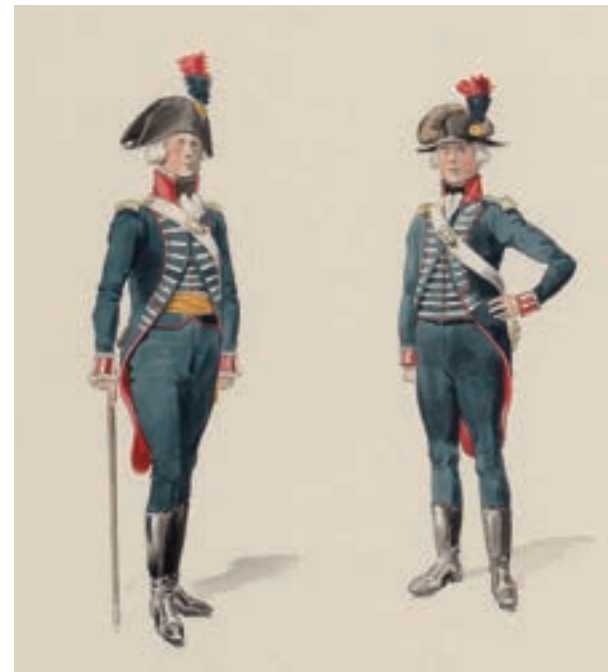
Het Staatse leger telt ook enkele regimenten van Franse emigranten, tegenstanders van het Franse revolutionaire regime, zoals het Legioen van Béon.

De Nederlandse hoop is de Fransen de oversteek van de rivieren te beletten. Maar de winter gooit roet in het eten. Als de rivieren dichtvriezen, is er niets wat het Franse leger onder generaal Pichegru nog kan tegenhouden. Snel gaat het onbezette deel van Nederland verloren. De stadhouder en zijn familie vluchten naar Engeland. Met Franse steun wordt de Bataafse Republiek uitgeroepen. Kwartiermeester-generaal Bentinck krijgt opdracht het leger te verzamelen. Officieren en minderen krijgen de keuze ontslag of de nieuwe machthebbers te gaan dienen. Het Staatse leger bestaat niet meer.