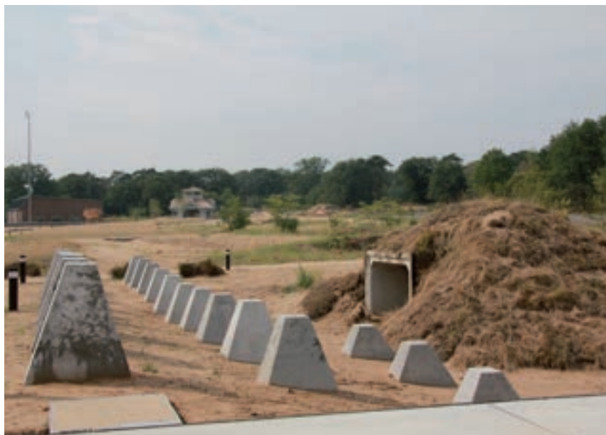
Drakentanden naast een blootgelegde personeelschuilplaats uit de Tweede Wereldoorlog.