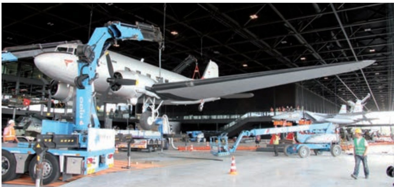
Centimeter voor centimeter komt de Dakota van de grond. Op de achtergrond de F15.

De Dakota deed van 1942 tot 1962 dienst bij de militaire luchtvaart van het KNIL, bij de Marineluchtvaartdienst en de Koninklijke Luchtmacht. Hij werd gebruikt voor het vervoeren van goederen, passagiers en parachutisten. Zijn werkkterrein was over de gehele wereld: voormalig Nederlands Oost-Indië, Australië, Nieuw-Guinea en ons eigen land. Hij is een van de grootste vliegtuigen, die in de hal zijn opgehangen. Zijn vleugels hebben een spanwijdte van 29 meter! In 1980 kreeg het Amerikaanse 32e Tactical Fighter Squadron op Soesterberg de modernste straaljager van dat moment: de F15 'Eagle'. Na de Golfoorlog verminderden de Verenigde Staten hun troepensterkte in Europa en keerden de F15's terug naar de States. Daarmee kwam hier ook een einde aan de samenwerking tussen de Amerikaanse en Nederlandse luchtmacht. Als herinnering kreeg de bevelhebber der luchtmachtstrijdkrachten een F15 aangeboden, die nu dus in het nieuwe museum hangt.