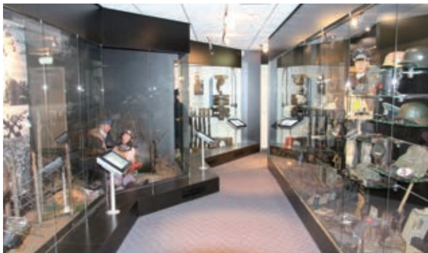
Professioneel ingerichte vitrines.

www.bevrijdingsmuseumzeeland.nl of per telefoon (0113) 67 14 75.