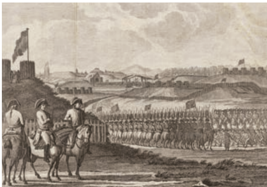
De Franse aftocht uit de vesting Landrecies 11 mei 1794. (Collectie Legermuseum)

De teruggekeerde stadhouder trof het toch al zwakke leger in een nog slechtere toestand aan. Daarom legde hij in zijn functie als kapitein-generaal (opperbevelhebber)