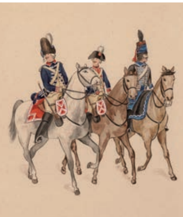
Staatse cavalerie, v.l.n.r. een Garde dragonder, Garde te paard en een huzaar van het regiment Van Heeckeren.

Willem V geeft zijn oudste zoon en erfprins Willem van Oranje het bevel over het veldleger. Zijn jongere broer Frederik voert een kleiner korps aan in de buurt