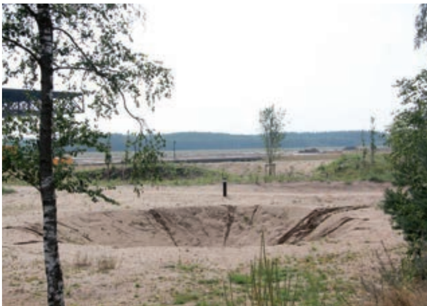
Bomkrater, souvenir van de Britse luchtmacht.

Ruim 400 parkeerplaatsen en vele fietsenrekken maken het mede mogelijk dat velen dagelijks het Nationaal Militair Museum én het landschap kunnen bezoeken. “Om zo”, besluit Van Tilborg, “te ervaren dat je óók in het landschap iets met je onderwerp kunt doen.”