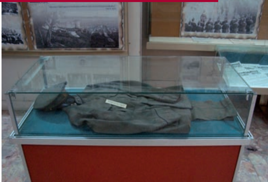
Het bewaarde uniform van Thomson in een vitrine in het Nationaal Museum van Albanië.

Rond Thomsons dood ontstonden meteen de wildste geruchten. Hij had met zijn rug naar de stenen schuur gestaan en was van voren geraakt. Dit betekende dat hij vanuit Durrës zelf was beschoten en niet vanuit de richting van de aanvallers. En volgens Reddingius wees de wond op een enkel schot over lange afstand met een