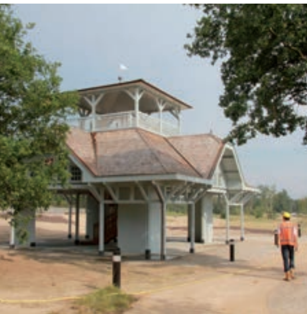
Het paviljoen uit 1912 op de oude vliegheide.