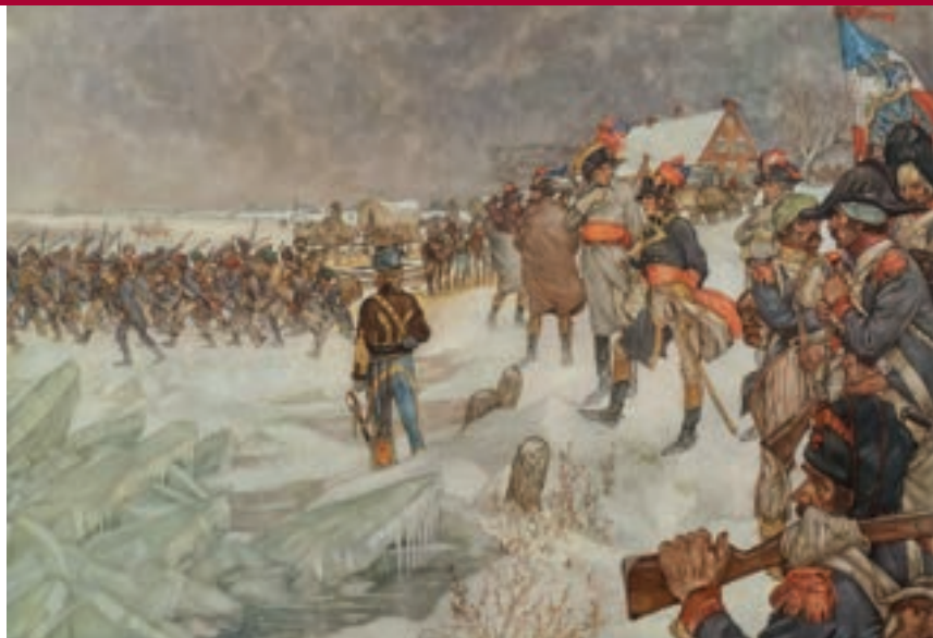
Pichegru leidt zijn troepen over de dichtgevroren Lek. Als Koning Winter de Franse zijde kiest, is de Republiek verloren.

Landrecies blijft een eenzaam succes, want de Coalitie wordt al vlug in het defensief gedrongen door de Fransen. En na de nederlaag bij Fleurus in juni gaan de Oostenrijkse Nederlanden verloren. De