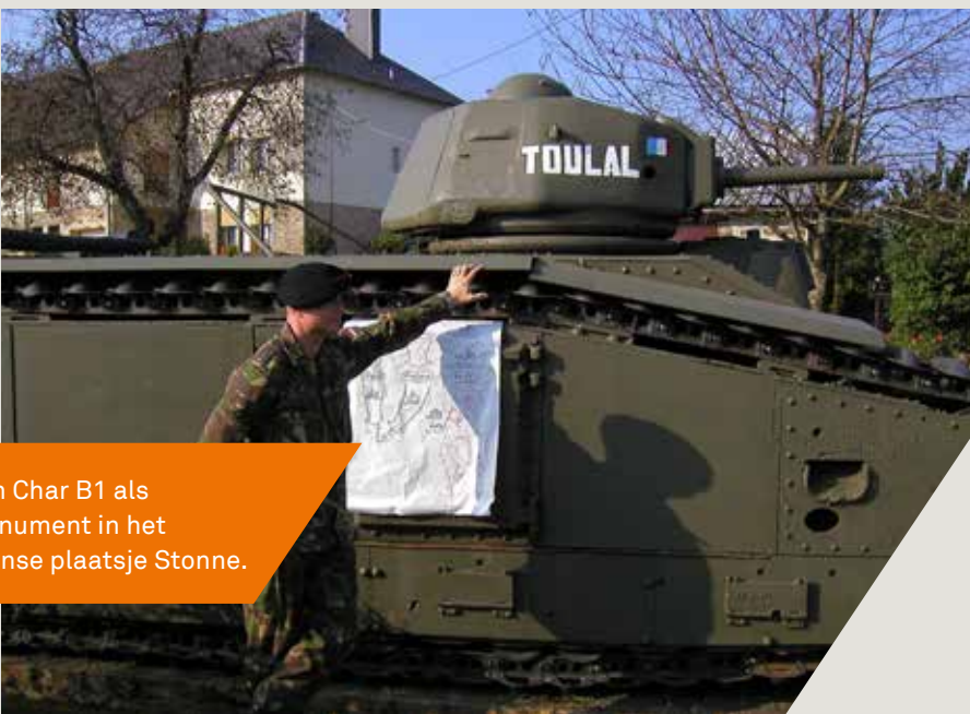
Een Char B1 als monument in het Franse plaatsje Stonne.

De strijd verliep voorspoedig voor de Duitse eenheden. De snelle inname van het strategisch gelegen Belgische fort Eben-Emael door Duitse luchtlandingstroepen betekende een belangrijke tegenslag voor de geallieerde plannen en een opsteker voor de Duitsers. Door een verrassende doorbraak bij Sedan konden de Duitse pantserdivisies snel doorstoten. De Franse en Britse troepen waren niet meer