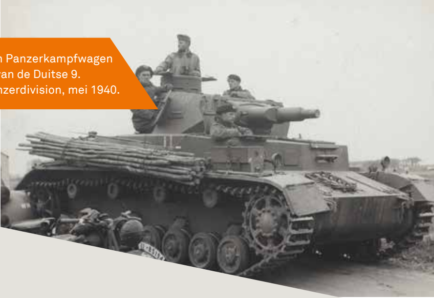
Een Panzerkampfwagen IV van de Duitse 9. Panzerdivision, mei 1940.

doorbraken te forceren waardoor de lichte tanks konden oprukken. Het concept viel op vruchtbare bodem en tijdens het interbellum verschenen in het Verenigd Koninkrijk, Frankrijk en Rusland twee typen tanks, elk berekend voor hun specifieke taak. Ook in Duitsland en de Verenigde Staten werd in eerste instantie voor deze koers gekozen. De tegenstander moest als het ware indirect worden bestreden, dat was vele malen effectiever dan proberen de hoofdmacht te verslaan.