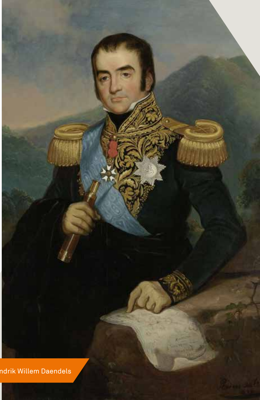
Hendrik Willem Daendels

Gaandeweg de 18de eeuw verloor de Republiek aan kracht. Onderlinge verdeeldheid (prinsgezinden en patriotten bestreden elkaar) en de oorlogen met Engeland en Frankrijk waren daar de oorzaak van. Ook de VOC boette aan belang in. Het bestuur van de compagnie, de Heren XVII, kregen te maken met teruglopende inkomsten. Weliswaar namen de winst op verhandelde Indische producten in Europa en door een steviger greep op de koloniën, de belastinginkomsten in Indië nog toe, maar elders in Azië moest de positie op de Europese concurrenten worden bevochten. De verzwakte Republiek kon dat niet waarmaken. Engeland bracht de bezittingen van de VOC in India in het nauw door het achterland te veroveren. Indiase textiel en thee wonnen aan belang ten koste van de verfijnde specerijen. Dit alles maakte dat de VOC financieel in zwaar weer terecht kwam. Na de Franse inval nam de overheid in 1795 de taken van de VOC over en eind 1799 werd de VOC formeel ontbonden.