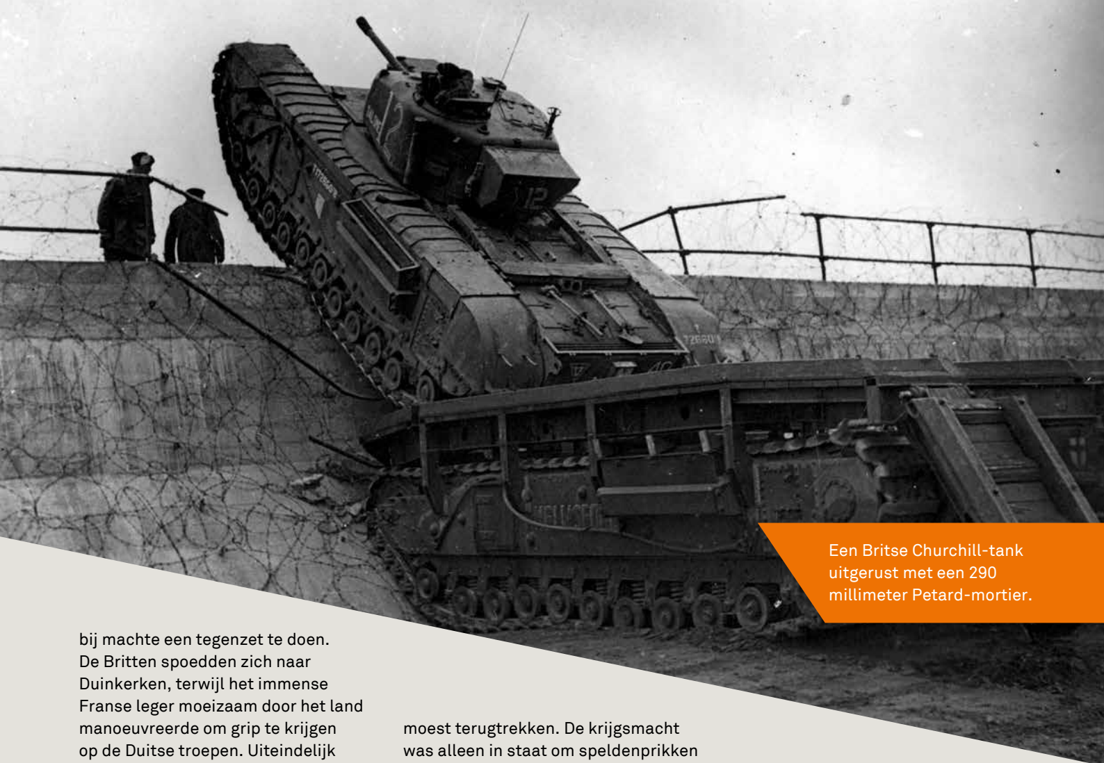
Een Britse Churchill-tank uitgerust met een 290 millimeter Petard-mortier.

bij machte een tegenzet te doen. De Britten spoedden zich naar Duinkerken, terwijl het immense Franse leger moeizaam door het land manoeuvreerde om grip te krijgen op de Duitse troepen. Uiteindelijk capituleerde Frankrijk na zes weken.