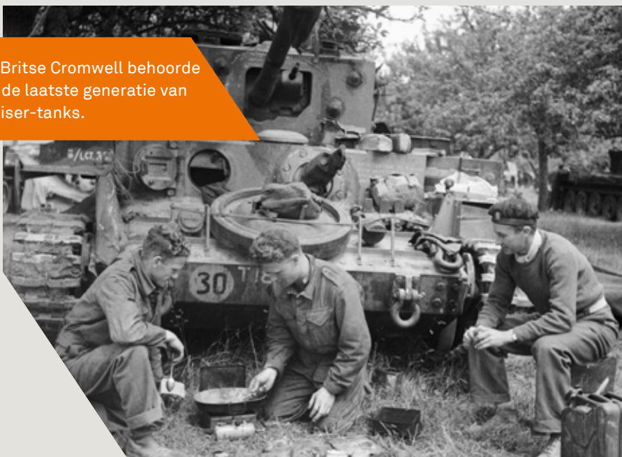
De Britse Cromwell behoorde tot de laatste generatie van cruiser-tanks.

De Duitse tankproductie groeide in 1942 en 1943 ook en benaderde cijfermatig de Sovjetproductie steeds meer. Kwalitatief waren Tiger en de Panther de meerdere van de T-34, vanwege de bepantsering en zware bewapening. Maar de Duitsers produceerden verschillende typen tanks, elk met hun eigen taak (verdediging en aanval). En de tanks waren alle zwaar en dus relatief langzaam. Hitler probeerde met Tiger en Panther tanks het strategisch initiatief te herwinnen, maar wachtte