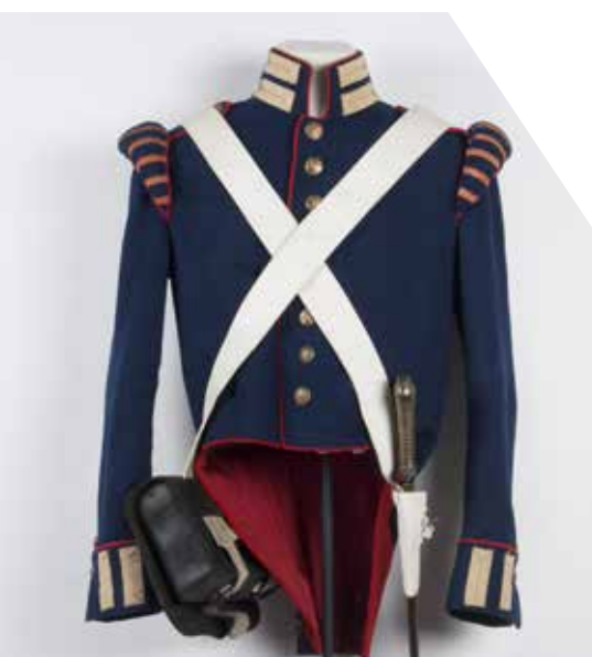
De rok van een Indische artillerist, na 1820 (Collectie Museum Bronbeek)

Op 11 augustus 1814 kreeg de vorst het verslag van de commissie aangeboden: het Rapport eener militaire commissie betrekkelijk de militaire magt op Java. Het rapport uit 1814 is een bijzonder document omdat het rode draden zichtbaar maakt in de geschiedenis van het Indische leger, tot aan het einde van de dekolonisatie-oorlog in 1949. De eerste rode draad was het uitgangspunt dat in de koloniale