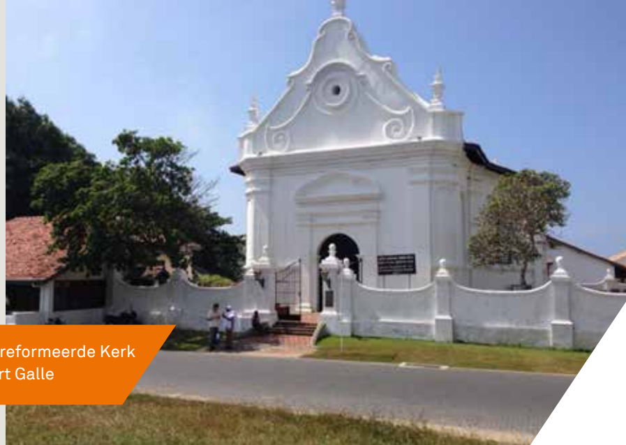
Gereformeerde Kerk Fort Galle

buiten Europa, in dit geval op Ceylon, hebben toegepast. Deze Europese fortificatiekunst was superieur in een wereld (Zuidoost-Azië) die tot dan toe weinig ervaring had met ommuurde steden en evenmin bekend was met de inzet van militaire middelen (artillerie) in en rond een fort. Via het fort dat veelal op strategisch ideale locaties was gelegen, konden de Nederlanders hun gezag vestigen en uitbreiden en tegelijkertijd de lokale grondstoffen (kaneel en goud!) benutten om hun hegemonie te versterken.