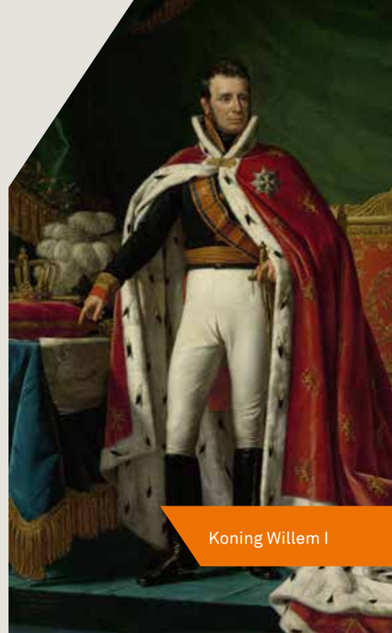
Koning Willem I

De derde en laatste rode draad die het rapport aanstipte, betrof de kwaliteit en de betrouwbaarheid van het leger. Volgens het rapport was voor de herbezetting van Java en de andere bezittingen een legermacht van 10.475 man nodig. Het zou voor de helft uit Europese militairen (5.125 man) en voor de helft uit inheemse troepen (5.350 man) moeten gaan bestaan. Een relatief zeer kleine troepenmacht dus, zeker in vergelijking met de naar schatting honderdduizend Chinezen en circa 4,5 miljoen Javanen die destijds op Java woonden. De kern van het leger bestond uit Europeanen en zij bezetten ook alle officiersrangen. Het leger in de kolonie was getalsmatig weliswaar klein, maar het ontleende zijn kracht aan betrouwbaarheid van de inheemse en de superioriteit van de Europese militairen.