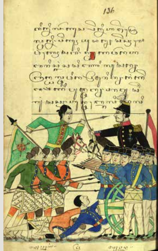
Het gevecht bij Selarong, Midden-Java, Javaans Manuscript, 1866. (Collectie Universiteitsbibliotheek Leiden, D OR 13)

Hoe moest de Nederlandse legermacht in deze overzeese bezittingen eruit zien? In juni 1814 zette de Soevereine Vorst - de latere koning Willem I - een militaire