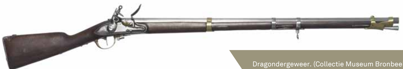
Dragondergeweer. (Collectie Museum Bronbeek)